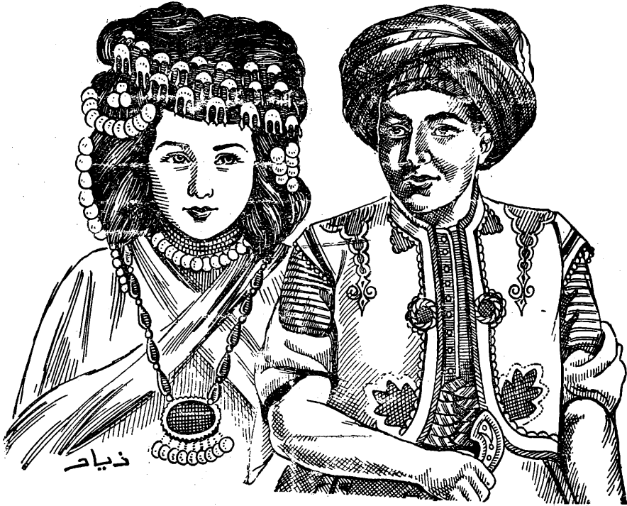
ذیاب زین ئەو کچی وا بەشەرمو روسور