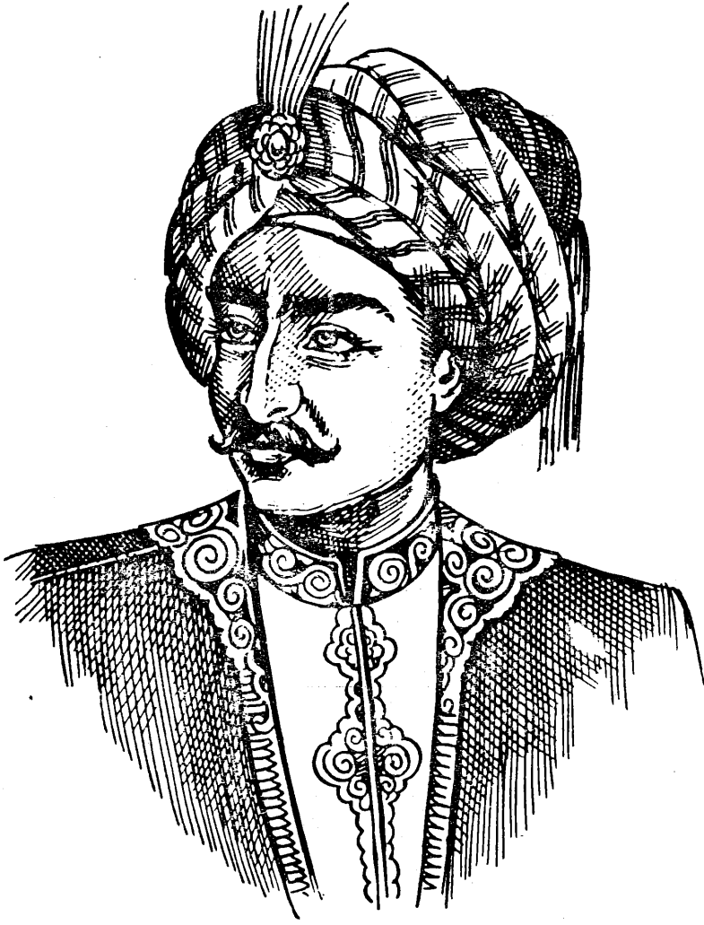
زیانی نه‌ده‌دین و بی به‌زین بو ناویشی نهمیر زهینه دین بو