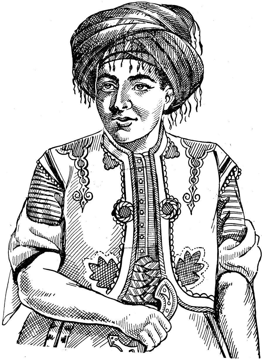
دل بهندی خه مانو ناوی مه مبو