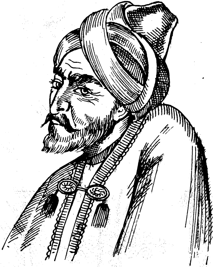
بەدەر بو بە گەرد بو دەم گەورد بو ئەم بېزوو بە گەرد بو مەرگەورد بو