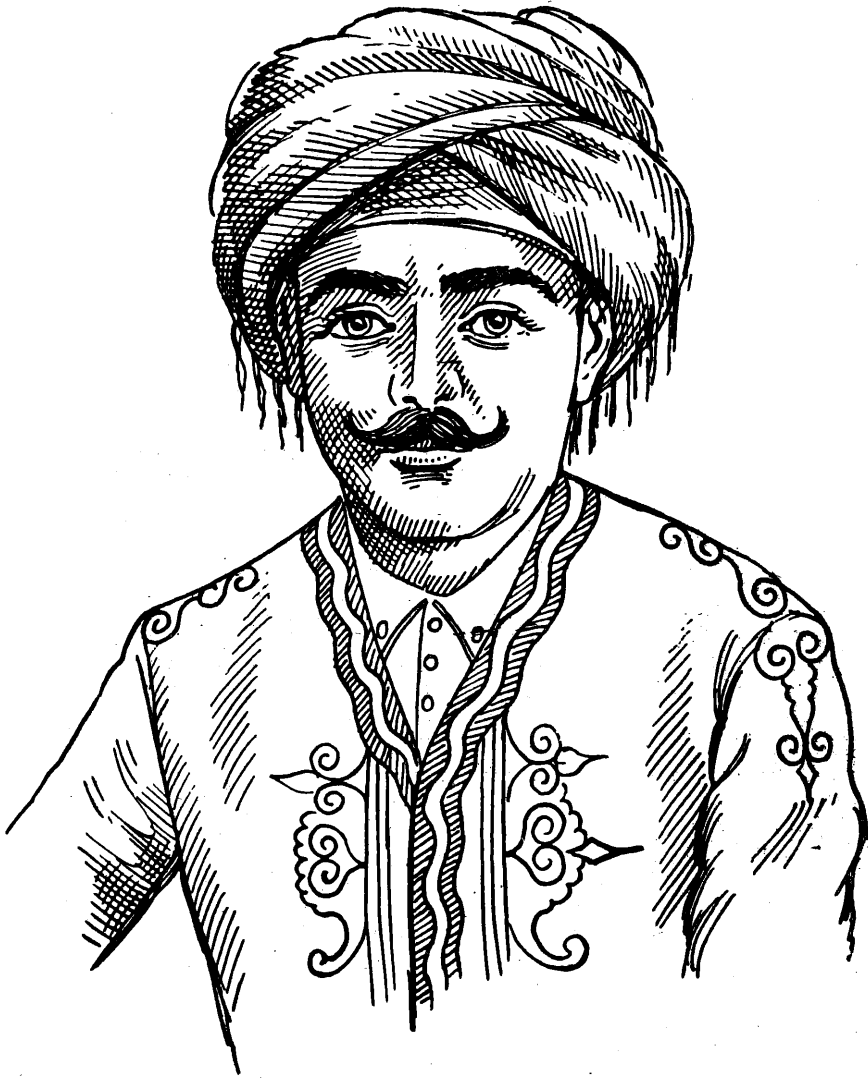
نازایی له پاش ئهوان درو بوو