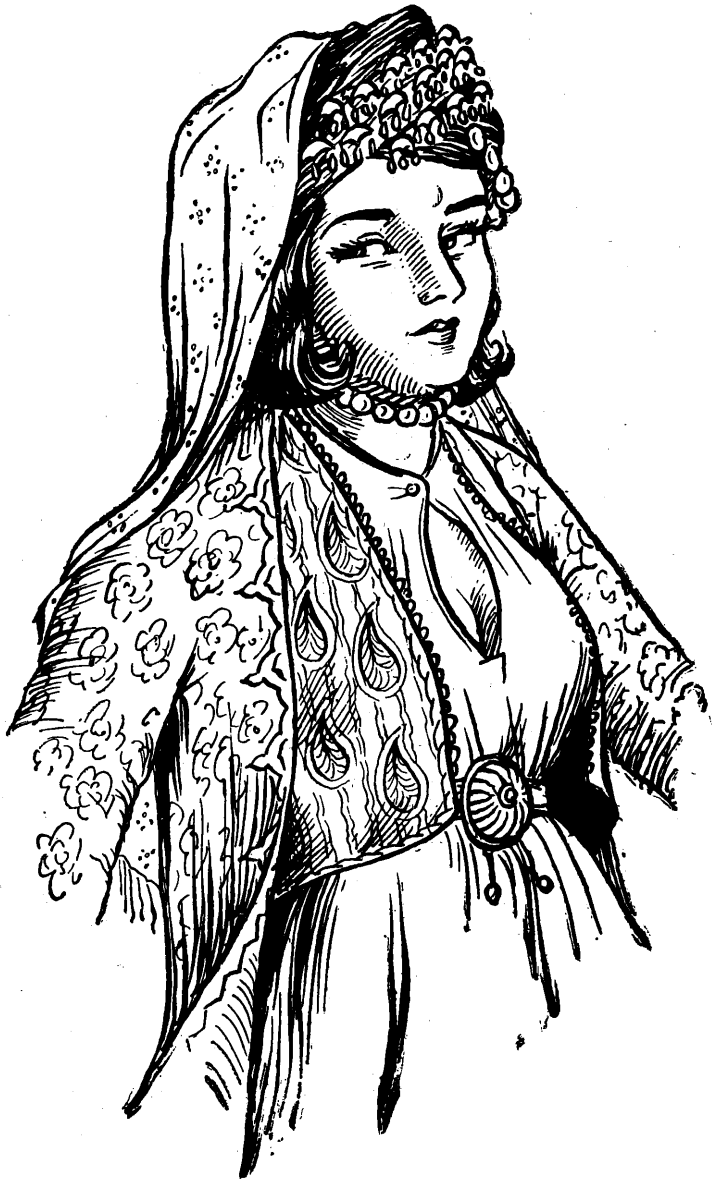
دلدارى ده‌کوشت به‌چاوى مه‌ستى نه‌و ناوى نرابو خاتون نه‌ستى