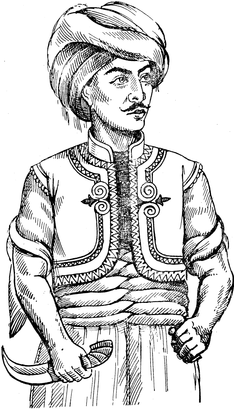
تازدين بو بهلام چنو جوانيك ! گوده رزي جهانو پالموانيك