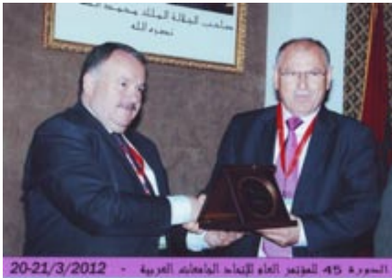
السورة 45- المؤتمر العام لاتحاد الجامعات العربية - 20-21/3/2012

پرؤفيسورى پسپورى كيميا له ههريمى كوردستان، ههچهنده پسپورييه كهى زانستى په تيبه، كه چى قابوته وه له بواره مرويه كانيش، ئەوه تا دواى ۱۰ سال خزمەت كردن له بوارى په يوه ندييه ئە كادي ميه كان له ۲۰۰۳ تا ۲۰۱۳ ههول و تيكوشانى واى كرد به هوى ليها توويه كه وه وهك يه كه م كورد و يه كه مين سهروكى زانكۆ له سه ر ئاستى عيراق بۇ يه كه مين جار له كۆنگرهى ۶مين سالانهى يه كيتى سهروك زانكۆكانى ولاتانى عه ره بيدا له سالى ۲۰۱۳ هه ليزيردريت به سهروكى ئەنجوومه نى راپه راندنى ئەو يه كيتيه و سهروكى خولى ۶مينى ئەو كۆنگره، به هوى پينگهى دزهى بۇ يه كه مين جار ئەو كۆنگره يه ده هيتيرتته ههريمى كوردستان