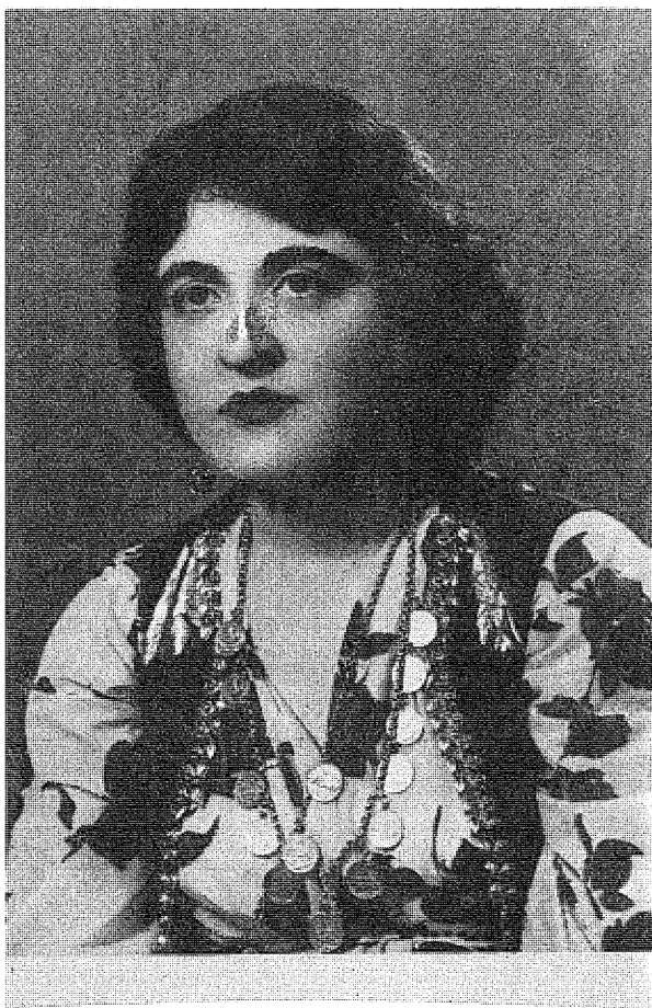
من منالہ کہم کہ تو بیان کو شتم ٹازاری سہختو سو سیان بی چہ شتم