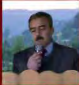
شکر مصالین شیخ چلی / ملامی