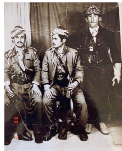
په سوول هه دریشی، محق گه ودا و نووری خدر.