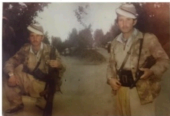
شهيد مفاوير شيلاني ۱۹۸۳ ئيران.

ويئەريين دهقەرا داستان لى هاتييه نه نجاهدان