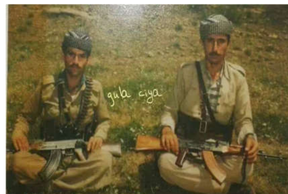
عه بدولکه ریم فه رحان که شانی. عه بدولجه بار خواجه شیلانی.