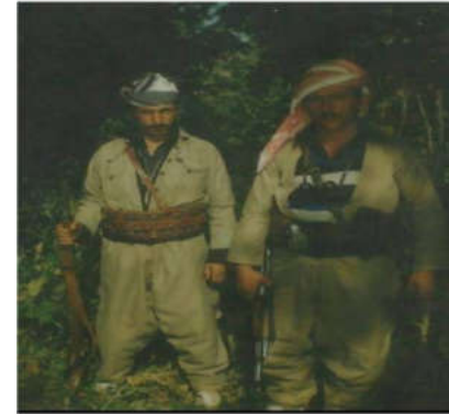
حه سه ن محه مه د و عه بدولجه لیل خال د .