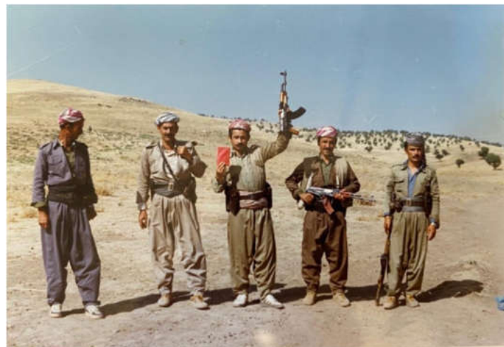
عیسا، عه بدوللا، محق گه ودا، سه بری علی و ته مهر بلدیشی.