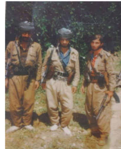
شهید: مغاویر شیلانی. شهید: عه بدولجه بار خواجه شیلانی. سه لمان صالح شیلانی.