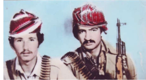
شهید: عه بدولجه بار خواجه شیلانی. شهید: مغاویر شیلانی ل سالا (۱۹۸۲) سی