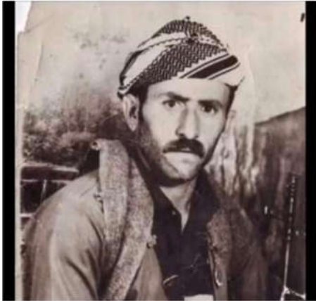
شهید: حه سه ن محه مه د شیلانی ل سالا (۱۹۸۵) سی هاتییه شه هید کرن.