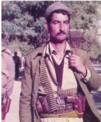
حه سه ن ئیبراهیم عومه ر، به رنیاس ب (ئه بۆ برقی) .