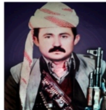
شهيد: محق گەردا.