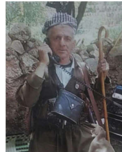
عادل مه لا سه لام به رنیاس ب (فه رخی شیلانی) ل ساللا ۲۰۱۷ چوویه به ر دلوقانییا خودی .