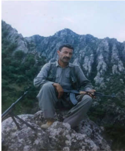
سه لمان سالح ته یب شیلانی