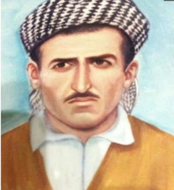
شه هيدى داستانى: نه حمه د يه حيا تهيپ.