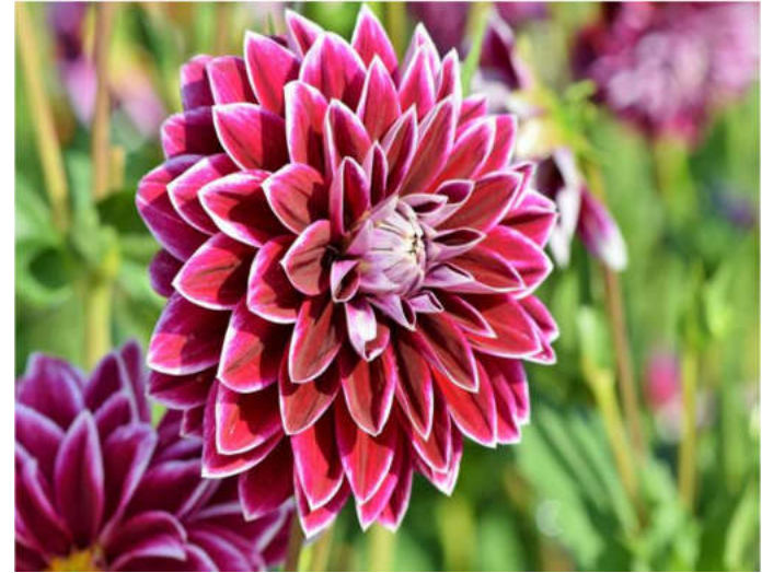
شه هيدى داستانى: سالح عيسا مه جدو.