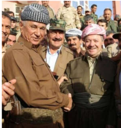
سەرۆك بارزانى، ئۆسمان قاسم و عەلى قادۇ شەرىئە داعش ل ساللا ۲۰۱۴-يى.