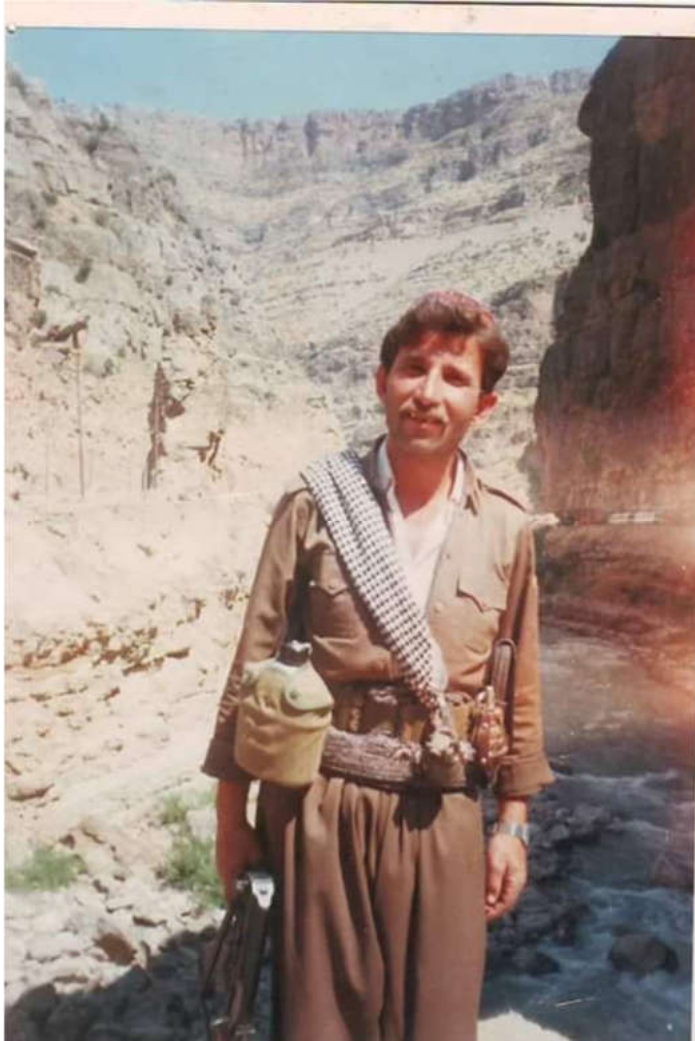
نقىسهرى داستانى: جه ميل سه ديق باپير گولى به رنياس ب (مغاوير شيلانى).

۱۳) هوزا گوليپان ئيك ژ هوزين كوردانه و ل سنورى ده قه را زاخويه، ديروكا وى ديار نينه، به لى ل دويڤ به لگه نامه بين ئوسمانى به رى سالا ۱۵۰۰ ى ئه ق هوزه هه بوويه و ژ شينوارين قى ده قه رى ديارن ئه ق هوزه ل سه رده مى به رى ئوسمانيبان ژى هه بوو. بنيره: هيرش كه مال ريكانى، عه شيره تين به هدينان (۱۵۱۴-۱۹۱۹) ز، دانه نياسينا جوگرافى و كورتييه ك ژ ديروكا وان، سه نته رى بيشكجى، (دهوك: ۲۰۱۹) ل ۴۶۳.