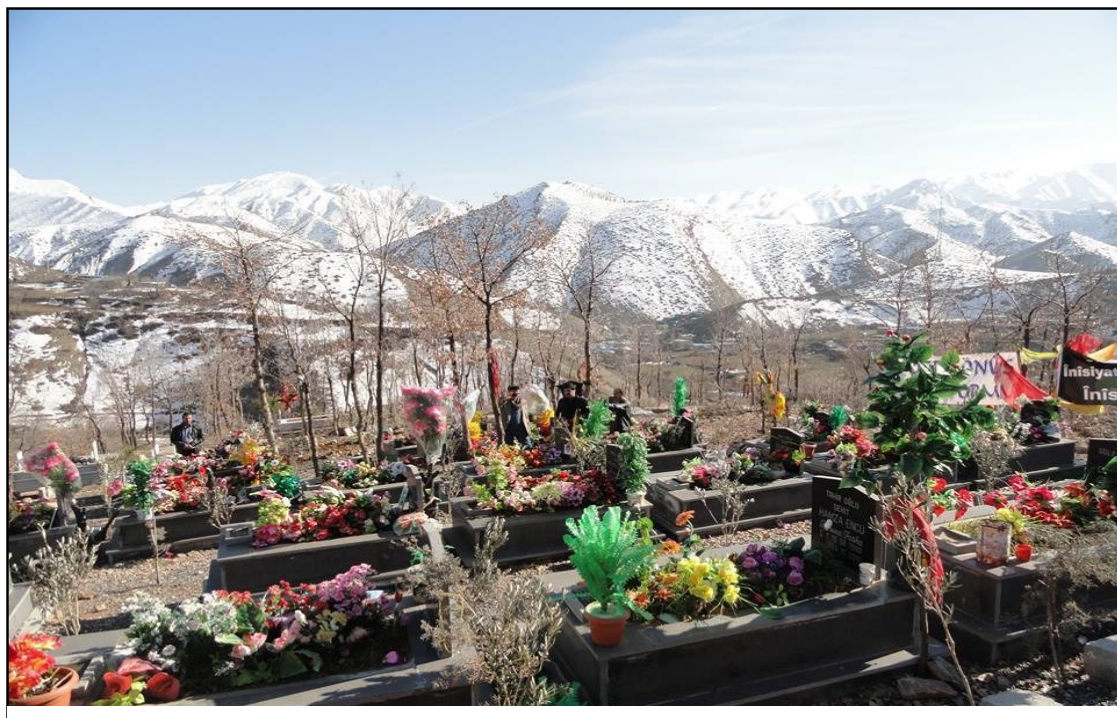
مەزاری شەهیدین رۆبۆسکی ب کامیرا نفیسکاری

ب هزرا من کوشتارا رۆبۆسکی ژ کوشتارا گەلی زیلان ۱۹۳۰ و دیرسیم ۱۹۳۸ و دەهان کوشتارین ترکان ل کوردستانی ئەنجامداین کیتر نینە، بەلکی دوبارەبوونەفەیا وانە، تنی جوداهیەك هەیه ئەو ژی ئەوہیە ئەف کوشتارە ل جەهەکی هاتیەکرنا فادا شەرییە و قوربانی ژی نە شەرفانن، د سەدسالیا بیست و یەکیدا هاتیەکرنا کو ب سەدسالیا مافی مرۆفان و دادویری هاتیەنیاسین و ب چەکی