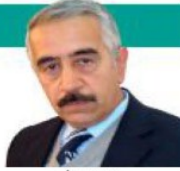
جېنۇسايىدا كوردان ل سورىن