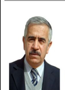
موسەڵەق توفى ٤-٤

ل رۆژا ٢٥ نیلۆن ب مەرەما پشکەداری د فۆروما جفاکیا میزوپوتامیدا دگەل شاندەکی یەکیتیا نەقیسکارێن کورد- تایی دھۆکێ مە بەرەف باژێری ئامەدێ (دیاریەکرێ) دا رێ و ئی چالاکیێ ٢٦-٩/٢٩ فەکێشا. ب کورتی ئەف چالاکیە ئانکو فۆروما جفاکیا میزوپوتامیا، چالاکیە سیاسی، جفاکی و رەوشەنگیری بوو، کوردین پاکوورێ کوردستانێ و یێن پارچین دی یێن کوردستانێ دگەل چالاکیانێ وارین جودا جودا یێن جیھانی ل هەف جفاندن، دوست و هەف سۆزین دۆزا کەلێن کوردێن پاکوورێ کوردستانێ ل ئامەدێ مێشانداری، ئەف ل هەف جفاندن و مێشانداری ب خۆ د خەزەمتا گەلێ کورد دا، یە، زیدە باری چالاکیێن هزری، سیاسی، رەوشەنگیری یێن د رۆژێن ٢٦- ٩/٢٩ دا هاتینە گێران و پێشکەشکرن. ل ئێرێ مە نەفیت بچەمە د ئاق چالاکیان و هەلسەنگاندنا وان و نەرتینی و نەرتینی یێن وان دا، بەلێ ب کورتی دئ بیژم هەر رەنگە چالاکیەک د هەر وەرکیدا ل پاکوورێ کوردستانێ بەتتە گێران دئ بەرەکی د رێکا خەباتا گەلێ کورد ل ئی پارچا مەزنا وەلانی فەوژتیت. بەلێ ئەوا مە دھیت ل ئێرێ و بۆ خواندەفانین ئێرێ بەرچاکیەکەم چەند تێبێنی و هزرو بۆچوونەکان د ئی سەرهدانیدا کەتینە د هزرا مە دا، ژمەرکو ئەف سەرهدانە ل