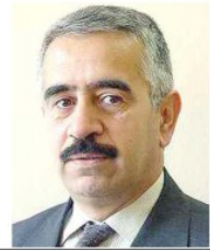
موسەڵەق توفى ٤-١

مێشانداریان دجیت...؟ چەند ژ فان مێشانداریان د بنیاتدا پیدەفی بینان یان د شیان دا هەبە مەزخاڤتین وان چەند جارکی بێتە کێمکرن...؟ نەری چەند د رافق ژبەدە ل فان مێشانداریان دەیتە مەزخاڤت...؟ نەری نەگەر مێشانداریان مە ژى ب رەنگ مێشانداریا باژێرقانیا جزیری بن دئ چ ژ بەمژنا خسودەین مێشانداریان کێم کەت...؟ نەری نەگەر هندی د شیان دا هەبیت مێشانداریان کێم کەت...؟ چنکو ئەو کەس یان کەستین ژ جەهەک پەلەندتر ژ مە دەیتە سەرهدانا فەرمەمانگەهین مە ب نەرهەکی هاتیبە و بەرامبەر وی نەری دراڤ ژتیرا دەیتە مەزخاڤت. نەری ب کێمکرن مێشانداریان دئ چەند دراڤ ژ بەر مێشانداریان مینیت و دئ چەند خەزەمتێ گرنەگ پێ هیتە نەجمەدان...؟ ل داویین دئ بیژم مە ناماژە ب مێشانداریان فەخوارتێن کجولی نەگەرە و هەقیە کەسەک باوەرەیت ب راویژکەوین دلسۆزێن خۆ نەکەت دەمی دبیژنی سەیدا مەرەسا وی ژ نەقیسەین توی... و بلا باش بزانیەت مەرەسا مە نە ئەو بەلکی مەرەسا مە هەر کەسەک یە بەبەت ژ دکریت و خەمێن ژ سامانێ گشتی ناخۆت، ئەو بێت یان بێتدی. مالا باژێرقانیا جزیری ئاقا بۆ فراقینا وان و شیرەتا د فراقینا واندا نەگەر بۆ خۆ مفاى ژن وەرگرن.