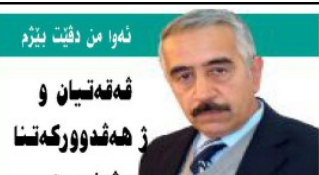
موسدوق تزیی رۆژنامه نیسیری ٢

د خەڵەکا چوویی دا چەند ئالیبەکتێن دیاردەیا (قەقەتییان و ژ دەقدوورکەتتا رەوشەننیری) یا توشی نقیسکار و رۆژنامەفانیان بادینان بووی مە بەرچا فکرن، ئەف ددەقەر ل بەر چەندین هوکاران ژ ئالیین رەوشەننیری قە ژ دەقەرین دی یێن کوردستانێن قەدەر بوویە، بەرەمەتێن دھۆکن ل دھۆکن دەهتتە نقیسین و ل دھۆکن دەهتتە بەلا فکرن و تێن ل دھۆکن دەهتتە خواندن. و ژ بۆ کیتێرنا قێن دیاردەیی دێن چەند هزر و پێششیا زەگان بەرچا فکەم ب وێ هیقین کەستین پەبوونیدار ل سەر راوستن: ل بەراھینی مە گۆت: هێژ خواندەقایی کوردی ل قێن دەقەرێن پێنەگەشتیە... ب هزران مە بەری هەر دەزگەھەکی و کەسەکی ئەرکێن پەرەردەن و سامۆستایانە خواندننا پەرەتووک و کۆفار و رۆژنامەیان ل بەر خویندکاران شیرین بکەن، د شیاپتین سامۆستایان دا هەبە، سالانە چەند پەتووکان ب خویندکاری بدەنە خواندن، د دەرسا خودا سفای ژێن وەرگری و وەگ خواندەقاییکێن بەرەدوامێن پەرەتووکێن کەسیت. گەلۆ ل سنووری پارێزگەھا دھۆکن چەند خواندەنگەھان پەرەتووکەتتا پێن ب سەرەبەر پان نێقەدەر لەمەند هەتە...؟ د دەسەکی دا پراپتیا پەرەردەییێن قەزان هەریەکی کۆفارک هەبە و پشیرا بەرەبەرین وان چالاکیتە...!! ئەگەر پارێزگەھێ کۆفارک پەرەردەیی هەبۆایە و دراقن ماسی ل پەرەتووکەتتا هاتیا مەزاختن دا تارماجەکی مەزتر دەستقە ئینیت.