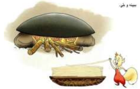
پىتە و نۇ

پىشەكى / پىداچوونەو بە پىتە خوئندراۋەكان بەدانانى ئەم وشانە لەكارت (خانۋ ، خەم ، خەيام ، باخ ، خۇر ، خەندە ، خەيام ، خەزان ، خاۋلى) لەسەر بۇردەكە بە ھەنگەراۋەيى كە پىتە خوئندراۋەكانى بابەتەكانى رابردوۋى تىدا بىت و قوتابى كارتى ھەنگرىت و بىخوئىنەو پاشان لەسەر بۇردەكە بىنوسىتەو .