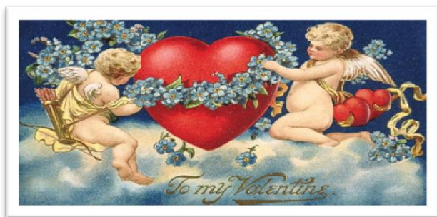
کارتی سلاوکردنی سه دهی ۱۹

پوژی فالانتاین له ناوه راستی سه دهی نوزده یه مه وه دهستیپیکرد، که بازرگانه ئه مریکیه کان نه ریتیکی ئایینی باویان کرده بو نه یه کی هاوچه رخ. په نگه زور کهس ئه وه نه زانن که ئه و بو نه یه به پشووی مه سیحی دهستیپیکرد بو یادکردنه وهی قه شه یه ک به ناوی فالانتاین ۱ .