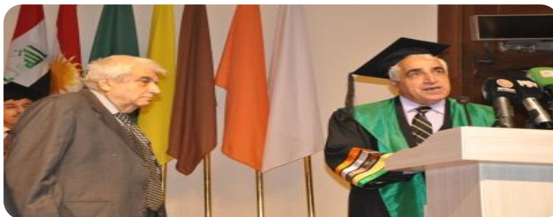
سه رۆکی زانکۆی کۆیه پیریاری پێدانی پروانامه که ده خوینیته وه