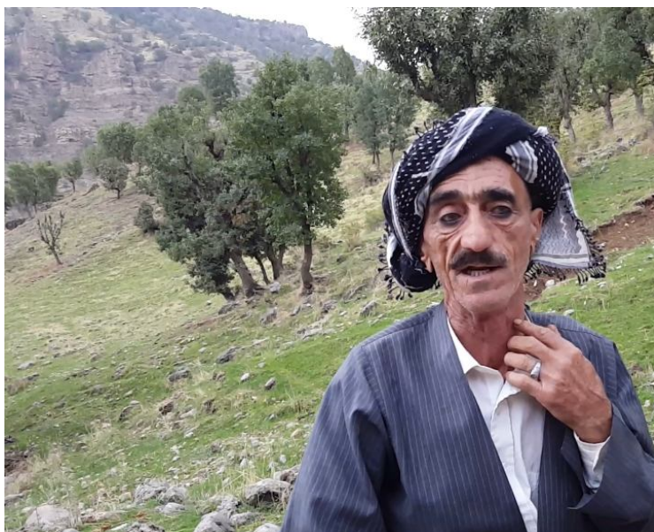
سمایل چاورهش وهرتی له کاتی بالۆره لیداندا