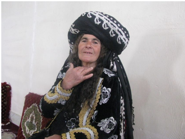
ژنیکی که لهووری له کاتی خویندنی بنملی (بالوره)دا