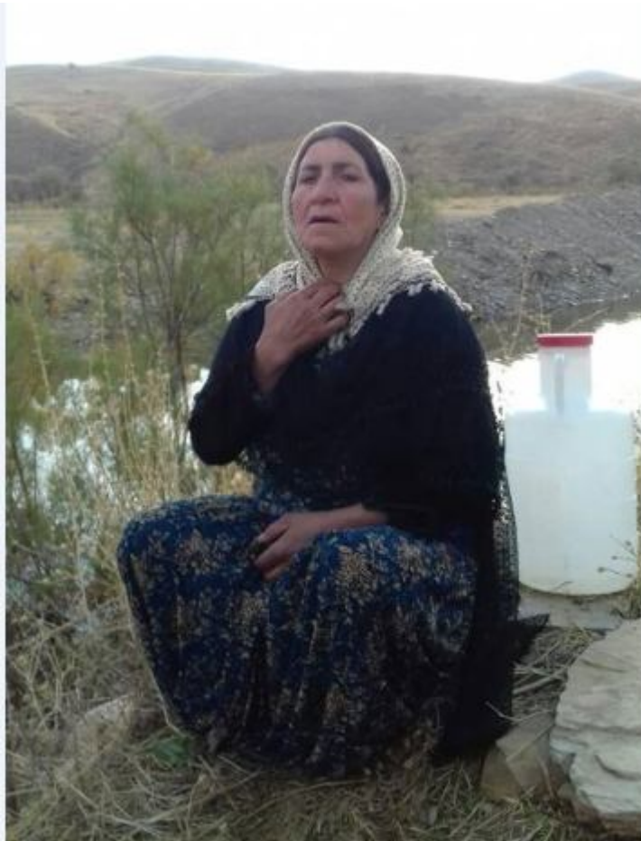
ژنیکی موکریانى له کاتى بالۆره لیداندا