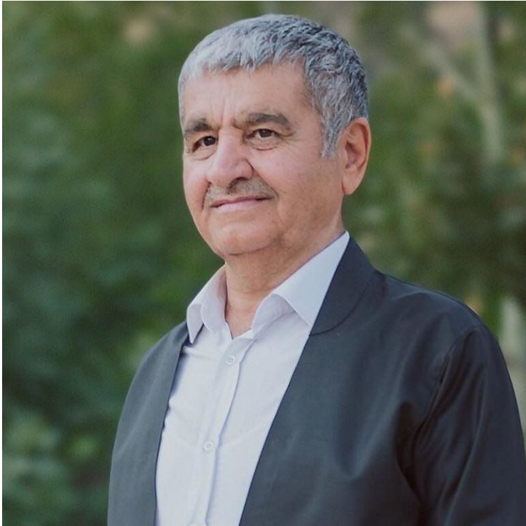
م. عهالی سینوہیسی