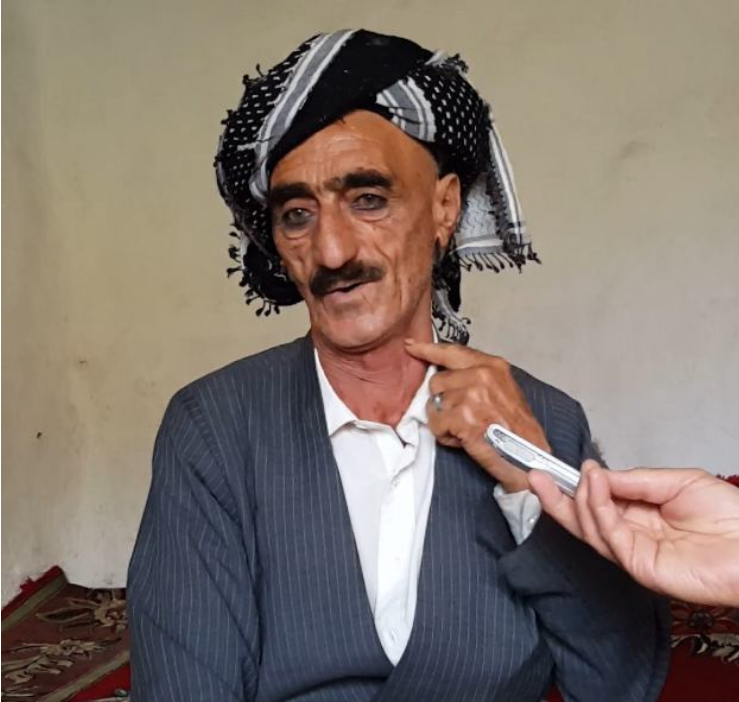
سمایل چاورهش وهرتی له کاتی بالۆزه داینداندا