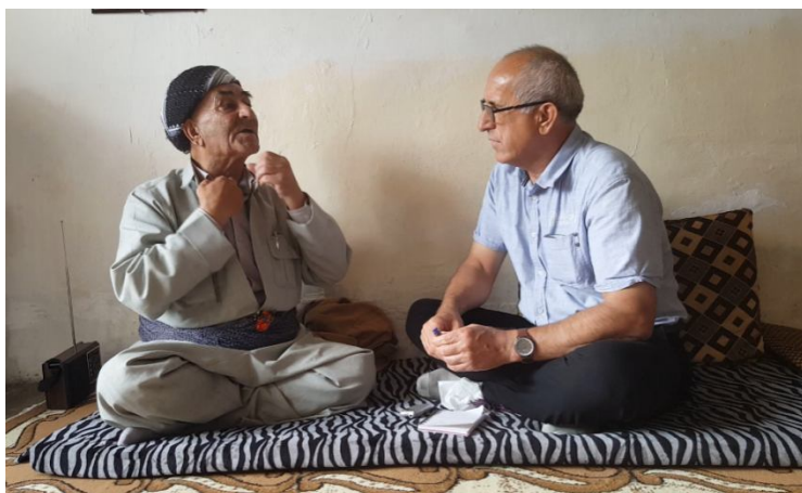
شیخ تہ لعدت روستی، لہ کاتی باسکردن لہ بالورہ