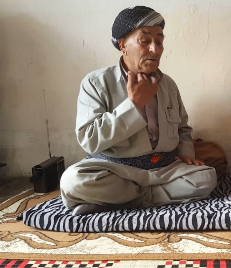
شیخ تہ لعدت روستی، لہ کاتی باسکردن لہ بالورہ