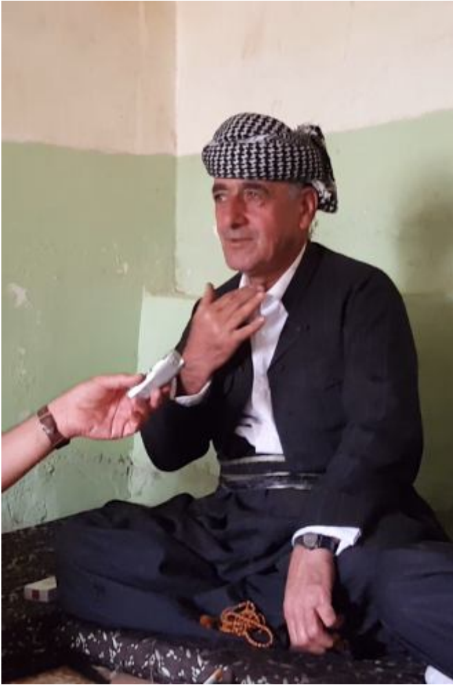
مهلا خدر بالئی له کاتی بالۆزه لیداندا