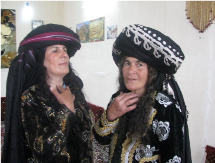
دوو ژنی که لهوری له کاتی خویندنی بنملی (بالوره) دا