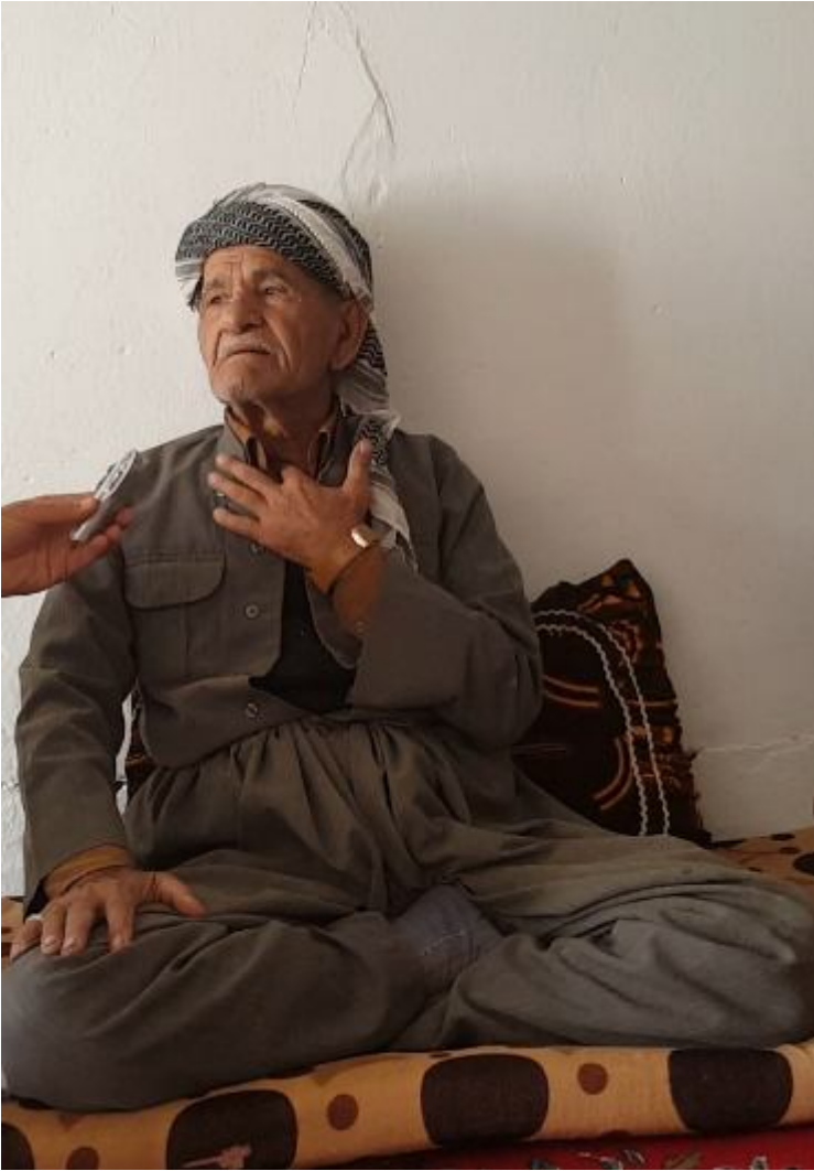
ٲه حمءء سالف رٲٲسٲى؁ له كائى باسكردن له بالٲره