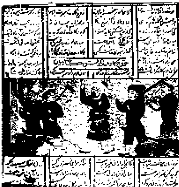
صورة .... خروج كاوة بالعلم "درفش كاريان"

وانه من المنظرين كابليس الى يوم الوقت المعلوم.