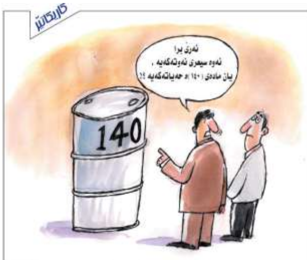
( ٨ )