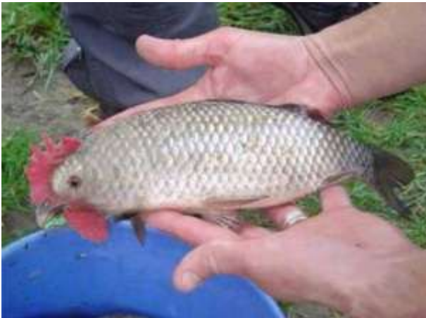
(۲) وینەى ماسییهك سهرى كه له شیرى پیوه لكاوه.