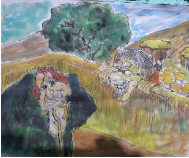
( ٧ )