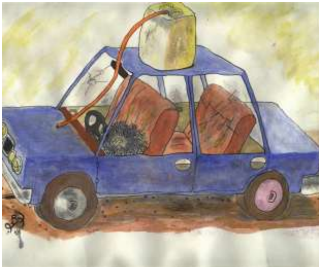
( ۴ )