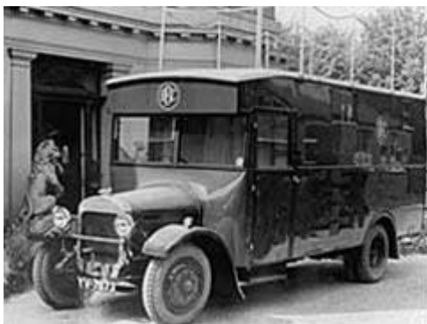
Figure3 : The first BBC outside broadcast van; Source:BBC

به‌ک‌م پیشک‌ه‌شکاری هه‌وال له‌رادیوی BBC