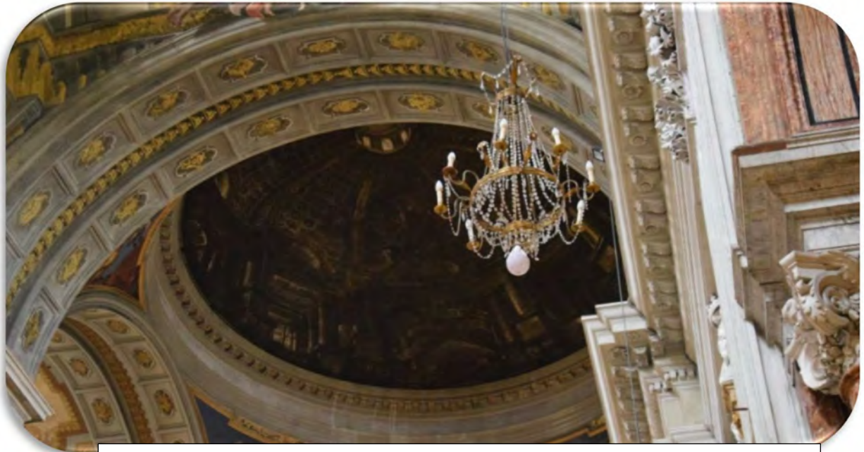
كەلىساي عيسا لە رۆم . پزانندنەوێ ناوێوێ ئەم كەلىسايە بۆ ھەستى خەلكى پاكىشن بۆ دىندارى .

كارىگەرى چاكسازى لە شۆرشى زانستى كەمتر بەرچاوه . ھەم كاتۆلىكەكان و ھەم پروتستانەكانىش لە سەرەتادا پشكىكى باشيان لەمە ھەبوو ، بەلام دواتر بە ھۆى گومانەكانى ئىنكزىسيۆن رىگىرى ھاتە بەر دەم كاتۆلىكەكان ، لەوانە دەكرى ئامازە بكەين بە داداگايى كردنى گاليلە كە بە كوفر تاوانبار كرابوو و لە سالى ١٦٣٢ دادگايى كرا . ( بگەرێوھە بۆ شۆرشى زانستى لەم زنجيرەيە )