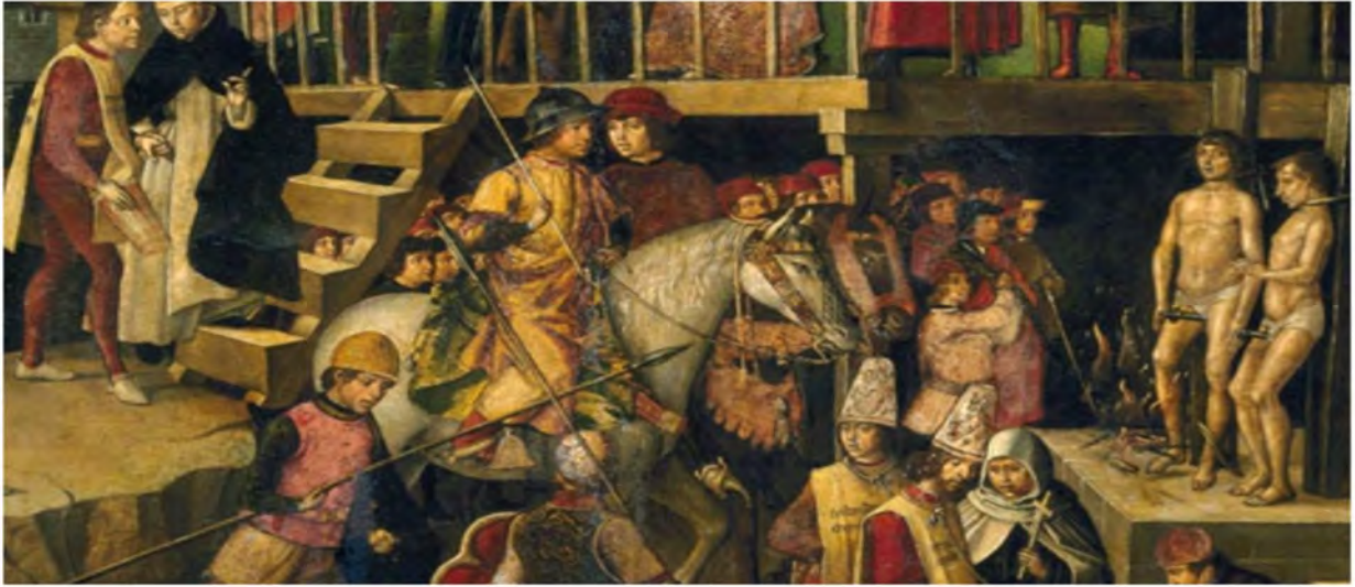
ئینگیزیيۇن . ئەوانەى عەقىدەى كاتۆلىكى رۆمىيان بەسەند نەدەكرد سزا دەدران و ھەندىك جار دەسۆيتىندران .