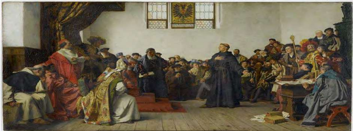
مەجلىسى وورمز. لەم ۋىتەيەدا لۆتەر لە دادگاىە.

لە سالى ۱۵۱۱ لۆتەريان نارد بۇ زانكۆيەى نوى لە (ۋىتتبرگ). ئەۋ بۇ دروست بە جىگەياندىنى ئەم كارە دەبوايە موناۋاى كىتپى پىروۋى كردبايەۋە. لىرەدابوو ئەۋ ۋلامەى دۆزىەۋە كە لىي دەگەرا. لوتەر يەقىنى پەيدا كرد كە تۆبەۋ لىخۆش بوون بۇ ئەۋانەيە كە باۋەرى بەم يا سايەى مە سىحىت ھەبى كە دەلى خوداۋەند بە قورىانى كىردنى كورپەكەى (عيسا مەسىح) مروۋقاىەتى رىزگار كىردوۋە.