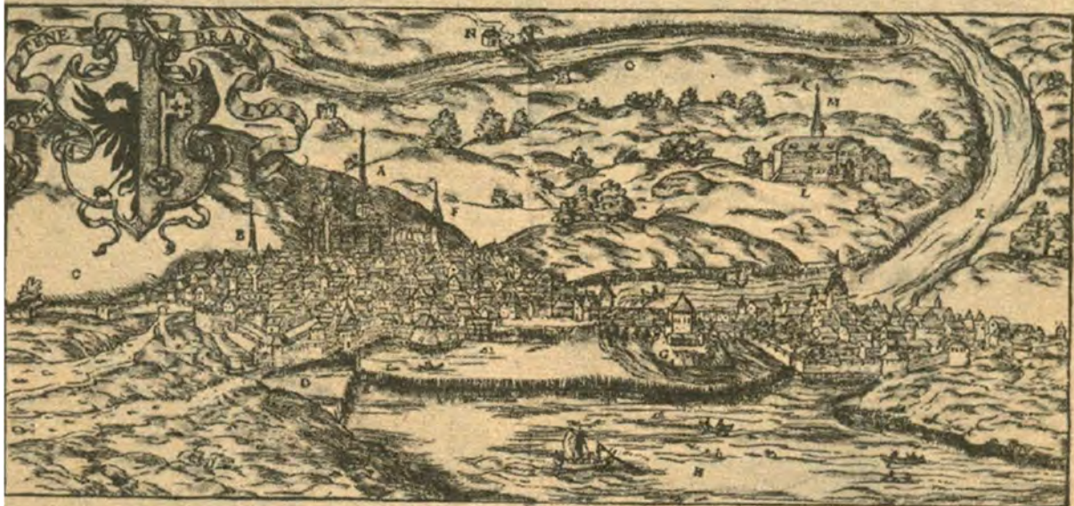
A Le Temple de S. Pierre. B L'hospital. C Le Bouleuer du Pin. D La Porte de Ruf. E L'efchaugette regardant fur le Lac F S. Germain. G L'Isle fituee au milieu du Pont, avec fon Befroy. H Le Lac. I S. Genais. K Le Rhofne. L L'hospital des pefiferez. M Le Cimetiere d'iceluy. N Le Pont d'Aruc. O La Riviere d'Aruc.

شاری ژنیف له سالی ۱۵۵۱. کالۆن ئەم شارەى گۆرى بۆ گرنگرتین ناوهندی پروتستانتیزم له ئەوروپا.