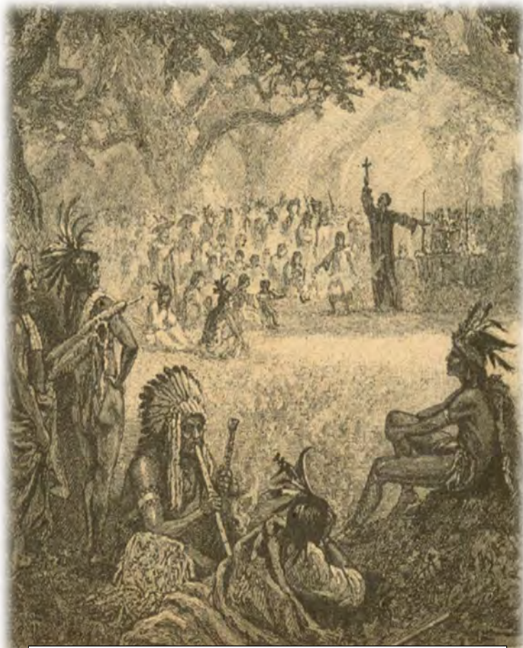
یەسوعیەکان کە بانگەوازی مەسیحیت دەکەن لە ناو سوورپێستەکانی کالیفۆرنیا.

(ناوار)، ئەمەش ئەو پارێزگایە بوو کە فەرانسە خۆی بە خاوەنی دەزانی. لە ساڵی ۱۵۲۱ فەرانسیەکان هێرشیان کرد، و پامیلونایان گەمارۆ دا. گولە تۆپێک بەر ئیگناسیۆس کەوت و چەند شوپێکی پێی شکا.