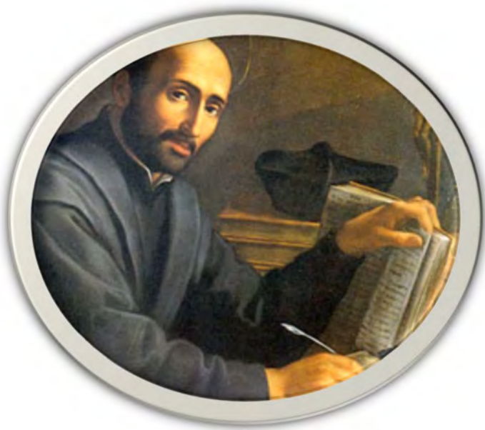
ئینگناسیۆس لوایولا. دامەزرێنەری ئەنجومەنی مەسیحی. بەشیوەی گشتی له ساڵی ۱۵۴۱ تا کاتی مردنی رێپەری ئەو ئەنجومەنە بوو.

له گەل هەموو ئەمانە پڕۆتەستان له هەموو شوێنیک سەرئەگەوت. زۆریک له کاتۆلیکەکان پڕۆتەستانتی کەلیساکانمی خۆیان بوونەوه. یەکیک له گرنگترینی ئەو کاتۆلیکەکانە ناوی (ئینگناسیۆس لوایولا) بوو که له نیوان ساڵانی ۱۹۴۱ تا ۱۵۵۶ ژیاوه.