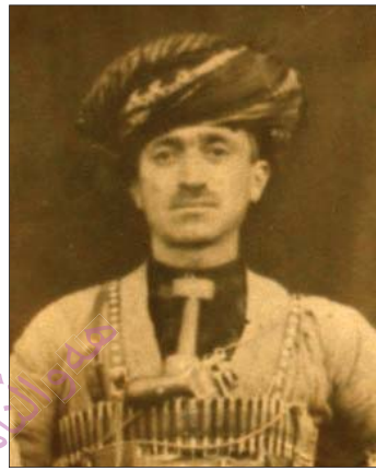
نہ حمہ د موختاربہ گی جاف