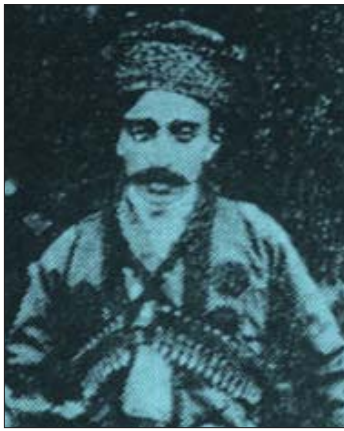
تاهیربہ گی جاف