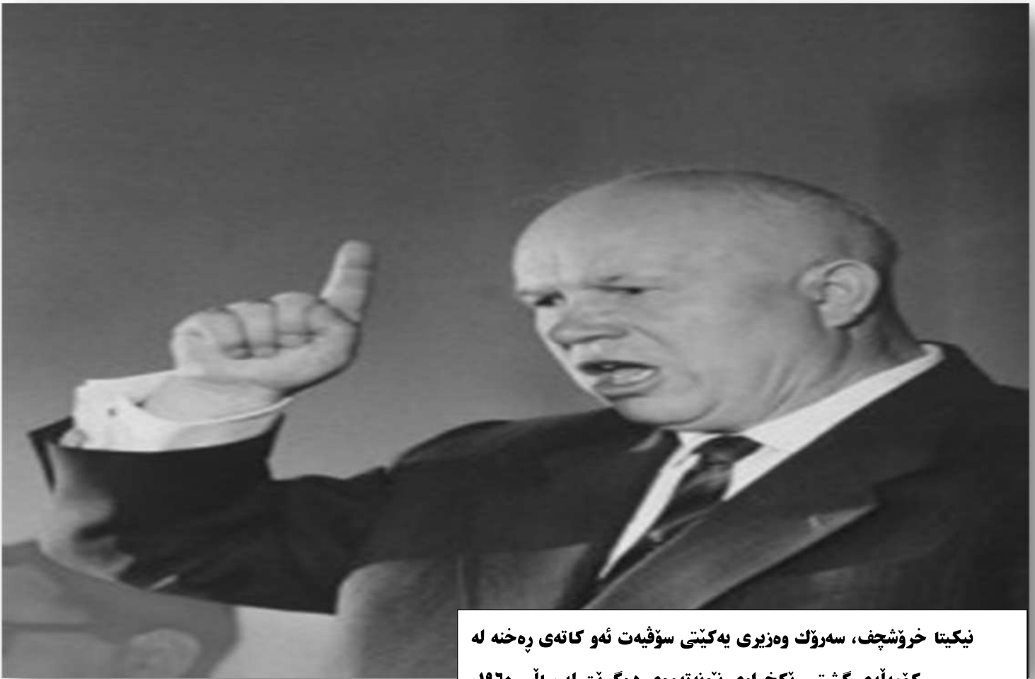
نيکیتا خروشچف، سەرۆك وهزیری یهكیتی سوڤیهت ئهو كاته ی رهخه له كۆمهلهی گشتی رېكخراوی نیونهتهوهی دهگریت له سالی ۱۹۶۰.