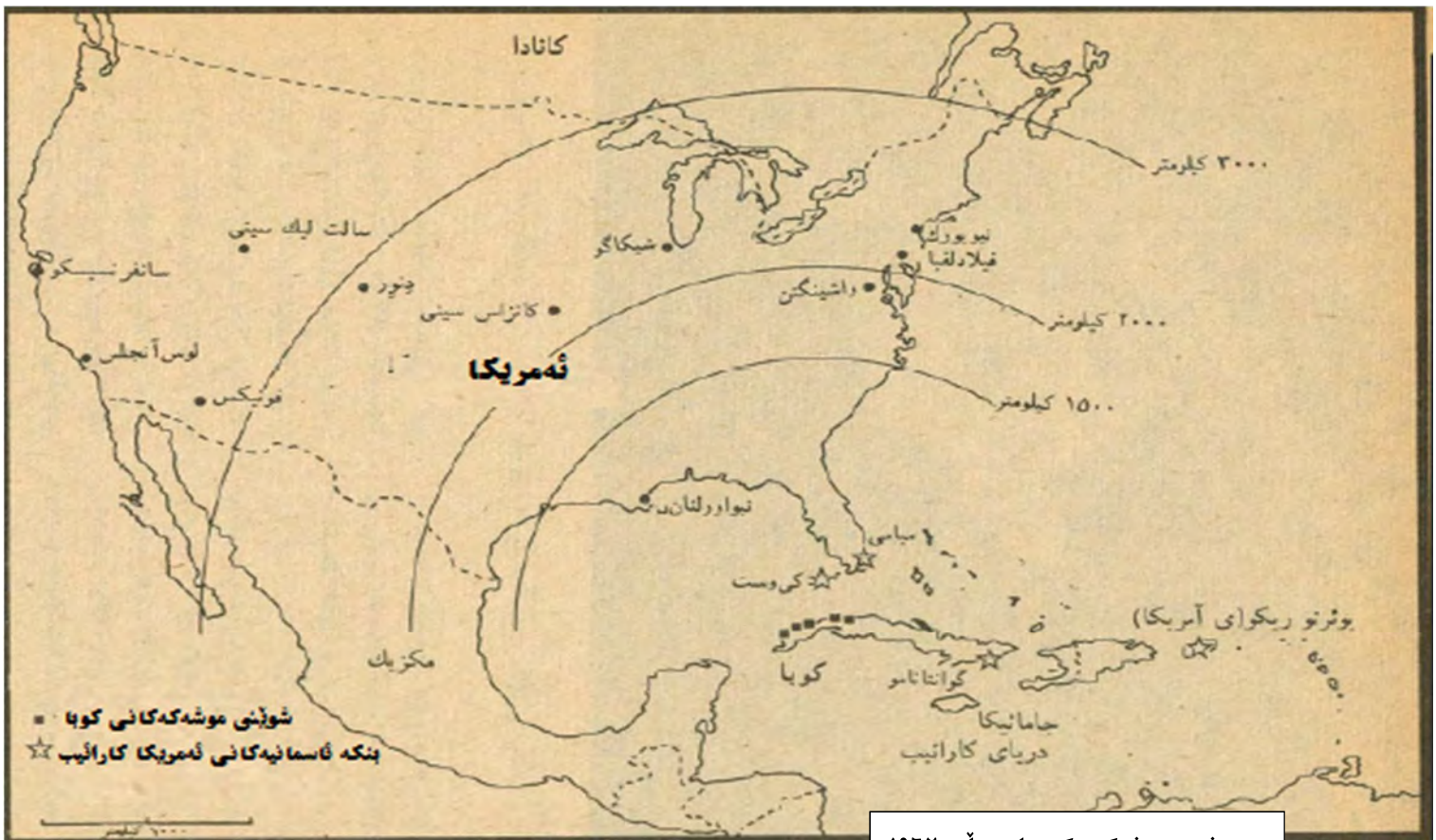
هه‌ره‌شه‌ی موشه‌کی کوبا له ساڵی ۱۹۶۲

هه‌وه‌لین هه‌نگاو بوو بۆ کۆنترۆڵ کردنی چه‌کی ناوه‌کی. (بگه‌ڕێوه بۆکتییی بۆمی ئەتۆمی له‌م زنجیره‌یه‌دا) روسیا ئیتر نه‌یده‌توانی پشت به‌ وه‌فاداری ولاتانی هاو‌به‌یما‌نه کومونیه‌ستگانی به‌ستیت. یوگسلافیا هه‌وه‌لین ولات بوو که له ساڵی ۱۹۴۸ خۆی به‌ دوور گرت له‌ روسیا. رۆمانیا له‌ گه‌ل هه‌بوونی کیشی نیوان روسیا و پۆژئاوا به‌لام ده‌رگای بۆ دانوستان کرده‌وه و ده‌رگای به‌ رووی گه‌شتیاره‌گانی ئه‌و ولاتانه‌دا والا کرد. ئەلبانیاش رووی له‌ روسیا وه‌رگیرا. له‌ چکسلواکیا حکومه‌تی نوێ سانسوریان وه‌لاناو ئازادیه‌کی زیاتریان دا به‌ خه‌لکه‌که‌ی. روسیا ده‌ترسا که چکسلاوکی له‌ په‌یمانی وارسۆ بچینه‌ ده‌ره‌وه. ناچار چاریکی دیکه له ساڵی ۱۹۶۸ له‌ گه‌ل هاو‌به‌یما‌نه‌گانی هێرشی کرده‌ سه‌ر چکسلاوکی و وێرانیان کرد.