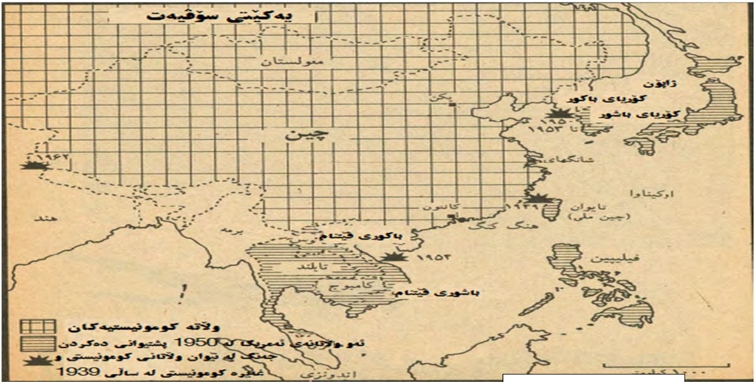
جهنگی سارد له رۆژهه‌لانی ئاسیا

جهنگی جیهانی سێهه سهره‌لبدات و ههروهها خهریک بوو روسیه و بۆمبێ نه‌تۆمیشی تێکه‌وت. به‌لام نه‌و فه‌رمانده له کار دوورخرايهوه و له ساڵی ۱۹۵۱ گفتوگۆی ئاشتیانه ده‌ستی پێکرد. له جهنگی ساردی ئاسیا ئه‌مریکه‌کان توانین چه‌ندین وڵات بکه‌نه دۆستی خۆیان و پارێزگاری له ناوچه‌که بکه‌ن له‌وهی که رۆو له کۆمونیستی بکه‌ن. به‌م رێکخراوه ده‌وتریت په‌یمانی یه‌کیته‌ی باکووری رۆژئاوای ئاسیا یان (سیتۆ). ئه‌مریکه‌کان ده‌گه‌ل وڵاتانی رۆژهه‌لانی ناوه‌راستی هه‌ر له‌م باره‌یه‌وه هاوبه‌یمانیه‌تیان به‌ست. ئه‌مانجی سه‌ره‌کی ئه‌وه بوو که له چوارده‌وره‌ی سنوره‌کانی باکووری روسیا بنکه‌ی سه‌ربازی دروست بکه‌ن و رێگه‌بن له به‌رفراوانبوونی کۆمونیزم بۆ باشوور، هه‌روه‌ها ئه‌مانجیشیان پارێزگاری کردن بوو له زه‌خیره‌ی نه‌فت که وڵاتانی رۆژئاوا پێویستیان پێ بوو.