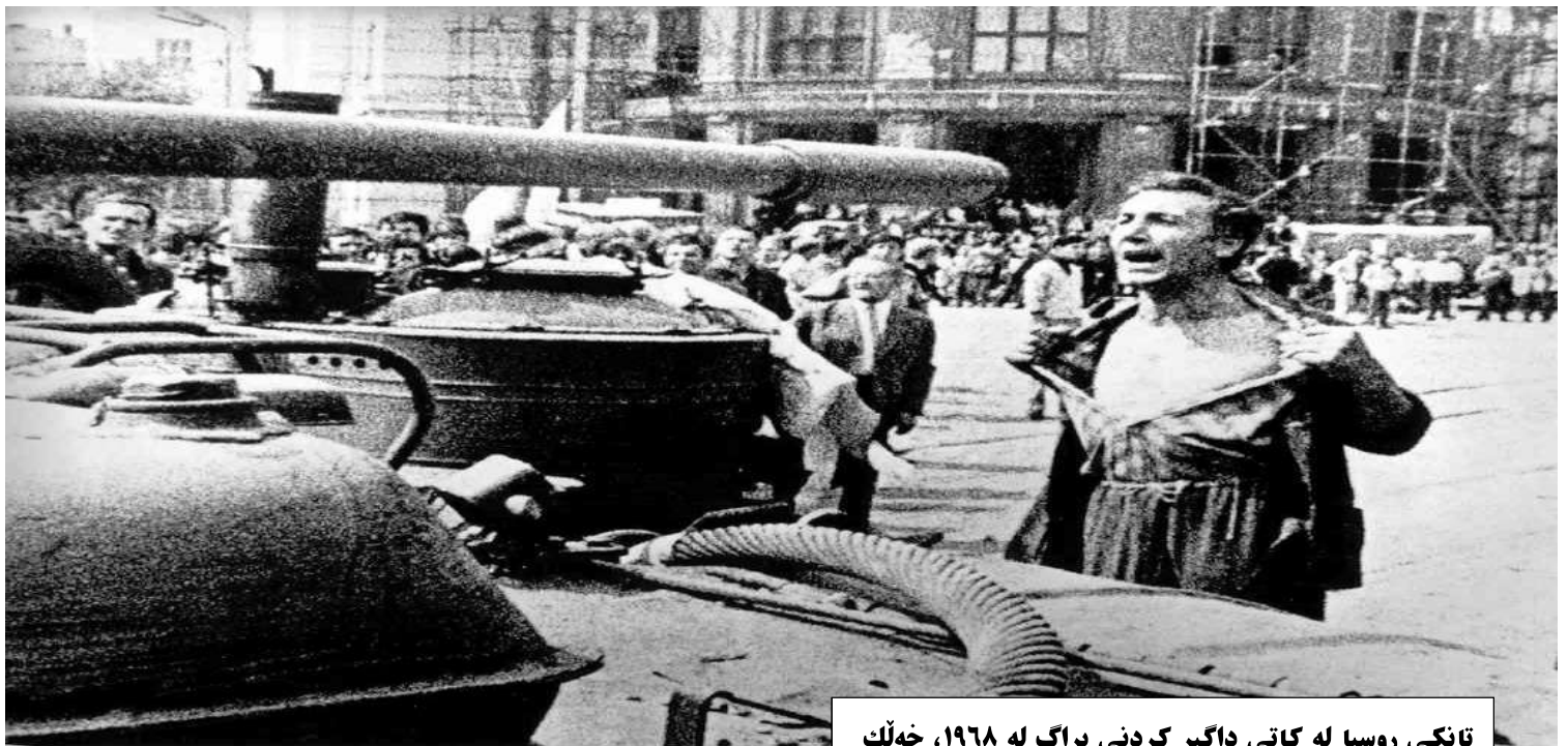
تانکی روسیا له کاتی داگیر کردنی پراگ له ۱۹۶۸، خەلک تورهی خوڤان نیشان ددهن.

کۆمهڵگاکیان ئهوهندهش له یهکتر جیاواز نین ئیدی مهیلی دهستدریژی کردنه سهر یهکتریان نهبوو.