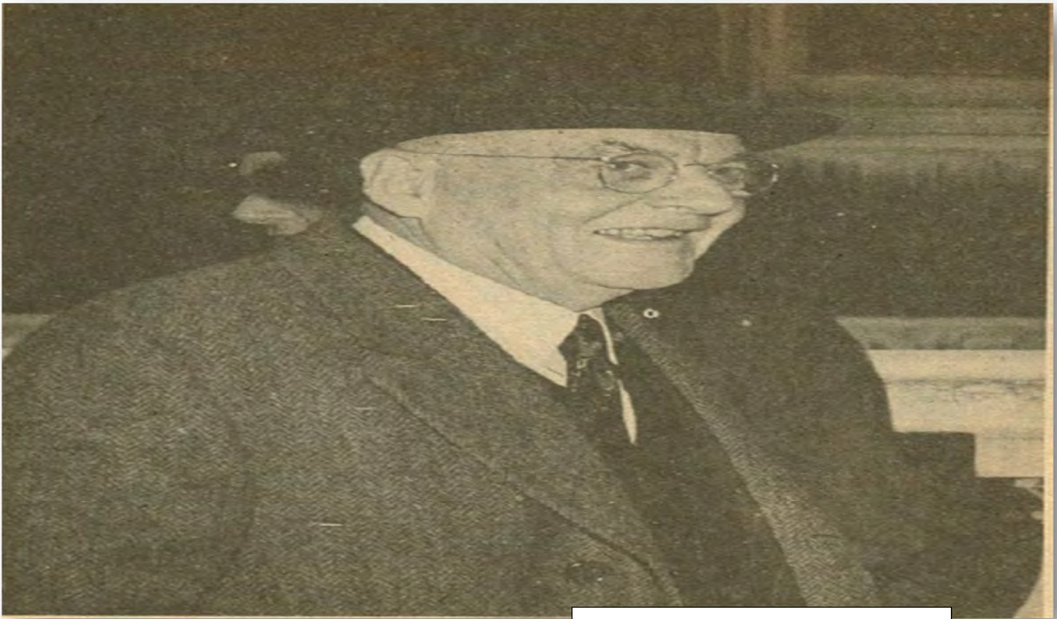
جۆن فۆستر دالس وهزيرى دهرهوهى ئەمريكا ۱۹۵۰