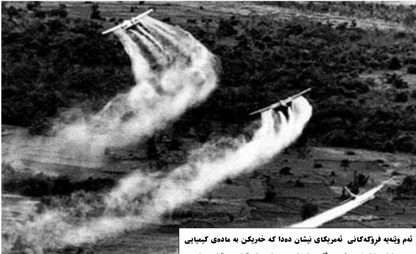
ئەم وېنەيە فرۆكەكانى ئەمريكاي نیشان دەدا كە خەريكن بە مادەي كيميائي داراستانەكانى باشورى قىتنام كە كومنيستەكان لەويدا بوو وئيران دەكات.

زۆرئىك لە ئەوروپەكان لەسەر ئەو باوەر بوون كە ئەورباش ۋەكوو جيهانى سىيەم لە نيوان روسيا و ئەمريكا رەفتار بگات و زياتر رۆلى ئابوورى بگيرى و زۆرئىك لە ولاتانى ئەوروپا لە گەل يەكتر رىكەوتن. لە سەرەتاكانى سالى ۱۹۶۰ فەرانسە برياريدا لە ناتۆ يىتە دەرەۋە و لە جياتى