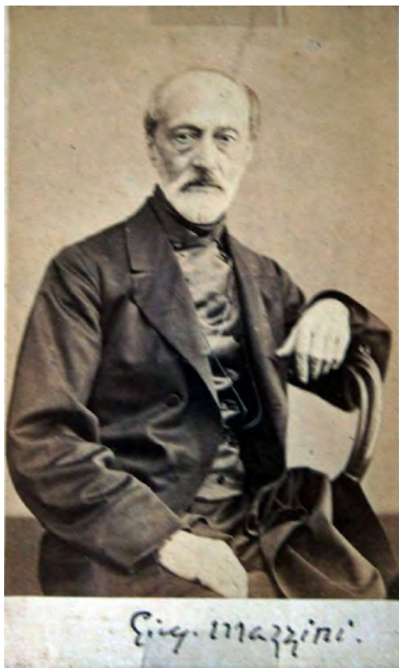
گیوسپه مازینی، نووسەری نەتەوهگەری ئیتالی

کهوتە ژێر کاریگەریهوه. ئەم ڕێگەیه له ناسیۆنالیستی عەرەب، ناسیۆنالیستی تورک و زۆریک له ناسیۆنالیستەکانی ئەوروپاش بەرچاو بوو هەتا بە ئیرلەند و ویلزیشهوه.