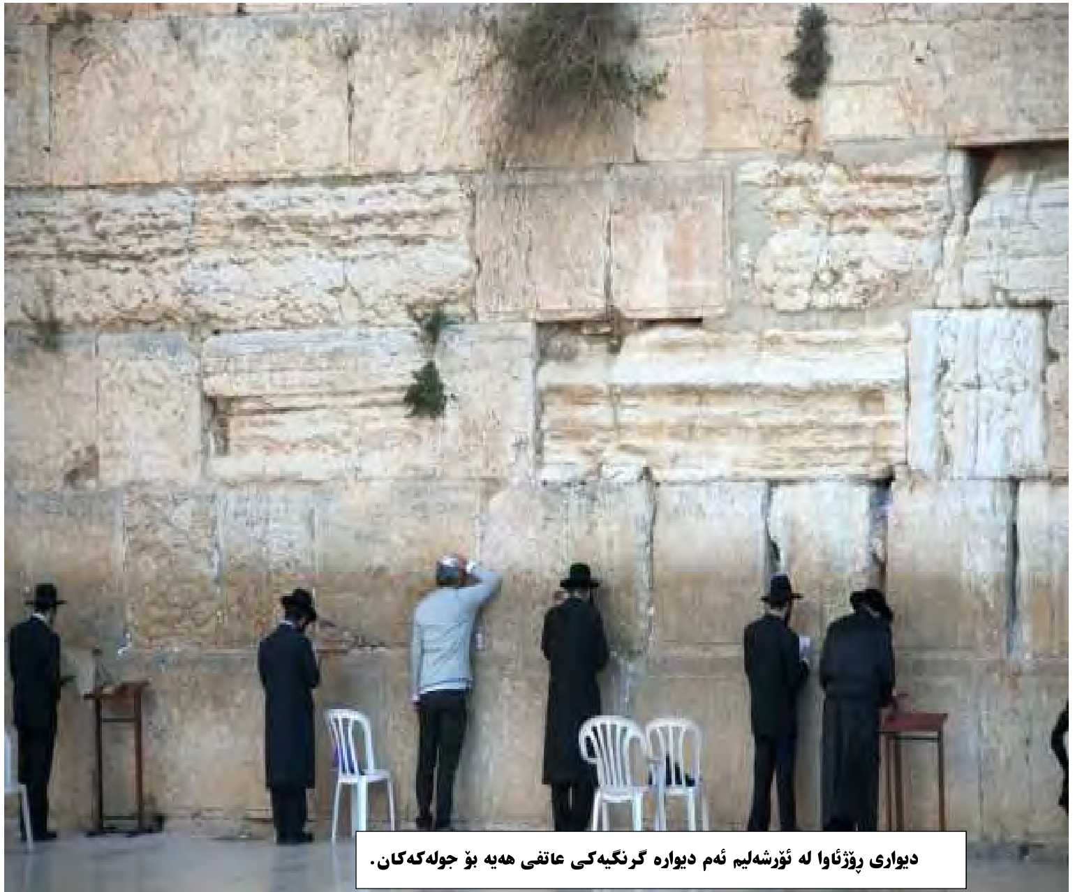
ديوارى رۆژئاوا له ئورشليم ئەم ديواره گرنگيهكى عاتقى ههيه بۆ جولهكهكان.

بهتايهت له بهشكانى ديكه رۆژههلاتى ناوهراست. گهچى ئايىنى جولهكهكان يهوديهت بوو بهلام زايونىست تهنا بزوتنهويهكى ئايىنى نهوو. زۆر يهودى ههبوون زايونىست نهبوون بهلگو تهنا به ئەنجام دانى كرداره ئايىنيهكان قهناعهتيان دهکرد.