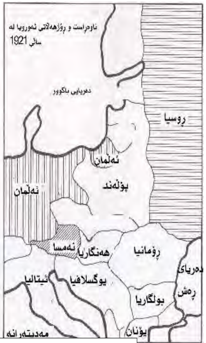
ئەنجامه‌کانی جهنگ و ناسیۆنالیزم له ناوهراسست و رۆژههلاتی ئهوروپا