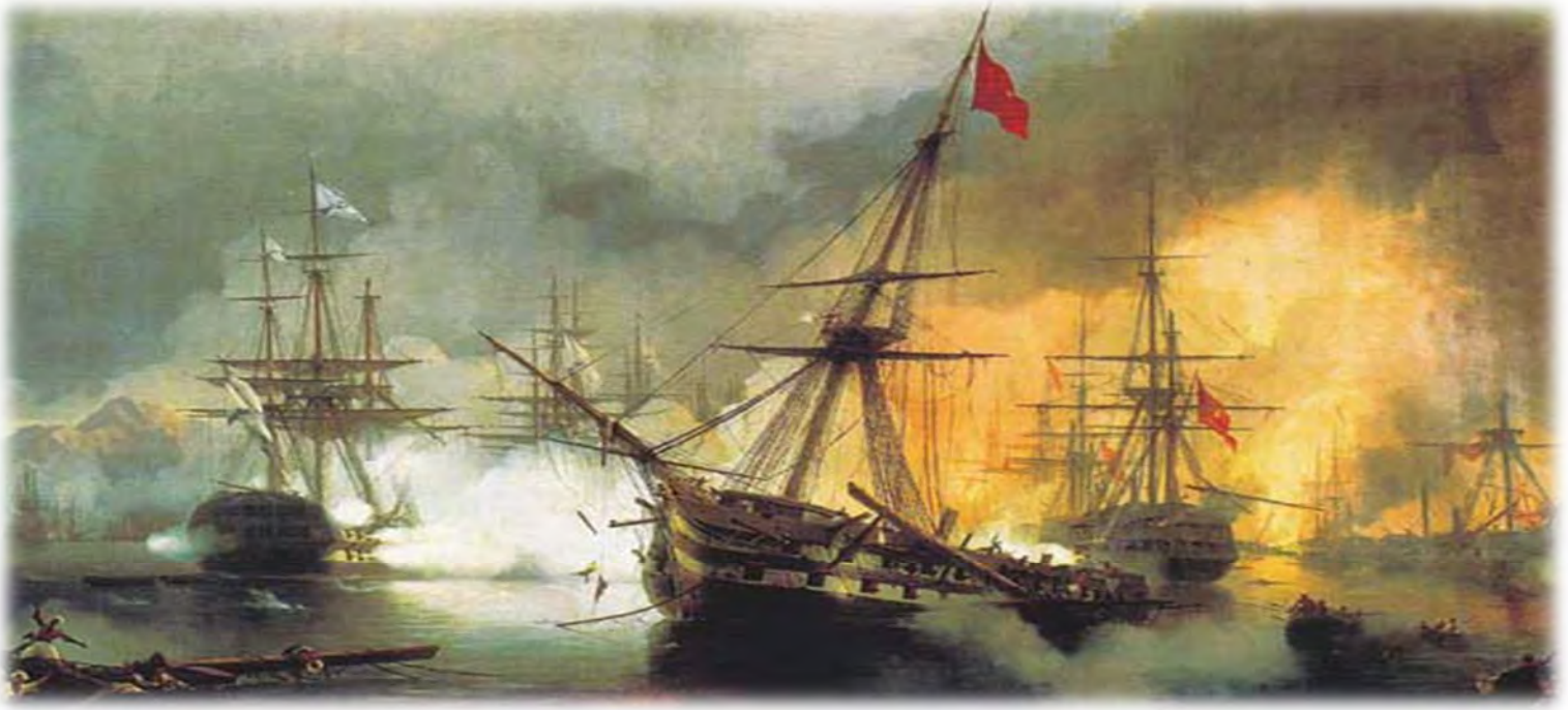
جہنگی نافارینو، ۱۸۲۷ شگستی کہشتیہ جہنگیہ کانی عوسمانی لہ جہنگ لہ لایہن ئہورویہ کانہوہ بو سہربہ خوی یونان .