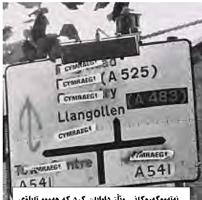
نەتەوهگەرەکانی ویلز داوایان کرد که هەموو تابلۆی ئاراستەکانی ولاتەکیان بە زمانی ویلزی بێت.