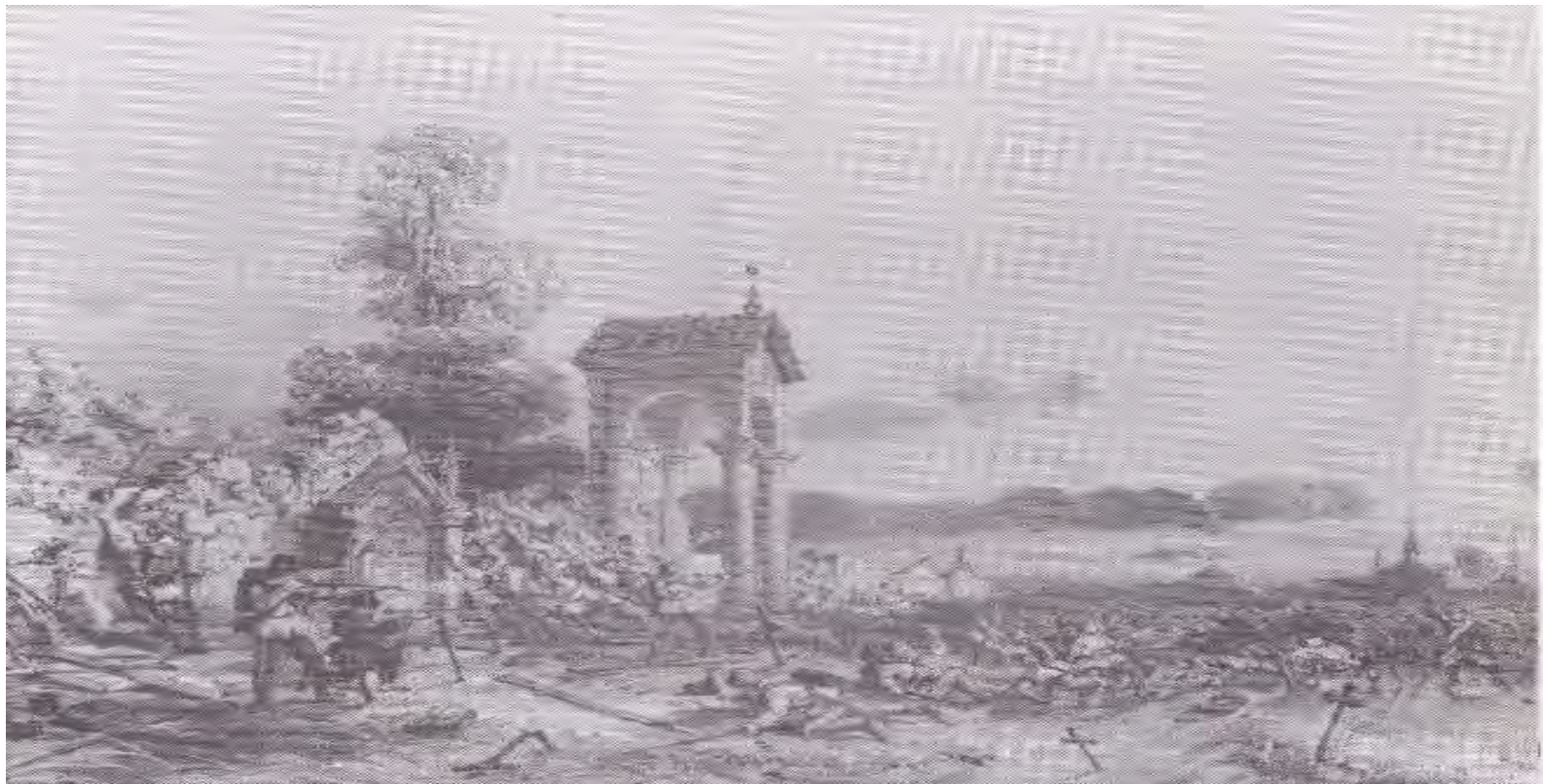
جەنگى ماگېنتا، ۱۸۵۹. شىكسى نەمسا لە لاھن فەرانسە يارمەتيدەر بوو بۇ يەكگرتووى باكورى ئىتاليا .

سەرکەوتن بەدەست دەھىنن و ئەوانى دىكەش خۆيان بە دوور دەگرن يان بە باشترين شېوہ سوودى لى وہردەگرن .