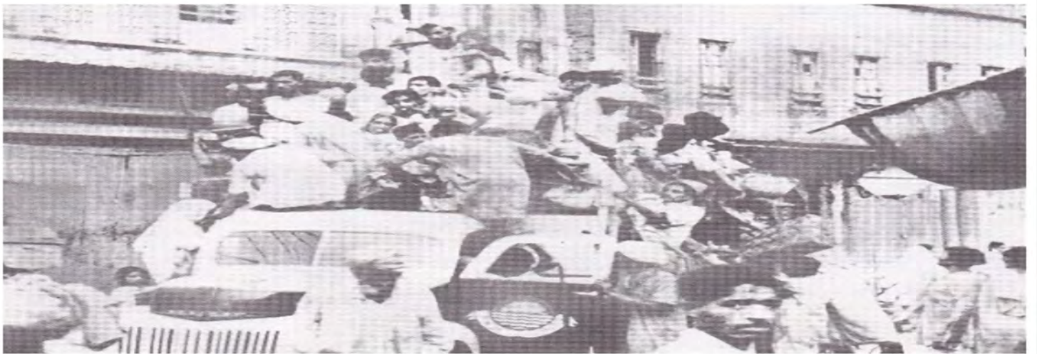
موسلمانہ کان ہیندستان جی دہیلن و دہرؤن بو پاکستان ۱۹۴۷