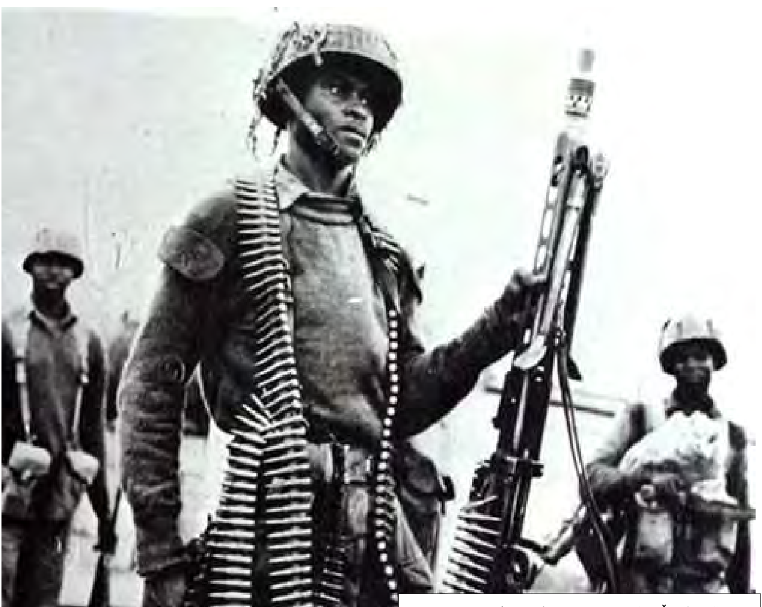
سەربازێکی فیدرالی نیجیریا لە کاتی جەنگی ناوڤۆ ١٩٦٧. دروستکردنی نەتەوە لە سوپای بەھێزی ئەفریقا.

تایبەت بە ڤۆیان. بیروکەیی دروستکردنی حکومەت و نەتەوە تەقربەن ھەر یەکن. زۆرجار ئەو حکومەتانەیی دەیانھەوێ نەتەوە دروست بکەن دوچاری کێشە دەبنەو، دوای ئەوێ کە سەربەڤۆیان وەرگرت ئەوجار لە ناو ڤۆیان کێشە دروست دەبێت، دوو لە حکومەتە ھەر گەورەکانی ئەفریقا، کۆنگۆ و نیجیریا دا بەش بوون بۆ حکومەتی بچوکتر، چونکە ئەو خەڵکەیی کە پێشتر پێکەو ھاوسەنگەر بوون دژ بە داگیرکاری بەریتانیا و بەلجیکا بیران لەو نەدەکردەو کە ئەوان