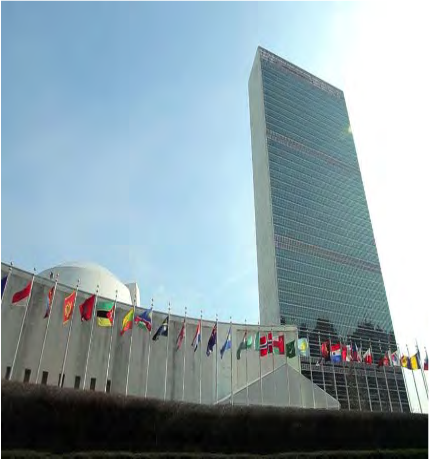
بینای نەتەوە یەگرتوێکان لە نیویۆرک