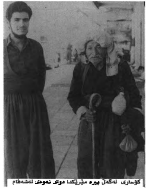
کۆساری لهگهڵ بیره مېرێکدا دوای نهموتی لهشهقام بهري نهموويتموه نهم ویتهميشی لهگهڵدا گرتووه/راتيه