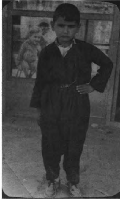
کۆساری ( ۱۹۷۳ ) رانیه