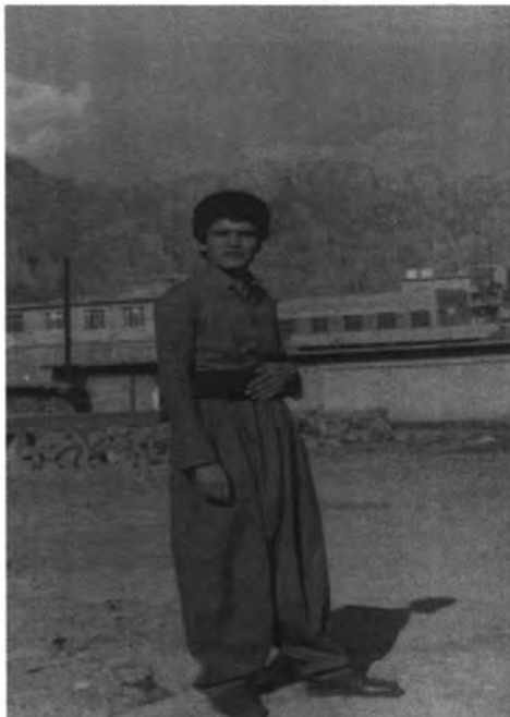
کۆساری (۱۹۸۵/۵/۲) راتيه