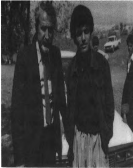
کۆساری لهگهڵ (تهها بابان دا)