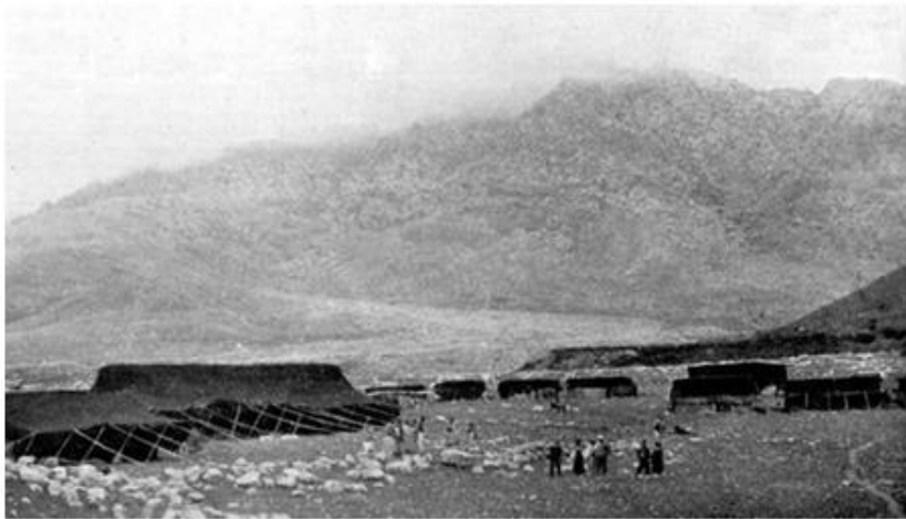
ره شماله کانی کورده جافه کان له شاره زوور

ژماره ی تیره که داده نرییت به سه د هزار کهس و مه حمود پاشا که ئیستا سه روک خیله بانگه شه ی ئه وه دهکات که له توانایدایه له ماوه ی چند سه عاتیکی که مدا نزیکه ی چوار هزار سواره له گوړه پانه گه دا ئاماده بکات