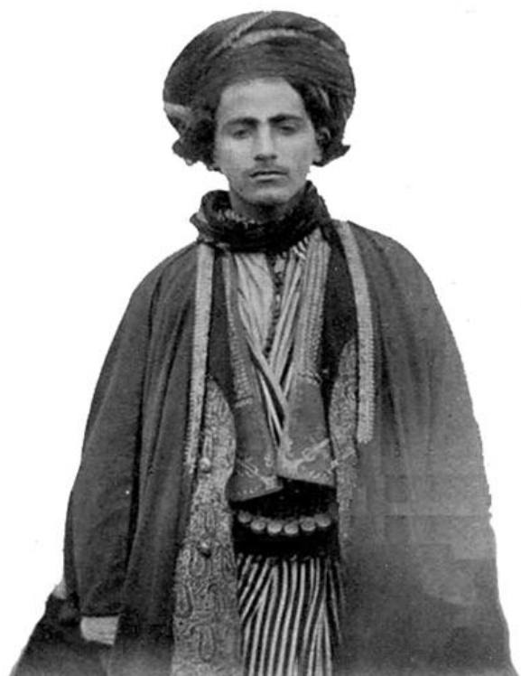
وینہی سہرؤکیکی جاف، باشووری کوردستان.