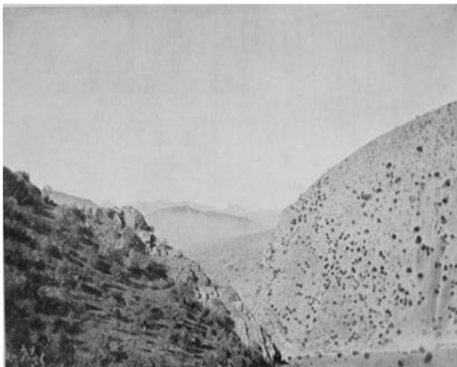
له سه ر سنوورى ولاى ئيران، باشوورى كوردستان

هه شت پايه ي پياوانى ئايينى هه يه: پاتريارك، سه رۆك قه شه، ياريده ده رى سه ره ك قه شه، رابه رى كه نيسه، قه شه، شه ماس، ياريده ده رى شه ماس و خوينه ره وه. وه ك بينيمان نوسينگه ي باوك سالارى به وراسيه و هه ندى سيستمى ريكخستنى شيوهى خوارده مه نى بۆ دايك پيش مندا ل بوون پابه نده، هه روه ها په رپه وى سيستمى تايبه تى ده كريت له ماوه ي ژياناندا، كاتى هه موو جوړه گوشتىك قه ده غه يه. رۆژوگرتن و جه ژنه كان زۆر زۆره، هه موو كلدانه كان- كاسۆليكه كانى رۆمان، ئه رسه دۆكسه كان، يان ئه وانى تر- زۆر سوورن له سه ر ريزگرتنى ئه و رۆژانه له هه موو به شه جياوازه كاندان له گه ل ئه وه شدا له رۆژانى شه ممه دا زۆر وابه سته ي كارنه كردن.