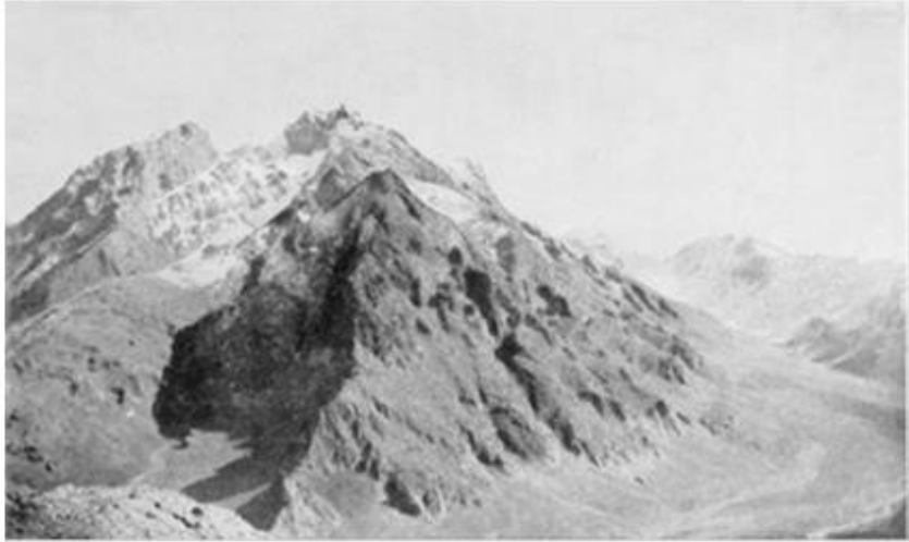
سنووری شاخه کانی کورد

له و بپروایه دام بۆ یهك دوو سعات یان ئه وهنده زیاتر نووستبین، کاتی سهرما بیداریکردینه وه. من دهلهرزیم و سهرما چووبووه گیانمه وه. کزه ی بهیانی بهرزبۆوه و له سهر و گرده کانه وه تهقییه وه و پله ی گهرمای نزمکرده وه به زۆر پله له چهند چرکه یهکی کهمدا. کازیوه درۆزنه ههر ئیستا له رۆژه لاته وه دهرکهوت و له گه ل گۆینه دان به ساده یی ئه و ناوه دا له سهر زهوی دانیشترین و دهستانکرد به جگهره کیشان به هیوای ئه وه ی گهرمانیته وه. له دووره وه، له لاکه ی تری دهشته که ی خوار بازیا نه وه، دهمانتوانی گری ناگری پوش ببینن که هیشتا بلایسه ی دههات و ئاهیکی هه لکیشا بۆ که می له گهرمی که ی. بیدهنگی بهیانی زوو ته نیا به خشه ی با به ناو پوشه وشکه که دا و دهنگی ناوبه ناوی ته قه ی تفهنگی کورده به ناگاگان له ناو گونده کانیانه وه ده بوژیته وه. له گه ل یه که م تیشکدا دهستانکرد به بارکردنه وه ی و لاخه کانمان و عهره به که ی که به رپرس بوو له هه موو کیشه یه که هه ولیدا بجیت بۆ به شی سهره وه ی ئه و گرده ی که کزه ی بهیانی له وی به هیزه و به دزییه وه سهیری گونده که بکات له سهر و لای زنجیره که دا، که سهرکهوت له ماوه یه کی زۆر دووره وه سهرکهوتنی به دهستانه ی. له بهرئه وه به داوینی گرده کاندای ده پۆشتین تا دوا ی سهعاتیک گه یشتینه شوینه که، که له بهیانیه کی گه شاوه ی ساردا زۆر له جوان ده چوو، چونکه په له یه که داری هه نجیر و دارچناری گه وره له گه ل چهند جۆگه ئاوێک و ژماره یه که په له ی سهوز و گژوگیا که شوینیکی باشه بۆ مانه وه.