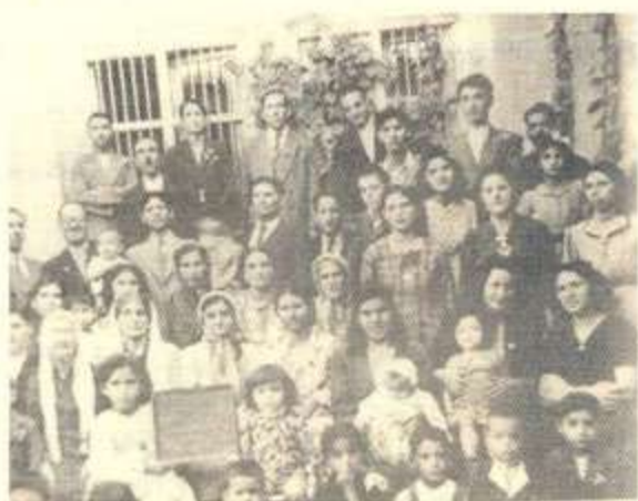
وینہی ٹاوارہ بہ ہائیہ کانی نیشته جینی شاری سلیمانہ لہ سالی ۱۹۴۳*