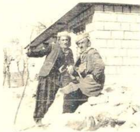
حه میدی مامه‌ره‌زا و ته‌های مامه‌ره‌زا*

هر له‌باره‌ی په‌یوه‌ندی مامه‌ره‌زاییه‌کان به حزبی شیوعییه‌وه، له‌چوارچیویه‌ی باسی‌کوده‌تای ره‌شی شوبیاتی ۱۹۶۲دا، (که‌ریم نه‌حمده) بیره‌وه‌رییه‌کانی خوی به‌نهم شیویه‌یه‌له‌گه‌ل مامه‌ره‌زادا ده‌گنیریتته‌وه ((پاش نه‌وه‌ی مامه‌ره‌زا له‌ریگه‌ی گه‌وره‌شاعیری کورد "عبدالللا گوران" سه‌وه' حزبی شیوعی ناسی، به