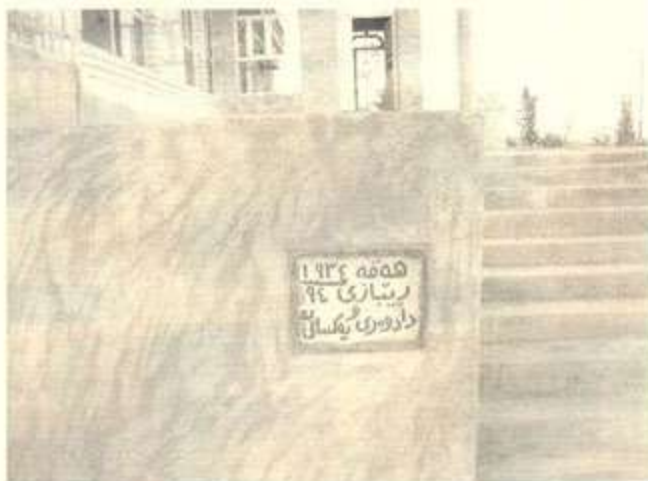
خانه قاي که لکه سماق

به شتووه يه کي گشتي ده توانين بيري کومه لي هه قه بۆ دوو قوناغ دابه ش بکەين که نه وانيش قوناغي سه رکردايه تي نه م بیره يه له سه رده مي شيخ عه بدولکه ريمي شه ده له دا و دووه ميس قوناغي دواي کوچي دوايي شيخه که ده کريت به قوناغي ريفورمي بيري کومه لي هه قه کاني ناوهرين، چونکه پاش کوچي دوايي شيخ، هه ر يه که له مامه رهزا و هه مه سووري کلاوقوت، ناراسته ي بيري هه قه يان ناوئته ي هه لومه رجي نوئي کومه لايه تبي و ئابوربي و سياسي نوئ کرد و دوو رپچکه ي جياوازيان له ريباز و بيري هه قه دا پهيدا کرد، که هه ر يه که يان خاوه ني چه ند تاييه تمه ندييه کن و بۆ له چوارچيوه گرتنی نه م تاييه تمه ندييانه و دابه شکردنيان به سه ر هه ريه که له نه م که سايه تيبانه دا، پوخته ي بهرنامه کانين له دوو قوناغدا ده خه ينه روو: