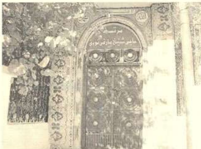
مەرقەدی حاجی شیخ ماری ئۆدی لە گردی سەیان لە سلێمانی

((به ئەم نیازە، لە سەرگەلوووەوە بۆ سلێمانی دێت. مەولانایش لە بۆژی جومعهدا و لە پاش نوێژی جومعه که لە مزگەوتی گەورە دێتە دەرەوە، تەوہججوهێکی لێدەکات، ئەویش جەزبە دەگیریت و لە لای دەست بە سولووککردن دەکات، تا بە پایەیی خەلیفەیی دەگات و نیجازەیی نیرشاد وەر دەگیریت.)) ۱