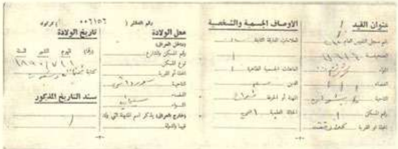
پووی ناوه وهی ناسنامه ی باری شارستانی (جهمه سووری کلوقوت)