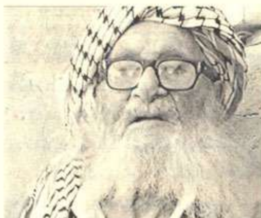
حه‌مه‌سووری کللو قوت له دوا مانگه‌کانی ته‌مه‌نیدا*

هه‌ر له ناو هه‌مه‌سووریه‌کاندا دوو دیارده‌ی تری سه‌یر هه‌بووه، نه‌وانیش نه‌خواردنه‌وه‌ی چا و نه‌کیشانی جگه‌ره‌یه. سه‌باره‌ت به‌چا نه‌خواردنه‌وه (د. عیزه‌دین مسته‌فا په‌سول) پیتی وایه‌ نه‌مه‌ دیارده‌یه‌کی باوی نه‌و سه‌رده‌مانه‌ بووه و له ژێر کاریگه‌ری باری ناله‌باری ئابووری نه‌و کاتانه‌دا بپیری له‌ سه‌ر دراوه، چونکه‌ به‌ باوه‌پی نه‌م ((نه‌م دیارده‌یه‌ هه‌ر لای هه‌مه‌سووریه‌کان باو نه‌بووه، به‌لکو له‌ سه‌رده‌می جه‌نگی دووه‌می جیهانی‌دا، شه‌کر و چا زۆر گران و زۆر ده‌گمه‌ن بووه، زۆر که‌س چایان به‌ خورما خواردووه‌ته‌وه. زۆر مال و که‌سیش به‌ نه‌و پیتی‌ی که‌ چا پتیوستی ژیان نییه‌، بپیری نه‌وه‌یان داوه‌ که‌ نه‌یخۆنه‌وه،