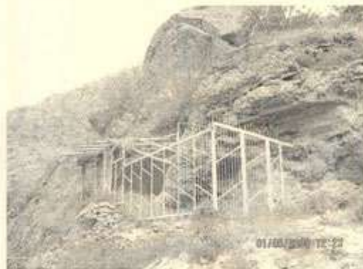
نه و نهشکهوتهی که (به هانوللا- میرزا حسنین علی) له سررگه لو خویی تیدا شار دووه ته وه

بیت، له سالی ((۱۸۵۴د دهگاته سلیمانی و له شاخهکانی سررگه لو و له نهشکهوتهکاندا جیگیر ده بیت و ژیانکی ساده به سرده بات و به دستیک جلی ده رویشانه و که شکولیکه وه و دور له ناوه دانی و به تهنه ژیان به سر ده بات و به ناوی ده رویش محهمه دوه خوی دهناسینت)) ههروه ک خویشی له (قرن بدیع) دا نه م تهنایی و ژیانهی خوی باس کردوه. ۱