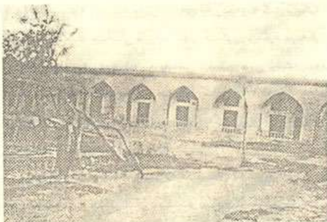
مزگوتی خانہ قای مہولانا خالیدی نہ قشبه ندیی له سلیمانی*