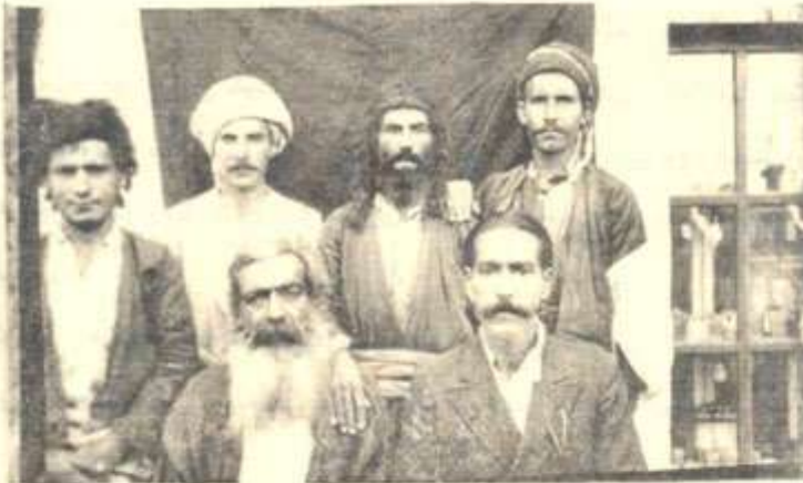
كۆمەلنىڭ لە كاكا بېيەكانى دەقەرى گەرميان

لە دواى كۆچى دوايى "شىيخ عيسى" نىتر كۆرە گەورە كەي "عەبدولكەرىم" دەست بە ئىرشاندكردن دەكات و بەچەند بىنچە و نەو بىەك لە ئەمەو، دەگاتە سەر سەيد بابا رەسولى گەورە، ئەويش بە ئەم شىئو بىە ((شىيخ بابا رەسولى گەورە، كۆرى سەيد عەبدى دوو مە. عەبدولرەسول كۆرى سەيد عەبدە و سەيد عەبد كۆرى قەلەندەرە. قەلەندەر كۆرى سەيد عەبدە و سەيد عەبد كۆرى عيسى ئەلئەحدەبە. عيسى ئەلئەحدەب كۆرى حسينە و حسين كۆرى بايەزىدە و بايەزىدەش كۆرى عەبدولكەرىم)) ۱ ھەرچى سەيد بابا رەسولى گەورە (۱۵۵۸-۱۶۴۶) يىش ھەبە و ھا دەگىرئەو و كە حەقدە كۆرى ھەبوو ((كە زۆرتىن ساداتى