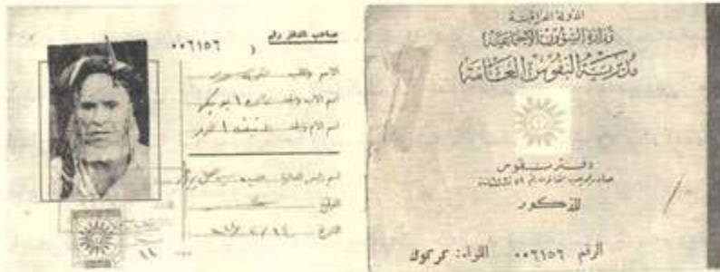
پووی دهره وهی ناسنامه ی باری شارستانی (جهمه سووری کلوقوت)