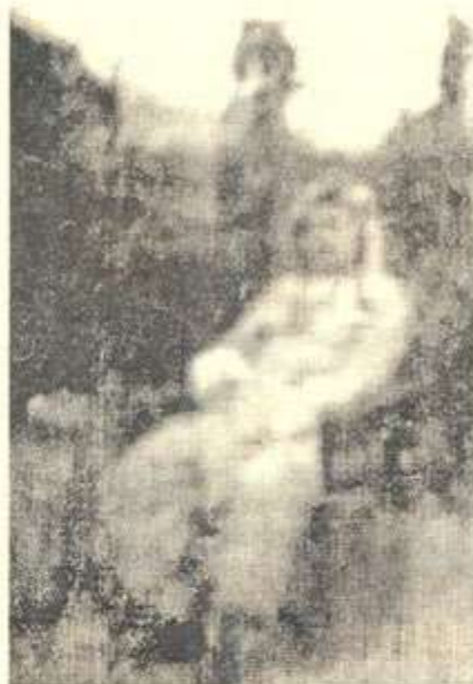
مامهزه زاله سالی ۱۹۵۳ دا *

جار ژنی هیناوه و چوار ۱ کوری به ناوه کانی: شیخ مستهفا، شیخ حمید و شیخ محهمهد و شیخ تهها ۲ وه، هه بیووه.