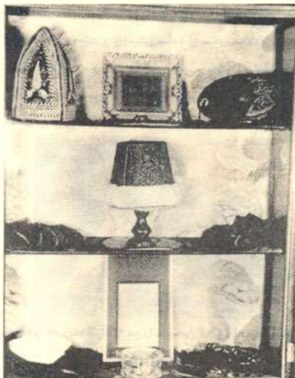
وینەى ئەو كەلوپەلانەى كە بەهائوللا لە سلێمانى بەكارى هێناون*

بەهائوللا بەهۆى پشتگیری لە باب، زیندانی دەکریت و دواتر بەبیراری شای ئێران پەوانەى ئیراق دەکریت و لەسالى ((١٨٥٣ کە تەمەنى ٣٧ سال دەبیت، دەگاتە شاری بەغداد کە لە ئەو کاتانەدا لەژێر دەسەلاتداریتی عوسمانییهکاندايه)) ١ و لە ئەو شارەدا دادەنیشیت. پاش ماوهیهک و بەهەر هۆیهک