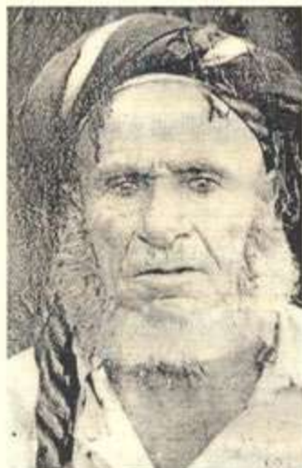
حه مه سووری کلاوقوت*

مامۆستا (ره شهید محهمهد) ۱ ده لیت ((سالی ۱۹۷۴ بقو یه که مجار که حه مه سوورم بینی، له شولاریکی دامه زراوی هه بوو، له نه و کاتانه دا، ته مه نی حه فتاو پینج سالتیک ده بوو. خه لکی ده یان وت: روسی یان فره نسبییه، نه مه ش له نه و گۆشه نیگایه وه دروست بووه، که حه مه سوور چاوی سهوز بووه و په نگی پیستی سوور و سپی بووه، به لام نه م بۆچوونه رتی تیناچیت؟ چونکه من هه ر له خه لکی گوندی کلاوقوت خویانم بیستووه که خه لکی ده وروپشتی ماوه ته و یه ک دوو جار، له لای ماوه ته وه هاتوونه ته لایی و وتویانه: ئامۆزای حه مه سوورین.)) ۲