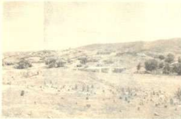
گوندی کلاوقوت - ناحیہ ی شوان - کہ رکوک

لہ سہر بنہ چہ و بنہ مالہ ی حہمہ سوور، چہ ند بیروبو چونیکی جیاواز ہہ یہ۔ (عارف تہ یفور) دہ نووسیت ((حہمہ سووری کلاوقوت، کہ سیکہ نہ ناسراو بووہ، کہ بو شہدہ لہ ہاتووہ، نہ خویندہ وار بووہ، بہ لام کہ سیکہ قسہ زان و زمان پاراو بووہ و شارہ زایی تہ واوی لہ ہوارہ کانی ژیاندا ہہ بووہ))