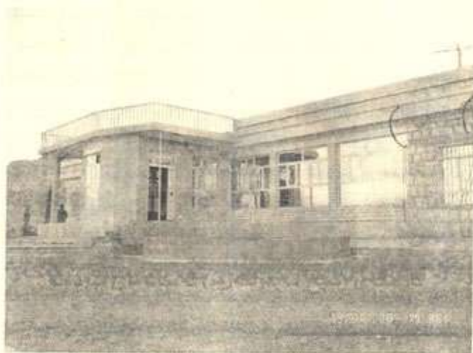
خانه‌قای نویی که‌لکه‌سماق