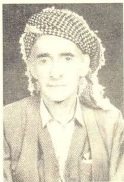
کاکه حمه‌ی کوی مامه‌ره‌زا