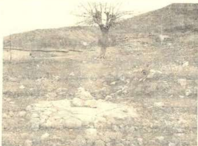
شویته‌واری خانه‌قای کونی که‌لکه‌سماق