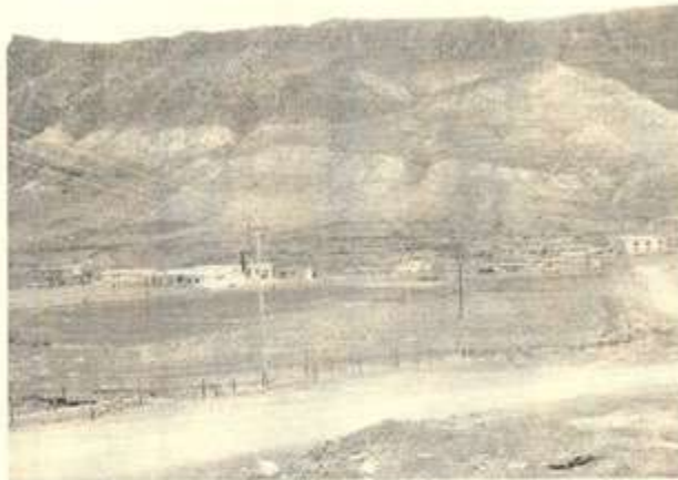
گوندی شه ده له - ناوچه ی سوورداش - سلیمان

به هۆی نه وهی که شیخ عه بدولکه ریم، له گوندی شه ده له ۱ له دایک بووه، به حاجی شیخ عه بدولکه ریمی شه ده له ناسراوه. ((کوری حاجی شیخ مسته فای کوری شیخ ره زای عه سکه ره و ده چنه وه سه ر شیخ نه حمه دی سه ردار، یا خود