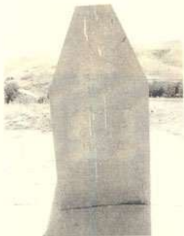
نارامگهی (حەمەسوور) لە گوندی کلایقوت