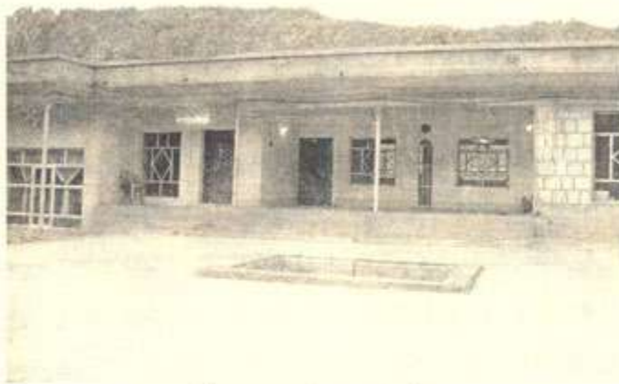
خانه قا نوئییه که ی شه ده له

شیخ به پروداویکی سه رسوپهینه ر و نادیار کۆچی دواپی ده کات ((کاتیک شیخ شه ویکیان، پاش نوژی خه و تنان، له مزگه و ته وه بق مال وه ده گه ریته وه، له دالانی ده رگای حه وشسی مالدا، به ردیکی تیده گرن و به ر قاچی ده که ویت، ئیسی ده شکینی و هر به وه پاش چل شه، کۆچی دواپی ده کات))، به لام پرسیار له ئیره دا نه وه به که ئایا ده بیته نه و به رده، له لایه ن چ که سیکه وه فری درابیت؟ تاچه ند له ده سستی له پشته وه نه بووه؟ به ردیک نه وه نده به کاره که به ر قاچ بکه ویت و دواپی چل رۆژ نه و که سه بکوژیته؟! نه مانه کۆمه لیک پرسیارن و تا ئیستا وه لامیان به نادیارپی ماوه ته وه؟!