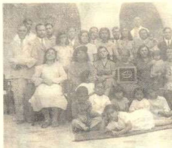
وینہی ناوارہ به هائییه کانی نیشته جیی شاری که رکوک له سالی ۱۹۴۳*