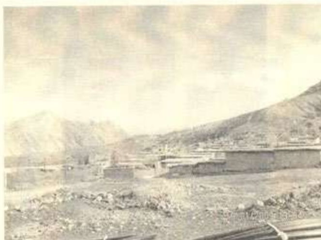
گوندى كه لکه سماق - ناوچه‌ی سوورداش - سلیمانی

مامه‌ره‌زا، برای شیخ عبدالکهریمی شه‌ده‌له‌یه ((سالی ۱۹۰۵ له شه‌ده‌له له دایک بووه. دایکی ناوی نامینه‌خانه و کچی شیخ عبدالسه‌مه‌دی قازیه. پیاویکی گه‌نم په‌نگ، سه‌نگین، له‌سه‌رخۆ، قسه‌خۆش و پووناکبیر بووه. جگه له زمانی کوردی، عه‌ره‌بیلی و فارسیشی زانیوه. شاره‌زای میژووی گه‌له‌کایی و شه‌ده‌بیاتی کوردیی و فارسی بووه. په‌یوه‌ندییه‌کی به‌هیزی له‌گه‌ل که سایه‌تییه ناسراوه‌کانی سه‌رده‌می خۆیدا هه‌بووه و گفتوگۆی له‌گه‌ل زۆربه‌یاندا کردووه.)) ۱ له ژیا‌نیدا یه‌ک