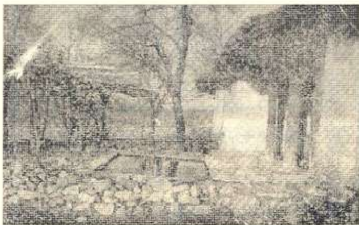
* خانەقا کۆنه که ی شه ده له

له مه و بهر فیکری حکومه تی به خۆیه وه خه ریک کرد بوو.)) ۱ ، به لام له ((مانگی ئابی سالی ۱۹۳۶ دا ئەم ئابینه "هه قه" له خروۆش کهوت.)) ۲ بوونی ئەم بۆشاییه، رینگه خۆشکه ر بوو بۆ ده رکه وتنی چەند که سێکی یاخی له ناو ریبازه که دا، که پێچه وانە ی هەندێ رێوشوینی باوه رپیکراوی شیخ ده جولانه وه، بۆیه شیخ له گه ل "حه مه سور" ی رابه ری ئەم رێچکه یاخییه دا، که وته کێشه وه.