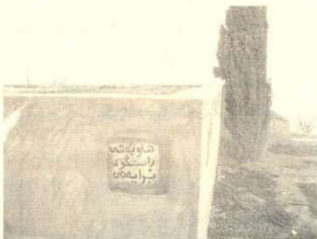
خانه قای که لکه سماق