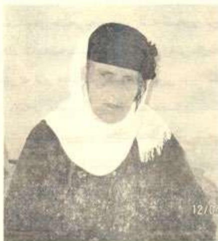
مهليحه فه تحوللا سه عيد