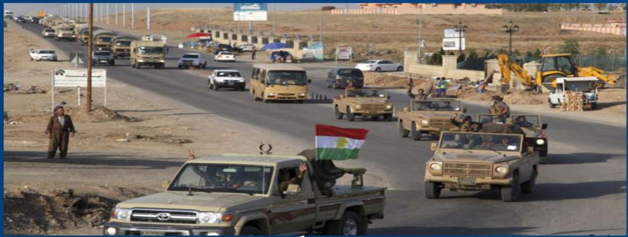
ههولێر چوونی هێزی پێشمه‌رگه بوو شاری کۆبانن