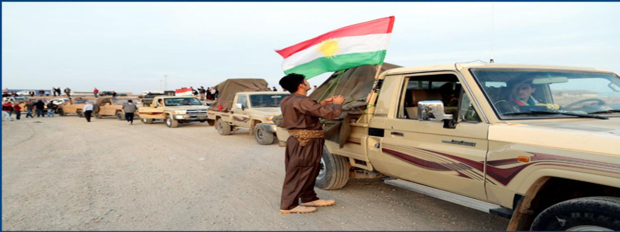
قافلهی هێزی پێشمه‌رگه له ناو ئاپۆرای جه‌ماوه‌ری كوردانی باكوری كوردستان