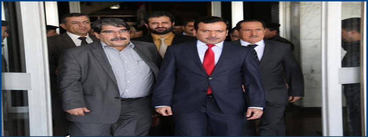
پهرلهمانى كوردستان روژى دهرحونى بريارى ناردنى پيشمهركه بو كۆبانى