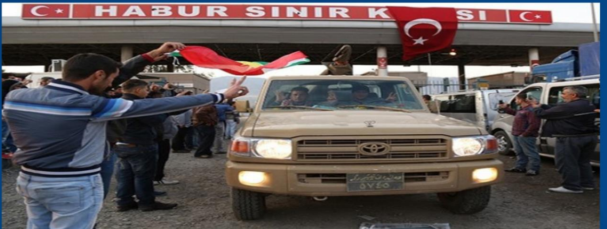
دەربازبونی پێشمەر بو کۆبانى