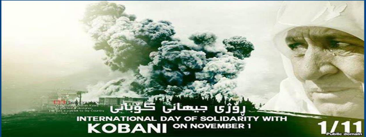
11/1 روژى جيهانى كۆبانى