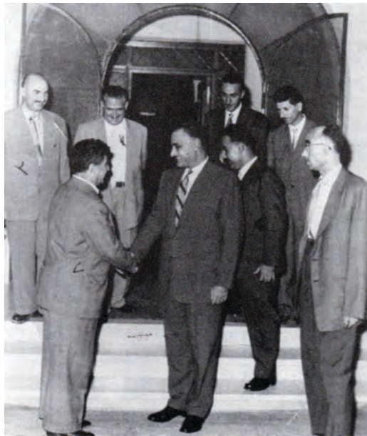
مستہ فا پارزانی جہ مال عہ دولناسر نوری نہ حمہ د تہا میر حاج نہ حمہ د