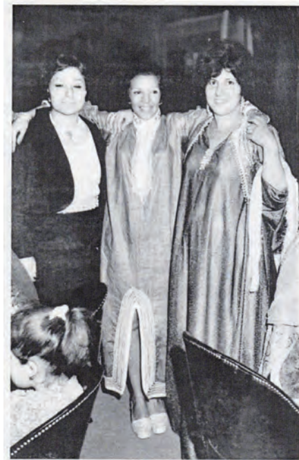
گدلاریز، وهدی نافرذاتی مه‌غریب، سینهم به‌درخان