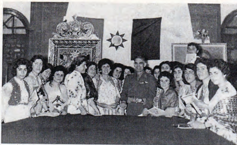
گهلاویژ له گهڼ وه فدی ئافره تانی کوردستان بۆلای عبدالکه ریم قاسم