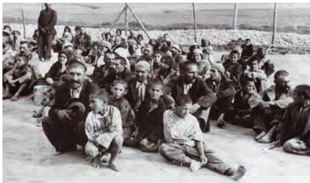
كۆمەلكۆزى كوردەكانى دەرسىم