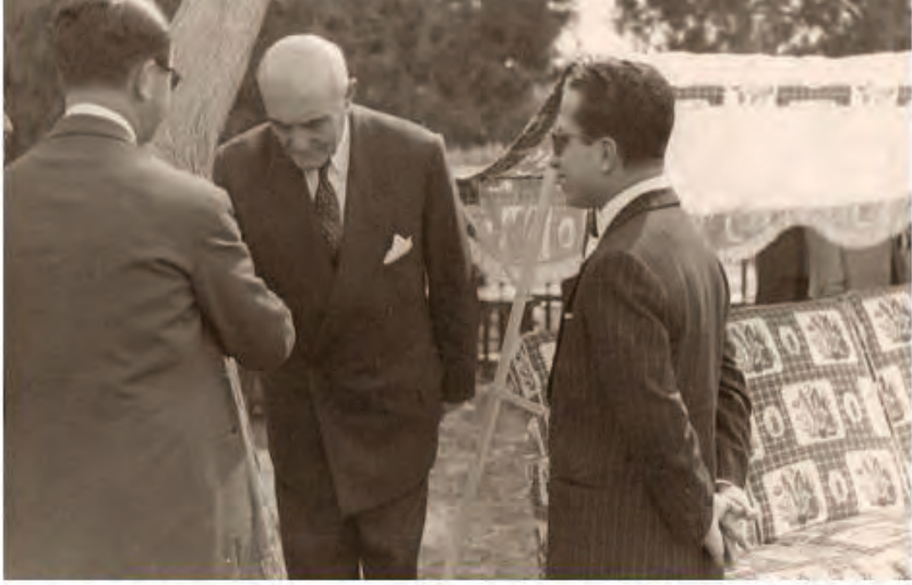
في حديقة منزل (حکمت سليمان) 14 / تموز / 1956 الملك فيصل الثاني والأمير عبدالآله والسيد حکمت سليمان