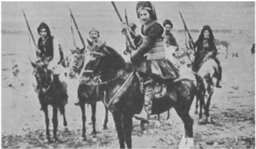
سىمكۆ لەگەل كۆمەلىك لەچەكدارەكانيا