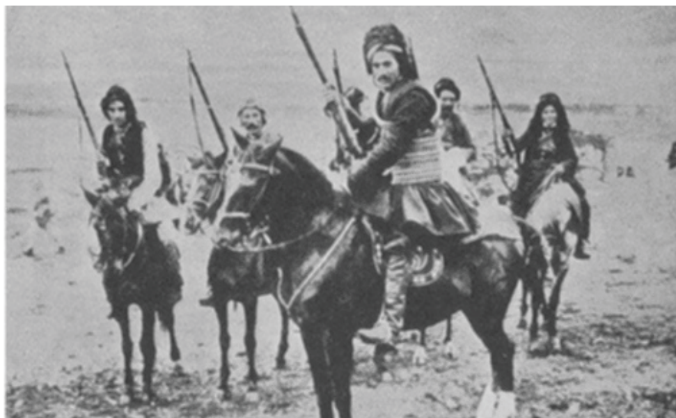
سمكۆ له گه‌ل كۆمه‌لێك له چه‌كداره‌كانیا