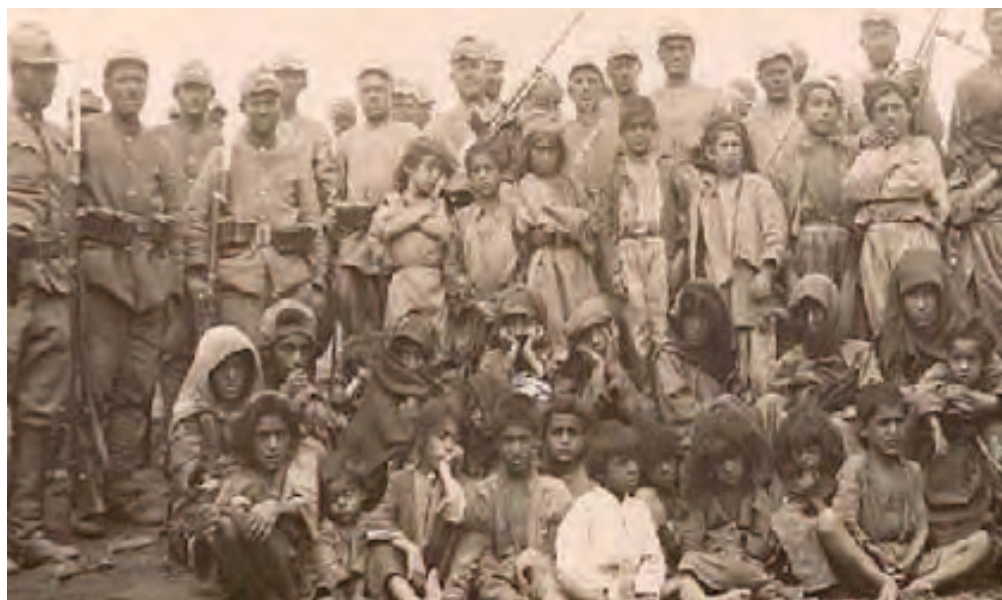
كۆمەلكۆزى كوردەكانى دەرسىم