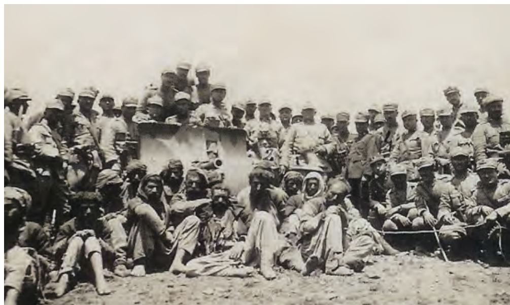
كۆمەلكۆزى كوردەكانى دەرسىم