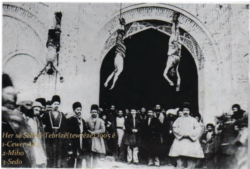
Her sê Şehîdê Tebrîzê (tewrêze) 1905 ê 1-Cewer A. A. 2-Miho 3-Sedo