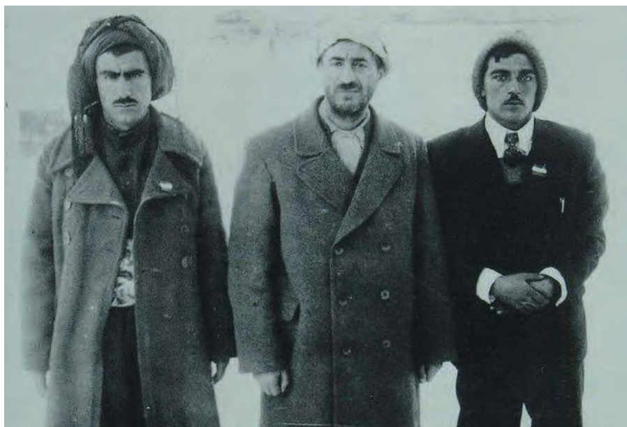
هيمن و قازی و هزار