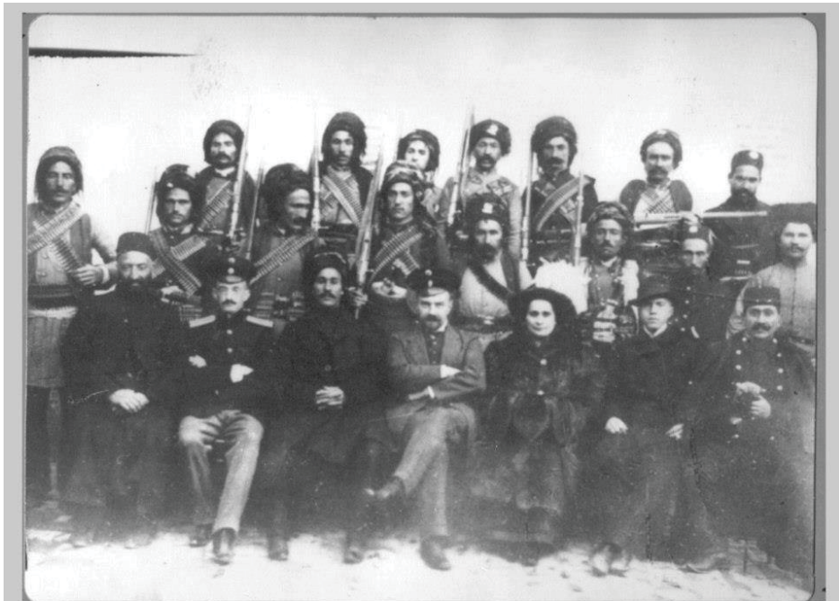
سمکۆ و مارشەمعون و نه که تینی نووسەری روسی