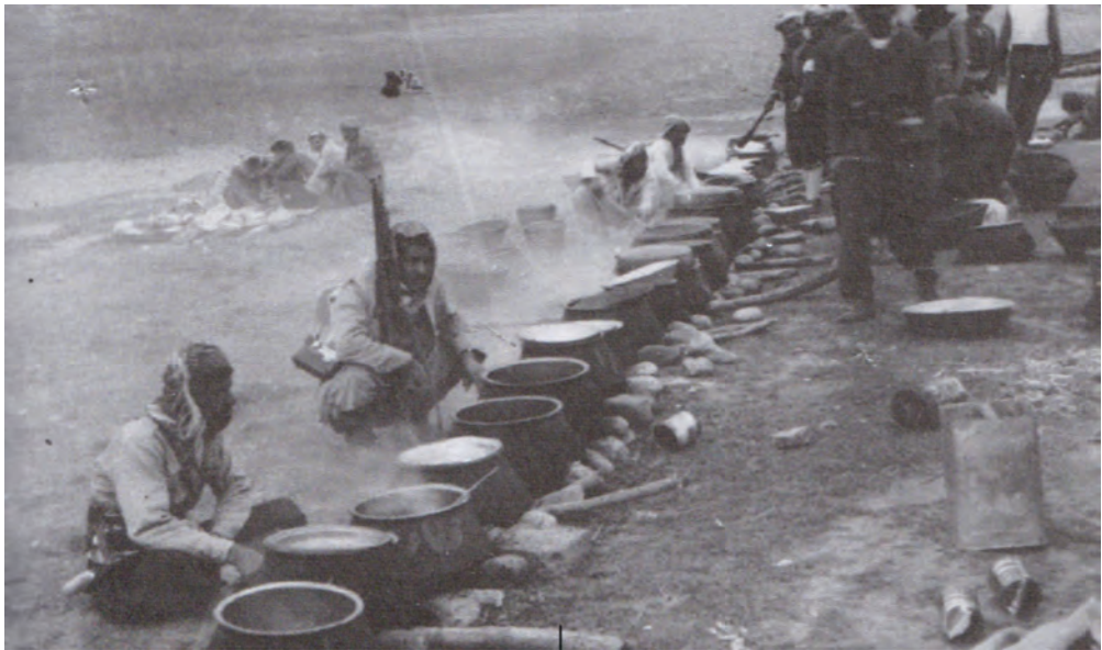
ناماده کردنی خواردن بؤ پیشمه رکه