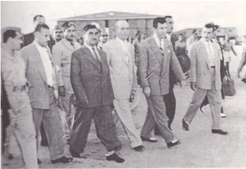
مهلا مستهفا بارزانی، ماموستا برابم ته حمده، فرۆكه خاندی به غدا، له كاتی گهڕانهوهیان له موسكۆ