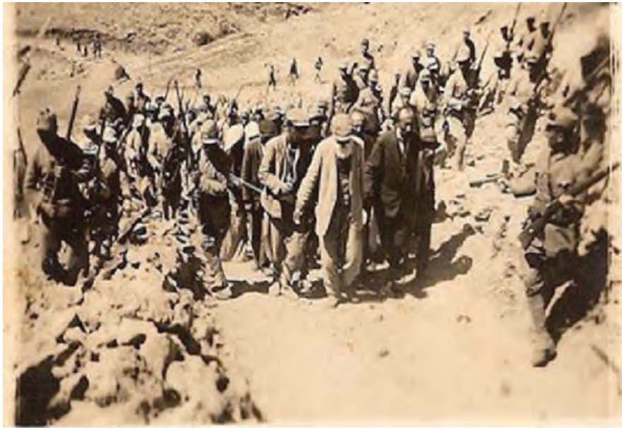
کۆمه‌لکۆزی کوردەکانی دەرسیم