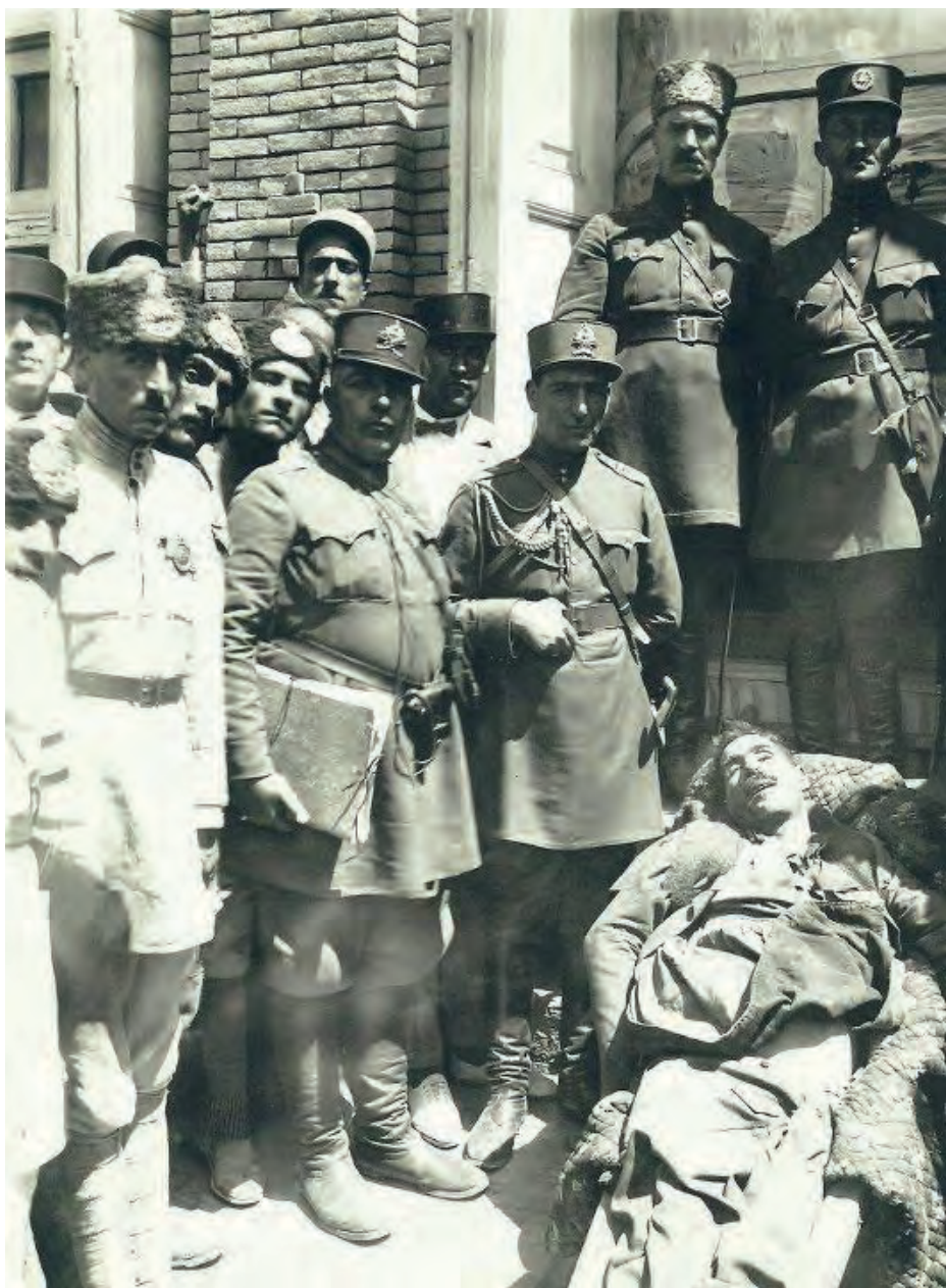
تہ ارمی سمکؤ