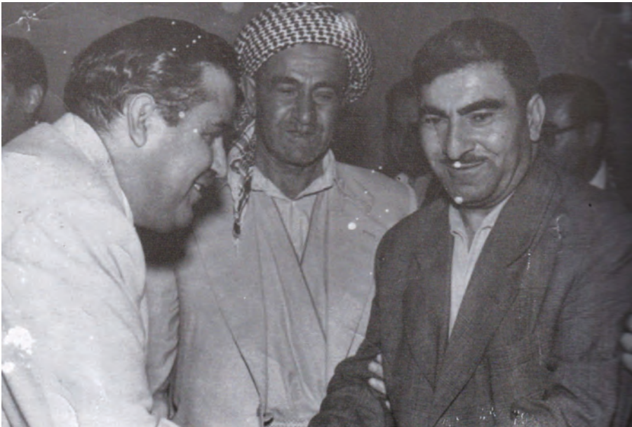
هانی بارزانی بۆ سلیمانی