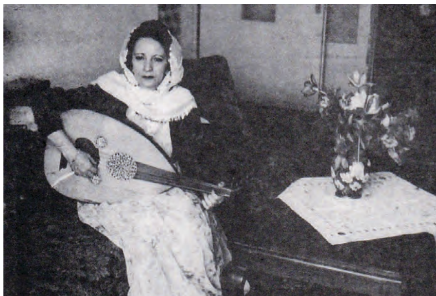
خیزانی نیحسان نوری پاشا