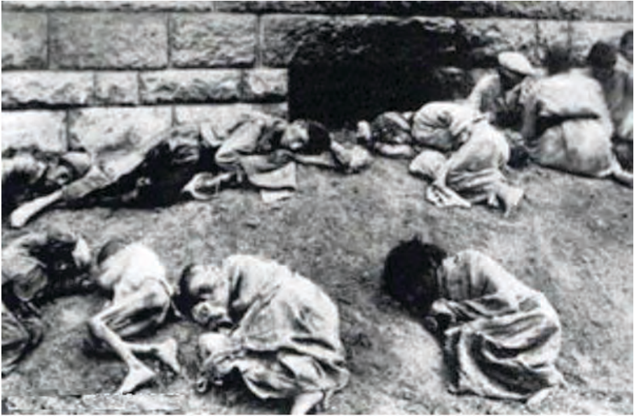
کۆمه‌لکۆزی کوردەکانی دەرسیم