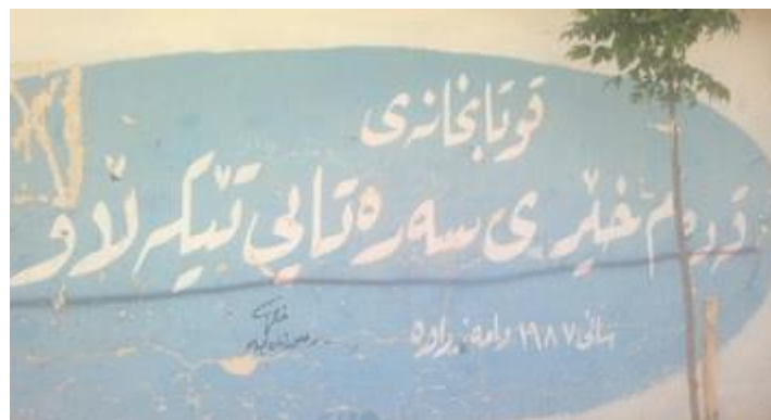
قوتابخانه‌ی سه‌ره‌تایی تیکه‌لاوی "قه‌ده‌مخیر"