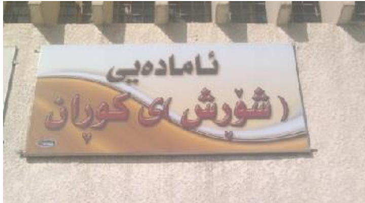
ناماده‌یی کورانه‌ی شۆرش

قوتابخانه‌ی کورانه‌ی قانع، واته قوتابخانه‌که کورانه‌یه و تايبه‌ته به کوران و ناویشی "قانع"ه، ناکری بنوسین: قوتابخانه‌ی قانعی کوران، ئەوه وه‌کوو ئەوه‌یه که بلیین قوتابخانه‌که قانعه و هی کورانه، یان قوتابخانه‌که هی قانعه و قانعیش هی کورانه، بۆیه ده‌بیئت بنوسین: قوتابخانه‌ی کورانه‌ی قانع. جا له‌به‌ر ئەوه هه‌موو ئەم تابلۆیانە که به‌پیی تاییۆلۆجیی عه‌ره‌بی وه‌رگێڤدراونه‌ته‌وه یان نووسراون، ده‌بیئت به‌زوویی بگۆڤدرین: