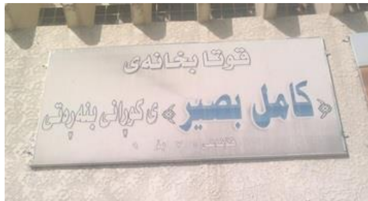
قوتابخانه‌ی بنه‌ره‌تی کورانه‌ی "کامل بصیر"