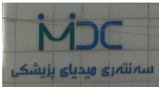
سه‌نته‌ری پزشکی میدیا / ناوه‌ندی پزشکی میدیا

نموونه‌یه‌کی تری هه‌له و داسه‌پاندنی تایپۆلۆجیی عه‌ره‌بی ئه‌وه‌یه که بۆ نموونه ده‌لێن: