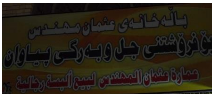
فرۆشگه‌ی جل‌وبه‌رگی پیاوانه

که هه‌له‌یه و ده‌بی بوتریت: کۆمپیوته‌رفروشی کاروان