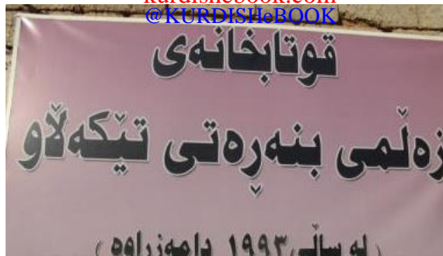
قوتابخانه‌ی بنه‌ره‌تی تیکه‌لاوی "زه‌لم"