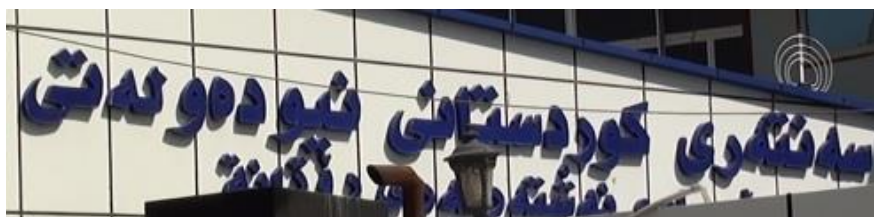
سه‌نته‌ری نیوده‌وه‌تی کوردستان / ناوه‌ندی نیوده‌وه‌تی کوردستان