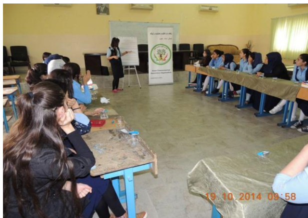
هەولێر- سیمیناری ژینگەیی بۆ خوێندکاران، لەلایەن ڕیکخراوی ئافیاڕی و شیاڕی ژینگە. ۲۰۱۴/۱۰/۱۹.