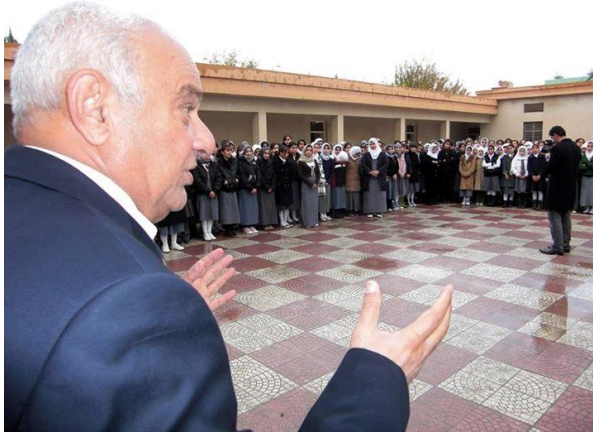
زاخۆ- سیمیناری ژینگەیی لەناوەندی خۆیندن، لەلایەن ڕیکخراوی فەرەشین بوۆ پاراستنی ژینگە. ۲۰۰۹/۱۲/۹.