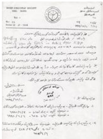
نامه‌ی هه‌لۆه‌شاندنه‌وه‌ی لقی هه‌ولێری (ك.ك.س). ۱۹۹۴/۱۲/۱۰.