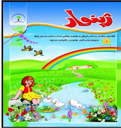
بەرگی ژمارە ۱ گۆڤاری ژینواری ژینگەیی تایبەت بە مەندالان.