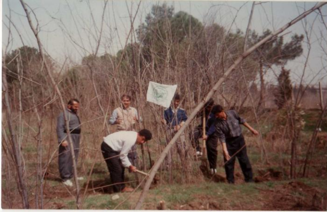
سلیمانی- هه‌لکه‌ندن و گواستنه‌وه‌ی نه‌مام له‌لایه‌ن (ك.ك.س) به‌مه‌به‌ستی چاندن له‌سالی ١٩٩٢.