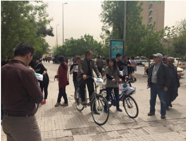
سلیمانی- هاندانی هاوڵاتیان بو بەکارهێنانی پاسکیل. لەلایەن تۆری زهوی مالمانه. لەڕۆژی ژینگە کوردستان. ۲۰۱۵/۳/۱۶.