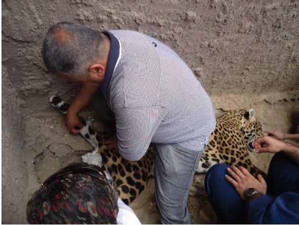
چارەسەرکردنی ئازەلی کێوی. لەلایەن ڕیکخراوا کوردستان ژ بو پاراستنا مافی ئازەلی.