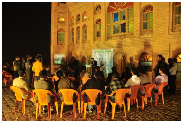
گەرمیان-کەلار: چالاکى جیهانی کاتریمی زهوی. لەلایەن فیدراسیۆنی ڕیکخراوە ژینگەبێهەکان و دەستەى پاراستن و چاککردنی ژینگە. سالی ۲۰۱۳.