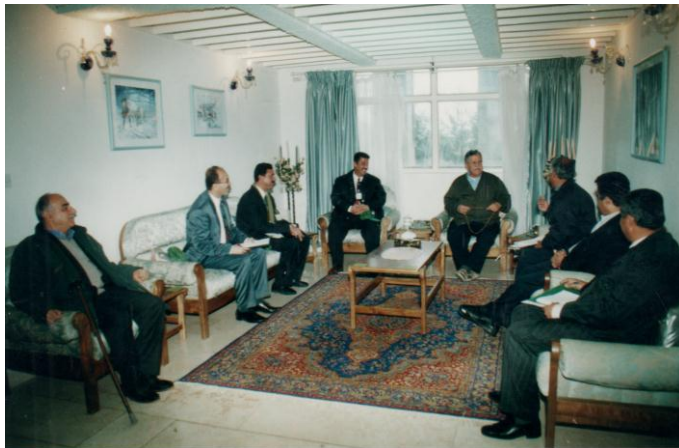
سلیمانی- سه‌ردانیه‌کردنی وه‌فدیکی (ك.ك.س) بو‌لای به‌رێز جه‌لال تاله‌بانی سه‌رۆکی هه‌ریمی کوردستان. ٢٠٠١/٢/١٥.