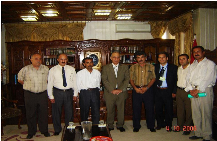
هه‌ولێر- سه‌ردانیکردنی وه‌فدیکی(ك.ك.س)بو‌لای به‌رپێز عه‌دنان مو‌فتی سه‌روکی په‌رله‌مانی باشوری کوردستان. ۲۰۱۶/۱۰/۴.