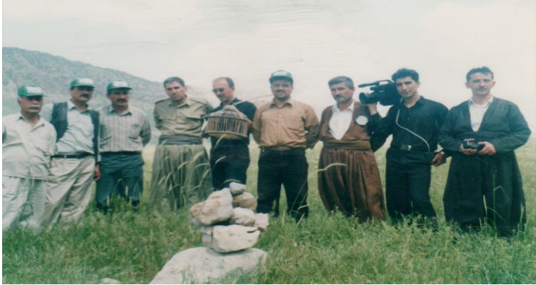
سلیمانی-می‌رگه‌پان: نازادکردنی ۱۸ کهو له‌لایهن(ك.ك.س). ۲۰۰۲/۵/۱۶.