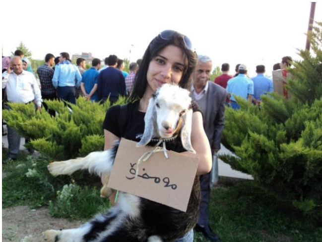
سلیمانی- قیستیقالی سەوز، بەبەشداری ڕیکخراوی نازەئپاریزانی کوردستان.