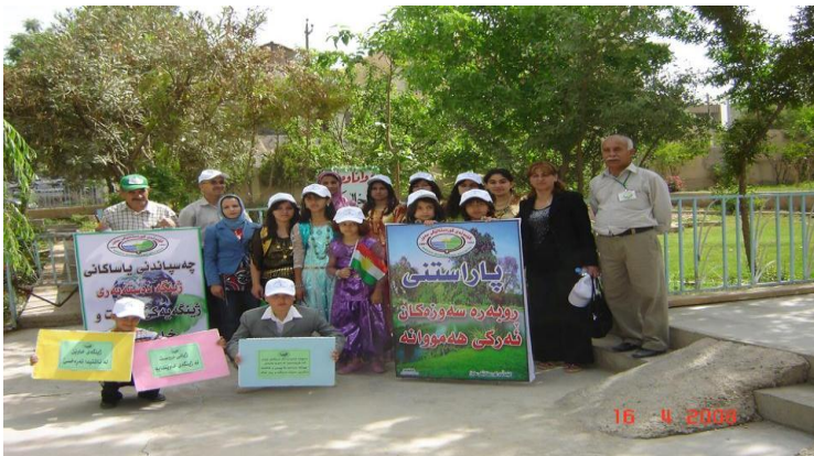
سلیمانی- بلاوکردنەوه‌ی هۆشیاریی ژینگەیی له‌لایەن (ك.ك.س) له ناوەنده‌کانی خۆیندن، له‌ پوژی ژینگەیی کوردستان. ۲۰۰۸/۴/۱۶.