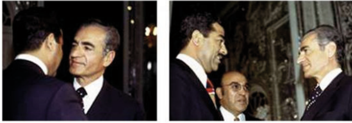
عناق الشاه وصدام حسين بعد التوقيع على اتفاقية الجزائر 6 آذار عام 1975

"... أعلن الرئيس الجزائري بومدين أن الخلافات بين إيران والعراق انتهت... وتعانق جلالته الإمبراطور مع صدام حسين أمام الأنظار وأعربا عن شكرهما للجزائر..." 287