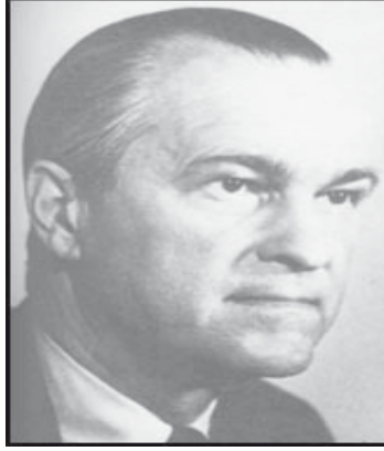
مدير المخابرات المركزية ريتشارد هيلمز

إن هذا مخالف لما أراده الشاه، إذ كان يطلب ان يقابل كيسنجر المبعوثين. 160 لكن في النهاية جنحت الإدارة الأمريكية إلى آراء Harold Saunders .