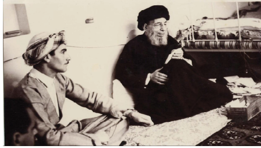
آية الله العظمى سماحة الامام السيد محسن الحكيم وشيركو عابد في منزل الإمام (شباط 1969)

عاشت الحوزات العلمية الشيعية ظروفاً في غاية الصعوبة في ظل حكم البعث ذي الطابع السني-الشوفايني، فقد تدخلت في شؤون المراجع ترغيباً وترهيباً لتطويعهم، واقحامهم في حربها ضد شعب كردستان، فطلبت سلطة البعث من آية الله العظمى سماحة الامام السيد محسن الحكيم اصدار فتوى يجيز شن الجهاد ضد الحركة الكوردية، لكن على عكس ماتوقعه البعث، أصدر الامام فتوى تحريم القتال ضد الشعب الكوردي في شهر كانون الثاني من عام 1969. ثم انتهج نظام البعث سياسة معادية للحوزة تمثلت في التصفية الجسدية للعديد من أشهر علمائها، كما استخدم الشيعة كوقود رخيص لحروب مقبلة لقي فيها مئات الآلاف حتفهم.