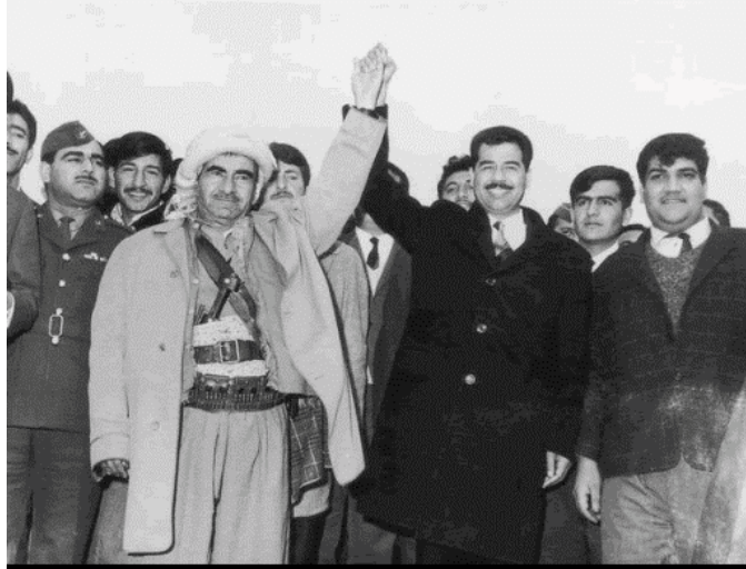
ملا مصطفى وصدام حسين مبتهجان للتوصل إلى حلّ عام 1970

ولم يكن الهدف من التوصل إلى اتفاق مع الزعامة الكوردية غير كسب الوقت، وقد كان الطرف الكوردي مبتهجاً بالتوقيع على بيان آذار عام 1970 وأعتبر ذلك من منجزات الحزب العظيمة. ويعلق شكيب عقراوي على نقاط الضعف في بيان آذار عام 1970: "لم يجر تحديد نوع الحكم الذاتي الذي سيجري تطبيقه خلال الأربع سنوات" و "لم يسمح بيان آذار بتدخل هيئة دولية كالأمم المتحدة أو دولة صديقة للطرفين في الاشراف بصورة رسمية على تنفيذ البنود والاتفاقيات التي جرى التوقيع عليها بين الجانبين." و "لم يجر تحديد المنطقة الكوردية في البيان التاريخي وجرى ترك الموضوع للإحصاء السكاني الذي لم يتم اجرائه." ويضيف: "ومن الناحية القانونية فإن موضوع الحكم الذاتي لم يكتسب الصفة القانونية لأن الاتفاق بين طرفين حول الاتفاق في المستقبل على أمر من الأمور لايعتبر عقداً قانونياً." 18