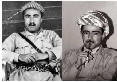
إدريس بارزاني دكتور محمود عثمان

ذلك من عواقب على الدول الاخرى في المنطقة، بالأخص إيران، تركيا المملكة العربية السعودية، الاردن ودول الخليج الفارسي. ثم تكلم بشيء من التفصيل حول الجهود السوفيتية والعراقية المشتركة لوضع الأكراد تحت سيطرة النظام البعثي في بغداد. وذكر بشكل خاص كثافة الضغط السوفيتي المباشر على القادة الكورد، ويتضمن هذا زيارات لملا مصطفى من قبل أعضاء قياديين في الحزب الشيوعي للاتحاد السوفيتي ومن جمهورية ألمانيا الديمقراطية. (.....) أرسل تقريراً عن مطالب السوفييت من ملا مصطفى البارزاني في وقت متأخر من شهر حزيران عام 1972 للحصول على جواب واضح لعروض السوفييت السابقة للأكراد للانضمام إلى حكومة الجبهة الوطنية العراقية. ووصف الجهود السوفيتية كتكملة لنشاطات العراق الاقتصادية والعسكرية والارهابية الهادفة إلى تحطيم البارزاني والقيادة السياسية لأكراد العراق. (.....) قال ان البارزاني وزعماء أكراد آخرين لا يعتقدون ان بمستطاعهم مقاومة الضغط السوفيتي العراقي المشترك أكثر من ستة أشهر بدون مساعدة خارجية هامة. وإن لم تصل هذه المساعدة، يعتقد الكورد انهم خلال ستة أشهر سيضطرون إما إلى مساومة سياسية مع الحكومة المركزية العراقية أو القتال مع هزيمة مؤكدة.