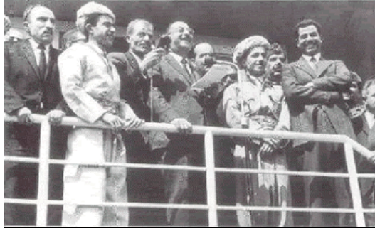
صدام والبركر مع نجلى ملا مصطفى و د. محمود عثمان. بغداد 1970