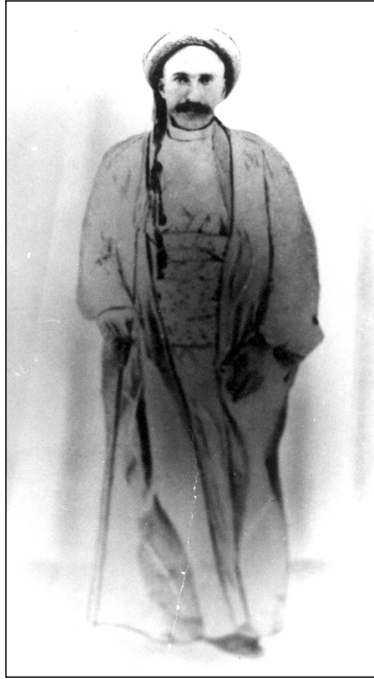
نافيع ئاغاي باوكى رهمزى

كېھەيان دېتە كردن. تا له ساپەى ئەمانەدا بيت بە ژيان و بە گيان له دالدهى واندای. نەخشەكەى مە ئەو بوو نكا له ئاغا بکەين بمانگەپەنیتە چیا و ماوہیەكى زۆر لەوئ دوورەدەست بژین، له هەمان كات بەلەپكى ئەوتۆمان بەگەلّ بدا سنوورى كورد و تورك بزانی و پەككیمان بە ئەسپایی ئاودیوی توركیا بکاتەوہ. لەوئ ئەو كەسە خۆى بداتە دەستی پۆلیس و داوا بکا بپتە گرتن و وەك نیستمانیەكى ئەلمانی دەتوانئ پتوهندى بە بالۆیزگەى خۆیەوہ بکات و بەسەرھاتی مە بە ولات راپگەپەنئ. تەنانەت ئەگەر بیەوئ دەتوانئ بچیتەوہ ولاتیش.