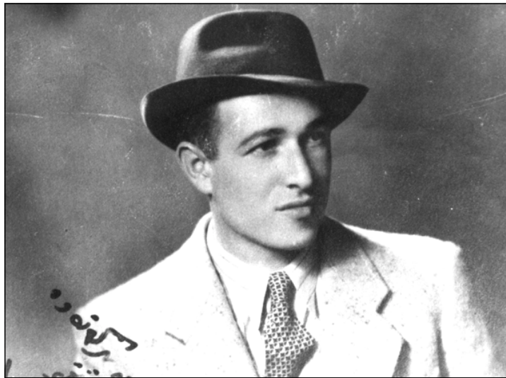
براتان بیر کهنه‌پوشه: په‌مزی