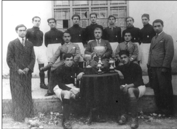
تیپی تۆپی پی له دواناوهندیی کهرکووک، ۱۹۳۷، رهمزی به دانیشتوویی له دیوی راستی کۆمه له تاسه کهدا

له سه رانسهری گنیرانه وهکانیدا دهرده کهوئ.