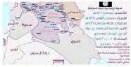
بغداد الكوردي من الكوردي و بؤ كافران

الدولة الإسلامية # تضع خارطة تفصلية مع عدد السكان التي أصبحت تحت سيطرتها بمساحة أكبر من سوريا # ب 16 الف كم2