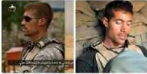
جرائم الحرب من اليمن وخطوة العساة

جانب من حملة التعتيم الجوي أثناء الهجوم على الكنكات الحشيش الصقوي جنوب ولاية العلوحة # الدولة_الإسلامية