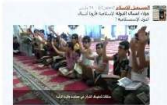
جيش الدولة الإسلامية جيش الدولة الإسلامية