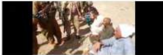
سوزج و كركوك (Kawthar) في العراق مند هيا اهدك السنهركه و كركوك السنهركه ولاه سوك ولاه كركوك الدوله الاسلاميه السنهركه ولاه سوك