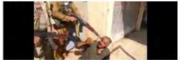
سوزج و كركوك (Kawthar) في العراق مند هيا اهدك السنهركه و كركوك السنهركه ولاه سوك ولاه كركوك الدوله الاسلاميه السنهركه ولاه سوك