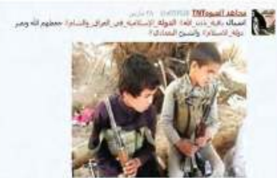
جيش الدولة الإسلامية جيش الدولة الإسلامية