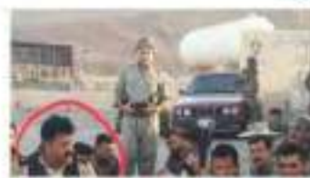
بعض الصور من الجو ومناطق كركوات