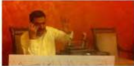
جرائم الحرب من اليمن وخطوة العساة

تتذكر عن خير تشيرته سابقاً وهو هلاك عبدالجبار ابو ريشة الكلب مراراً حياً نسال ان يقطع راس قريباً