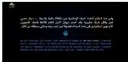
عراق الفلحة من الصور ومقاطع الفيديو

اعلامية برعاية 2015-01-17 الساعة 11:00 لتذكير بالمكافاة من الدولة الاسلاميه لمن يقتل طيار صليبي