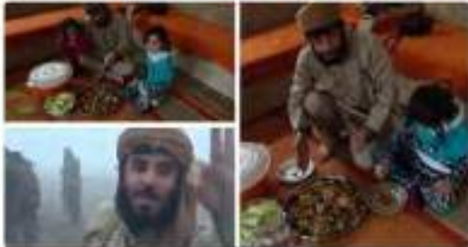
بعض الصور من الجو ومناطق كركوات

عديد فلما صورة هدية آبي انوارا بسطارة العريش و الاعطار كاتين جوب بصلتكم ولادة كركوات الدولة الإسلامية