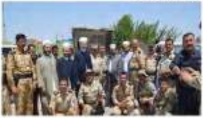
خبرنا الخبر من الخبر ومواقع الفيديو

مرحبا بالخلافة - 2020/01/17 - 11:58 علماء السنو للمعاوية كردستان ليس فيها عالم يعتمد عليه ابنة !! كلهم مفلححسن