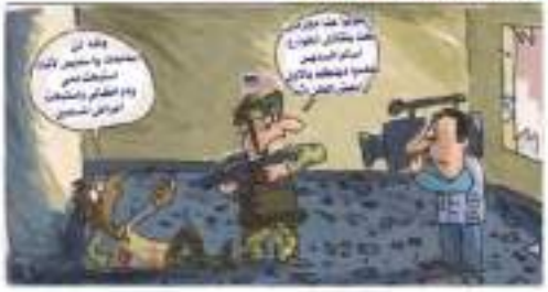
عزيم الحيد من الفيس بوك

سمر الحظوة: 2012/02/11 كثر تكبير: الأتباع والسجود المأجورين مع الحكومة يملكون على عمال السجون الدولة الإسلامية (Islamic Press) (MajedLeftani) @immar_2 الدولة الإسلامية نحن بطرف الحجة