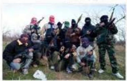
عمر المرير من المرير وهاك المرير

مرحبا بالخلافة @ISIS مرندك الاكراد يحرقون رايه العراق !! رايه الدوله الاسلاميه يا خليفة المسلمين لن نسبح بلنمقو جنهم في حال نفكنا عنهم