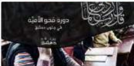
عراق الفلحة من الصور ومقاطع الفيديو

اعلامية برعاية 2015-01-17 الساعة 11:00 الدولة الإسلامية واللاهوتيين المكتبة الإسلامية يقدم علومهم عن "أهل السنة والجماعة"