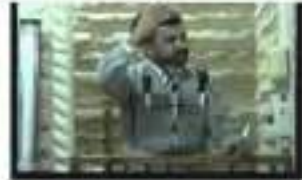
خبرنا الخبر من الخبر ومواقع الفيديو