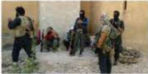
عراق الفلحة من الصور ومقاطع الفيديو

عاجل: الله اكبر الله اكبر جنود الخلافة يقولون الانحياز من عين السلام اللهم لك الحمد السلام عليكم.