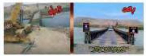
بغداد الكوردي من الكوردي و بؤ كافران