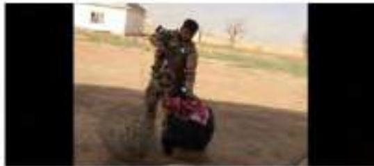
سوزج و كركوك (Kawthar) في العراق مند هيا اهدك السنهركه و كركوك السنهركه ولاه سوك ولاه كركوك الدوله الاسلاميه السنهركه ولاه سوك