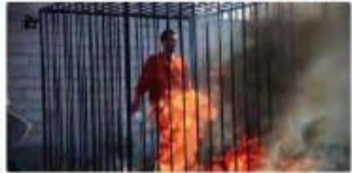
جرائم الحرب من اليمن وخطوة العساة

اطعامه برقوقه وسمه حمار احرق الاطفال والنساء بالصواريخ وكان هذا العقاب النمرعي لما فعل من جرائم بشعه في ارض الخلافة معاذ الكساسبة