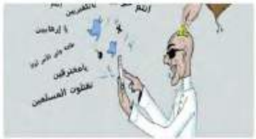
عزيم الحيد من الفيس بوك

سمر الحظوة: 2012/02/11 كثر تكبير: الأتباع والسجود المأجورين مع الحكومة يملكون على عمال السجون الدولة الإسلامية