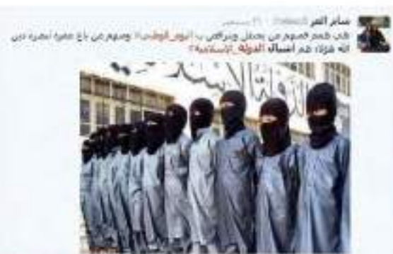
جيش الدولة الإسلامية جيش الدولة الإسلامية