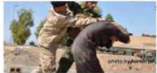
عمر المرير من المرير وهاك المرير