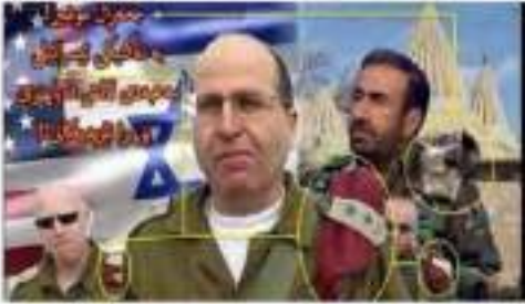
خبرنا الخبر من الخبر ومواقع الفيديو