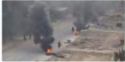
جرائم الحرب من اليمن وخطوة العساة

جانب من حملة التعتيم الجوي أثناء الهجوم على الكنكات الحشيش الصقوي جنوب ولاية العلوحة # الدولة_الإسلامية