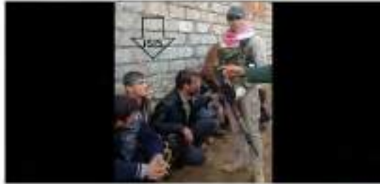
رامينعري | طريق النبي (Kawthar) في العراق جاني هوستالاري بديست جانيهركي كافيون بلوك بكمجون يو رسوا كرمبا ولاه كركوك ولاه سوك