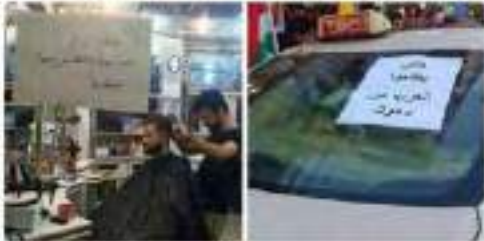
عراق الفلحة من الصور ومقاطع الفيديو

عراق الآن بعد سقوط الموصل 2015-01-17 الساعة 11:00 فلتأملوا مع العرب في (http://pc.ub.edu/~pab/2015/01/17/عراق-الآن-بعد-سقوط-الموصل/)