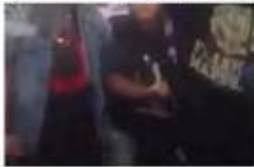
عمر المرير من المرير وهاك المرير

مرحبا بالخلافة @ISIS مرندك الاكراد يحرقون رايه العراق !! رايه الدوله الاسلاميه يا خليفة المسلمين لن نسبح بلنمقو جنهم في حال نفكنا عنهم