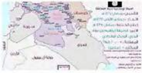
بغداد الكوردي من الكوردي و بؤ كافران

الدولة الإسلامية # تضع خارطة تفصلية مع عدد السكان التي أصبحت تحت سيطرتها بمساحة أكبر من سوريا # ب 16 الف كم2