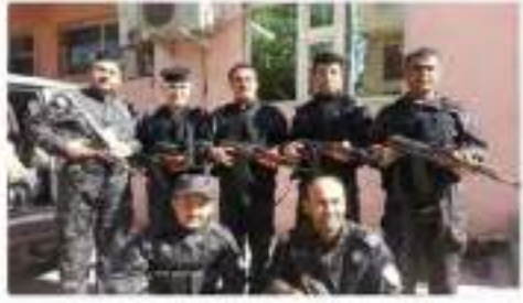
خبرنا الخبر من الخبر ومواقع الفيديو

مرحبا بالخلافة - 2020/01/17 - 11:58 قلوب تعزيمهم لم يظلموا بخاصة على اني كان يهاجم على سرعهم اليوم الامداد الاسلامي اكلوا استعمالهم بعدك الدولة الإسلامية