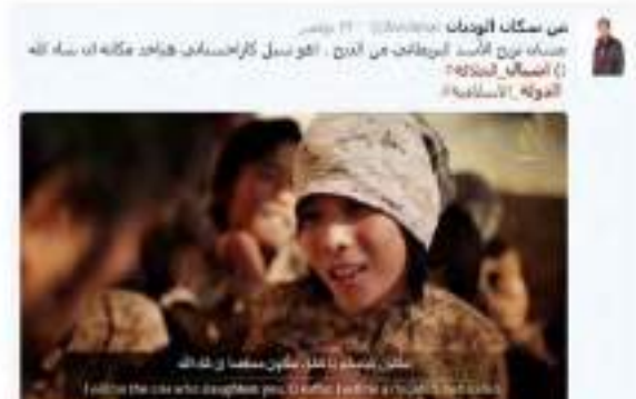
جيش الدولة الإسلامية جيش الدولة الإسلامية