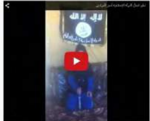
علم جيش الدولة الإسلامية شعر العراقيين علم جيش الدولة الإسلامية شعر العراقيين