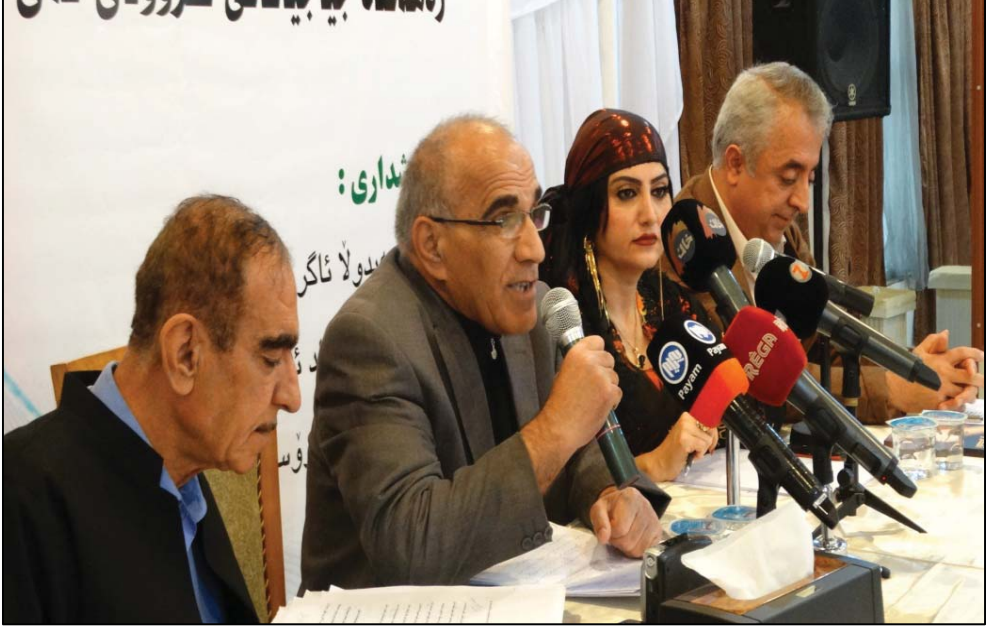
كۆرى تايىبەت بە (رههەندە جياحياكانى دەقى ئەى رهقىب) سلېمانى- هوئى ئۆتئىل پەرىژ- روژى (۲۰۱۳ / ۱۱ / ۳۰)