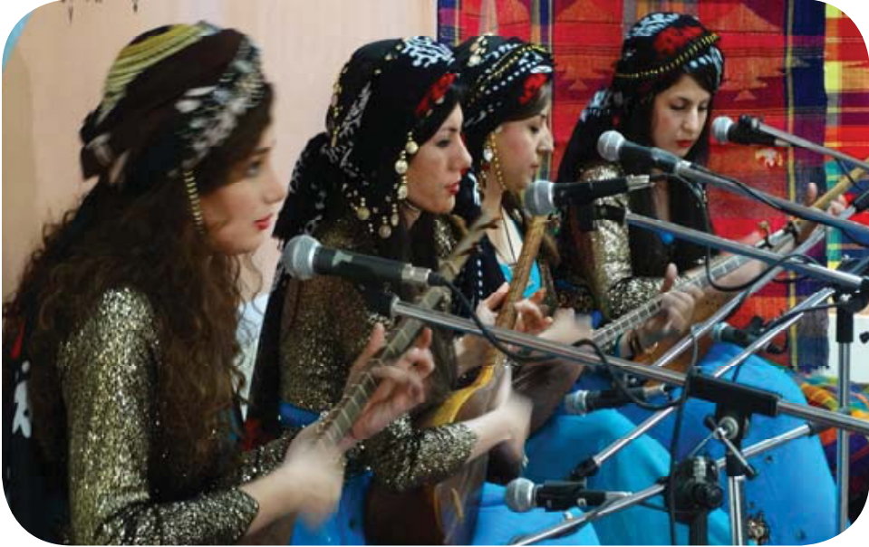
گرووپى مۇزىكى (دايراك خاتوون)- كۆنسىرتى گۇرانى يارسان- ھۆلى بۆنەى كاكەيپەكان- ھەلەبجە.