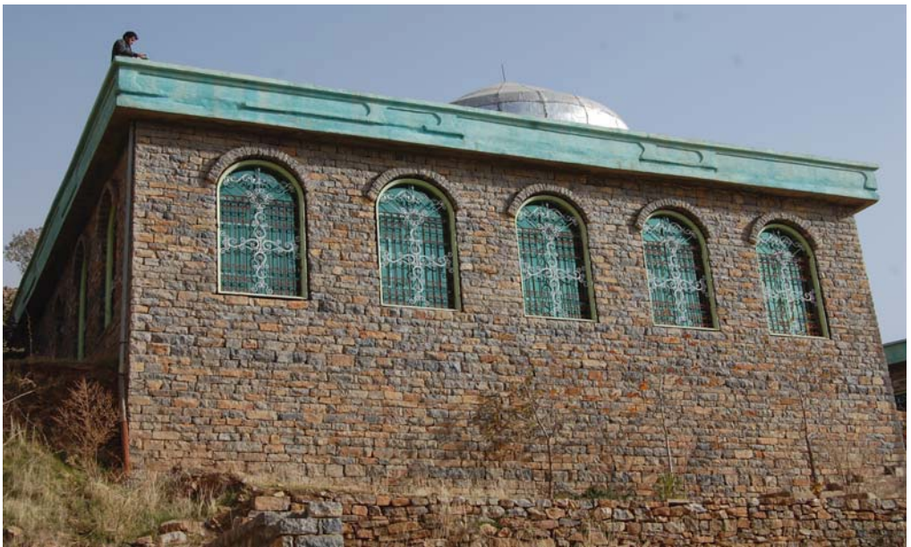
خانەقاي (شېخ حسامەددین نەقشبەندی)- باخەكۆن