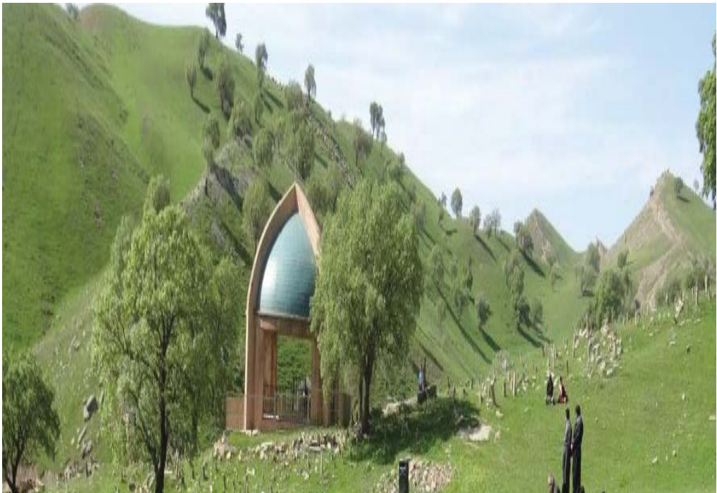
مەزاري مەولەوی- سەرشاتە