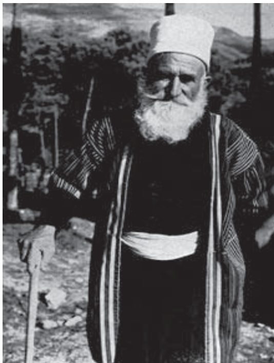
رۆحانییهکی دورزی به جلو بهرگی دینییهوه.

و له رووی سیاسیشهوه هموو مافهکانیان له ههئبژاردنه جیاچیاکان بۆ خۆکاندیدکردن و دهنگدان سهلمینراون، بهلام له ولاتی (ئوردون) ههرحهنده بهشدارییهکی باشیان له دامهزراندنی دهولتهتهکهدا ههبووه، کهچی تا ئیستا نهوهک کهمینه و تهناهت وهک (خیل)یش له ناو سیستمی خیلایهتیدا مافهکانیان نهسهلمینراون.