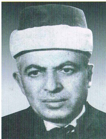
خوالیخۆشبوو (عهلائه ددینی سهجادی)

پاش ئهه ديپرانهى سهروهه دهچينه سهه بهدواداچوونى راي ماموستا سهجاددى، بو ئهه مهبهستهش پيويسته سهههتا دهقى نووسينهكهى ناوبراو له خواره وه بنووسينهوه: