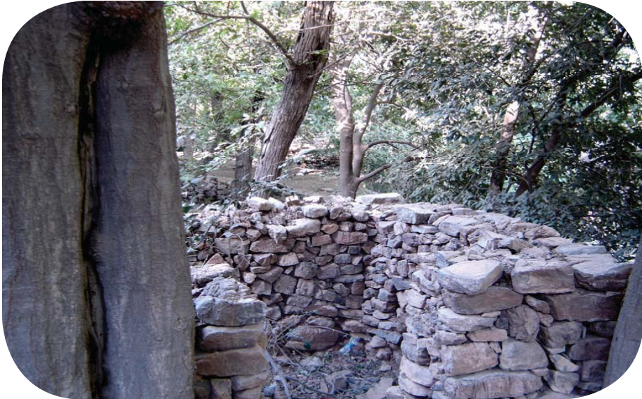
بەككك لهو مەزارانەى كە (وئۆلەبالئ= بووكە بەبارانئ) دەبرايە سەرى- تەوئىلە