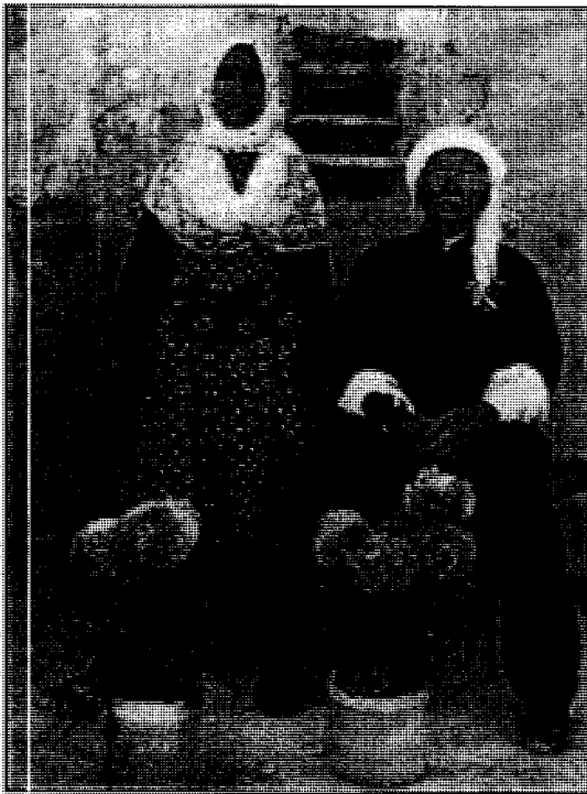
وینهی مامؤستا راوچی و هاسره کهی (ئاوایی دهرویشان)