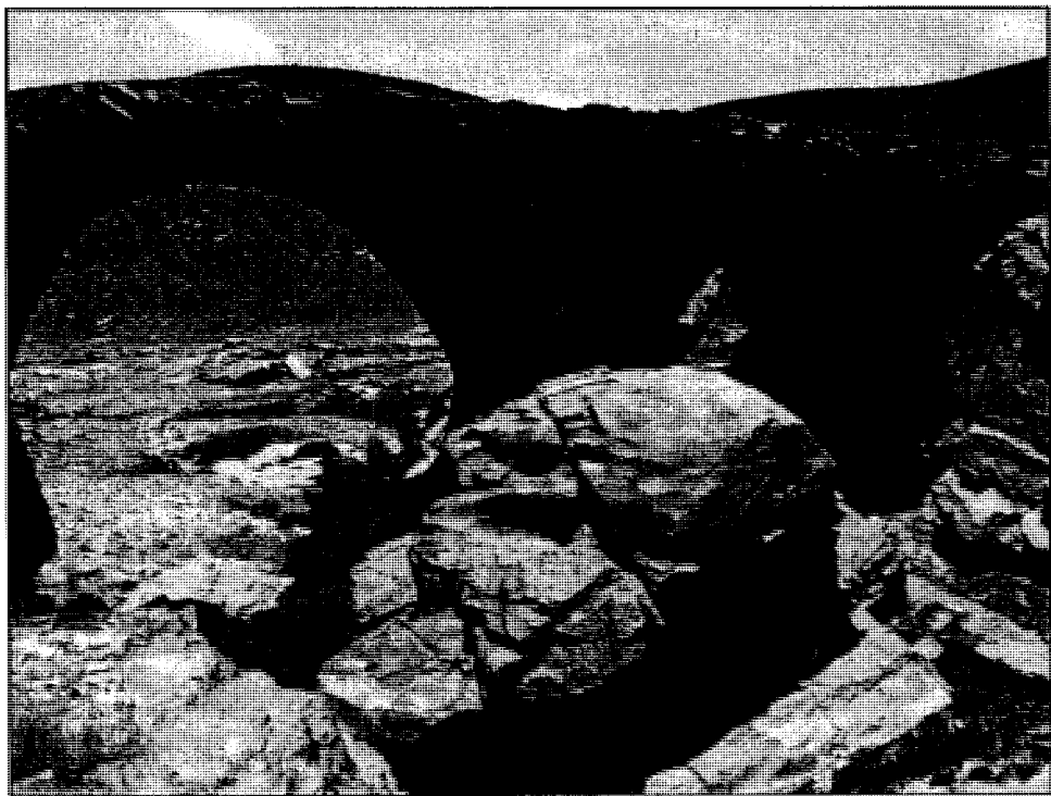
وینهای پردی سولتان