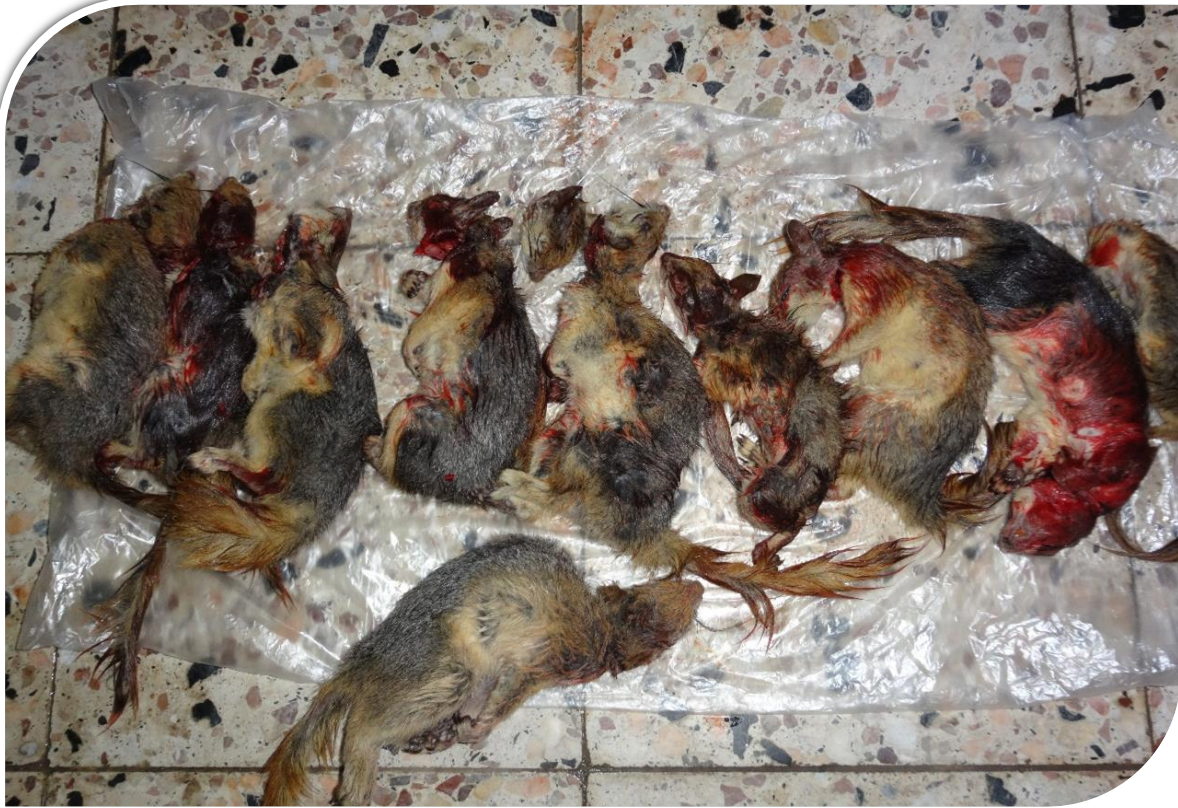
(كوشتنى سمۆرە)