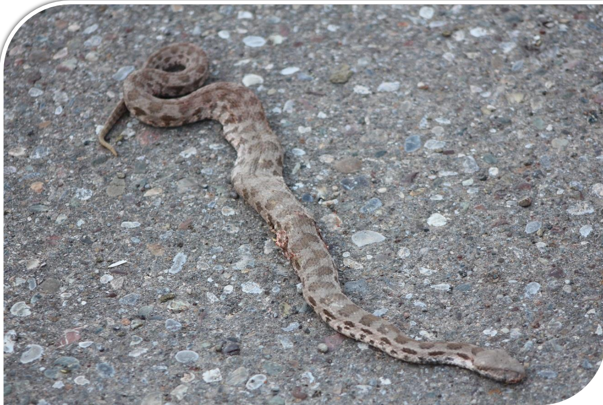
قه رهداغ (كوشتنی مار) ۲۰۱۷