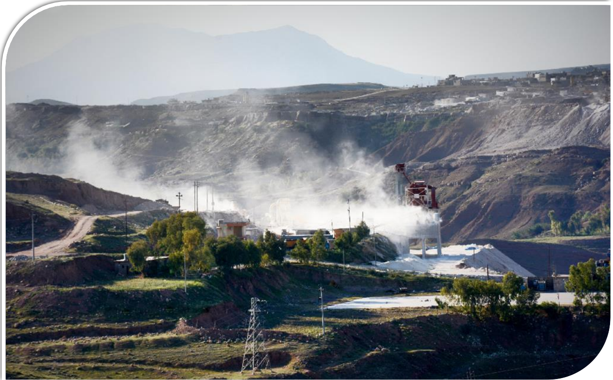
ده‌ریه‌ندیخان (كارگه‌ی گه‌چ، نه‌بونی فلتنه‌ر، بیسكردنی ره‌گه‌زی هه‌وا) ۱۹ ۴ ۲۰۱۸