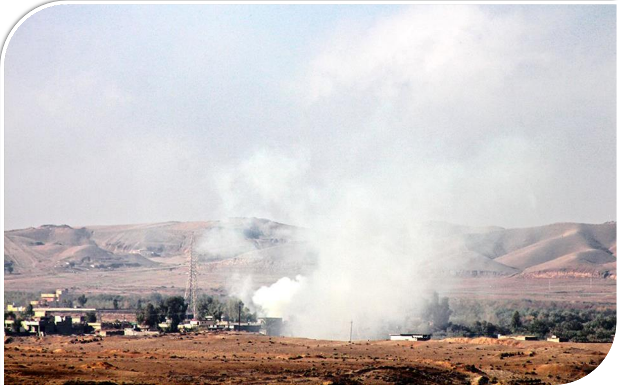
جەنەۋلا (شەرى داعش، تەقىنەۋى بۆمب) ۲۰۱۵