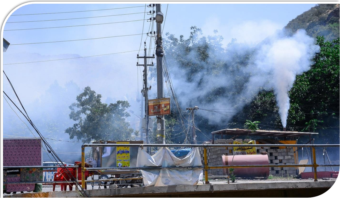
هه‌ورامان (بیاره، پیسکردنی ژینگه‌ی بینین و بیستن "ژاوه‌ژاو") ۲۰۱۶