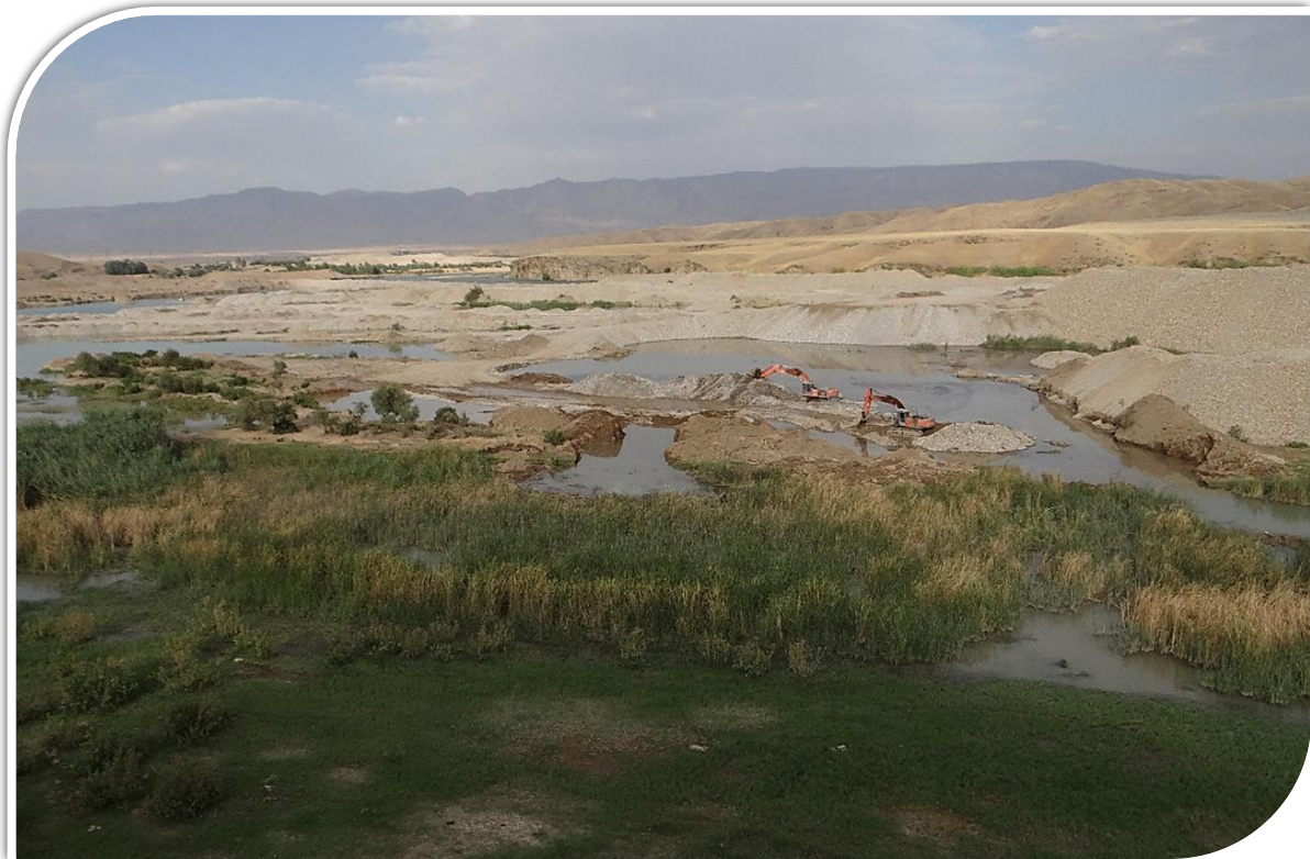
رۇبارى سىروان (كارگەكانى دەرھىنانى چەو و نەم، نە پىناو پارە، رۇبەرەسەوزايىبە خۇرسكەكانىيان نە ناۋبردوۋە و پىرەۋى ناۋەكەيان گۇرپوۋە، كارگردنىيان بەردەوامە ) فۇتۇ/ سەرۋەر محمد ۲۰۱۶