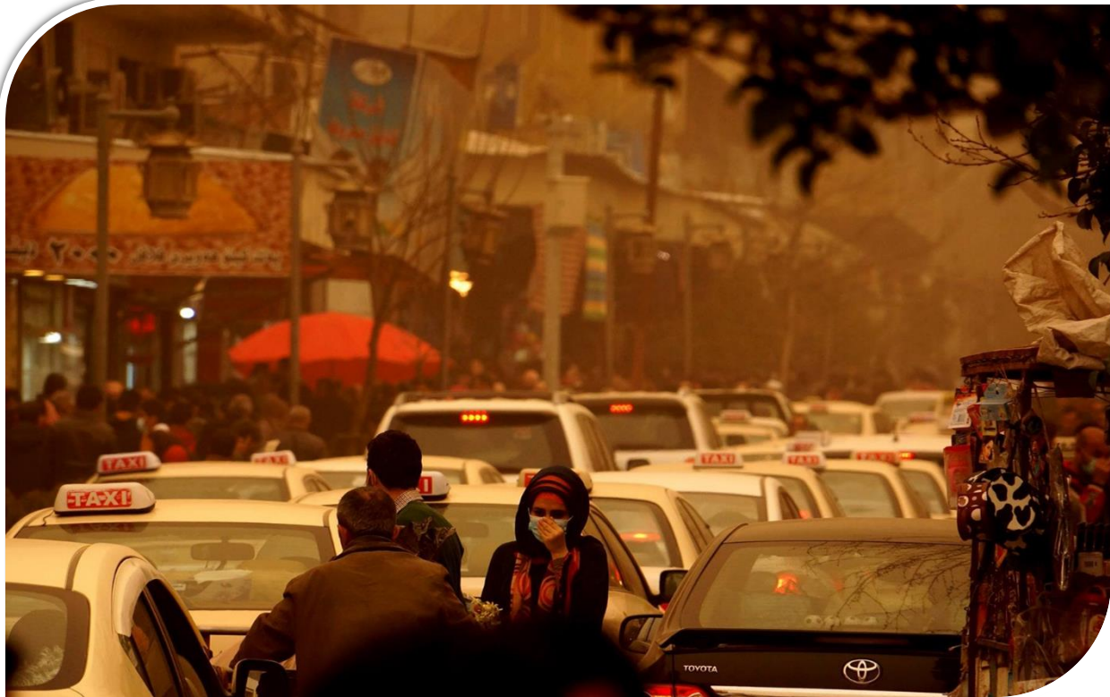
سلیمانی (خۆئبارین، به هۆی له ناوچونی درهختستانه كان و دیاردهی به بیابان بوون)