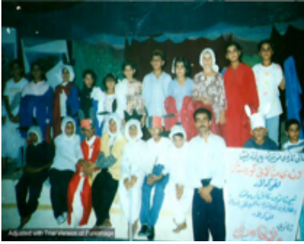
شانۆی مندالان - تیپی شانۆی مندالانی گهرمیان