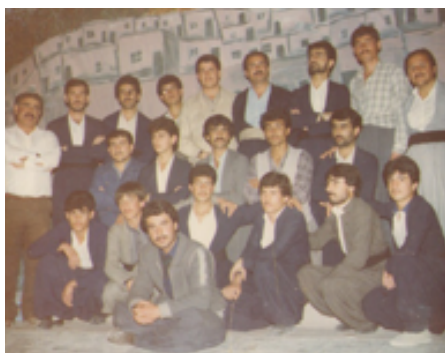
تیپی شانۆ و مۆسیقای گهرمان