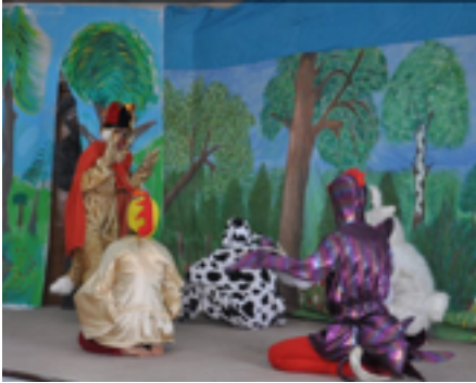
شانۆگه‌ری مندالان - په‌روه‌رده‌ی