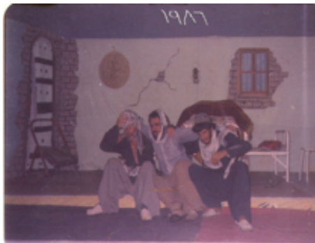
شانۆگهری پارهی دهرمان - ۱۹۸۶