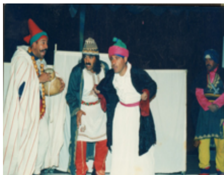
شانۆگەری بەرەو خۆر - ۲۰۰۱