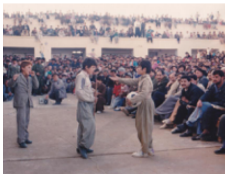
شانۆگەری بزەنە زێڕینە - ۱۹۹۳