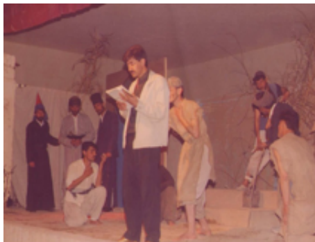
شانۆگهری ئەژدیها و شاری ئەوین - ۱۹۹۰