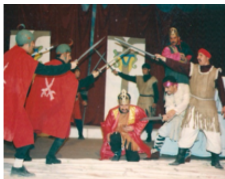
شانۆگەری گەپان بە دوای بەختەوهریدا - ۲۰۰۲