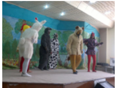
شانۆگه‌ری مندالان - په‌روه‌رده‌ی