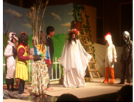
شانۆگه‌ری مندالان - په‌روه‌رده‌ی