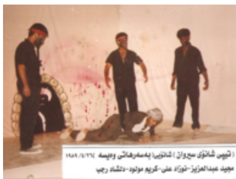
شانۆگهری به سه رهاتی وهیسه - ۱۹۸۹