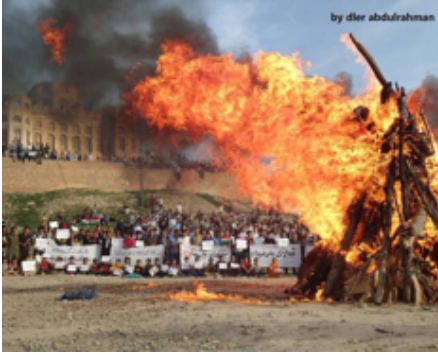
٢٠١٢ ناگه‌ری نه‌ورۆز