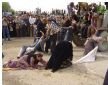
تراژیدیای ئەنفال - ۲۰۰۵