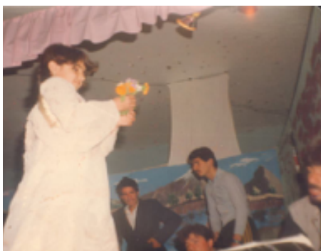
شانۆگهری دهریا - ۱۹۸۷