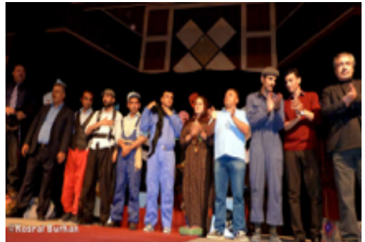
شانۆگه‌ری ده‌مامک - ٢٠١٦