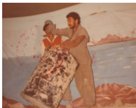
شانۆگهری بیخه می ناو بهرمیله که - ۱۹۸۸