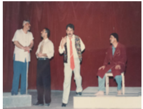
شانۆگه‌ری گه‌ران به‌دوای به‌خته‌وه‌ریدا ۲۰۰۲