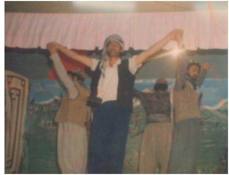
شانۆگه‌ری کاوه‌ی ئاسنگه‌ر - ۱۹۸۷