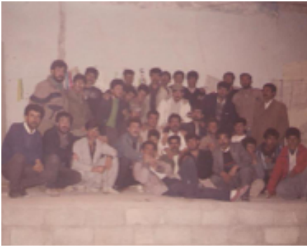
شانۆگه‌ری یاری پاشا و وه‌زیر - ۱۹۹۳