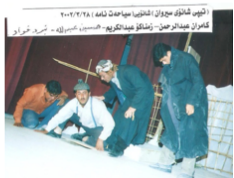
شانۆی سیاحه‌ت نامه - ۲۰۰۲