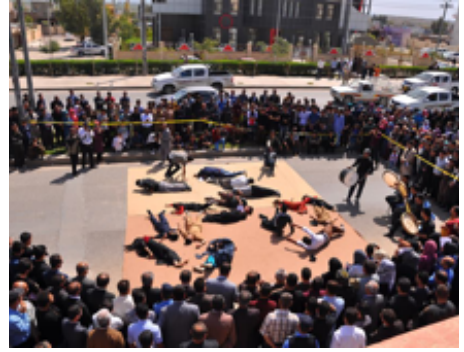
شانۆگه‌ری درۆی ئەم ده‌قه‌ره - ٢٠١٥