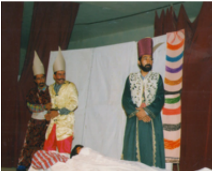
شانۆی کراسی پیاویکی به‌خته‌وه‌ر ۲۰۰۰