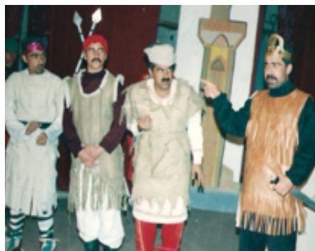
شانۆگەری بەرەو خۆر - ۲۰۰۱