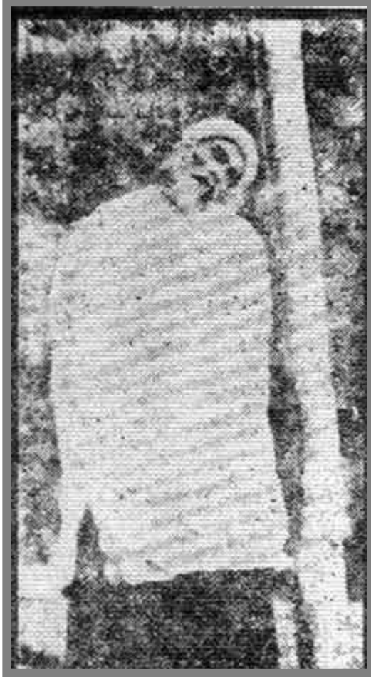
Şeyh Said Darağacında