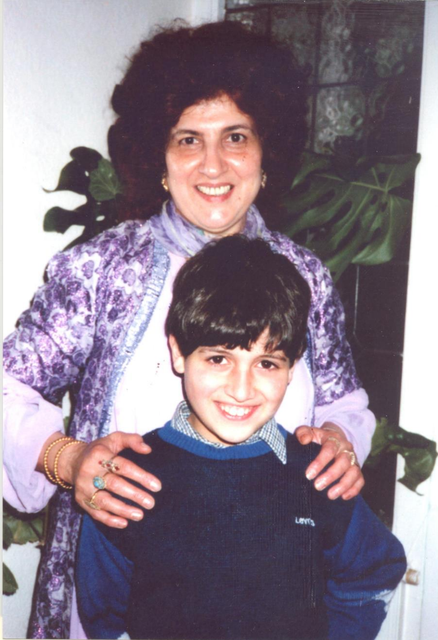
لهندهن ۱۹۸۳/ گه لایوئز، قوباد