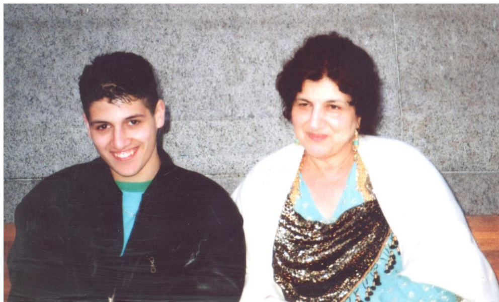
له‌ندهن، نه‌ورۆزی ۱۹۸۸ / گه‌لاویژ، قوباد