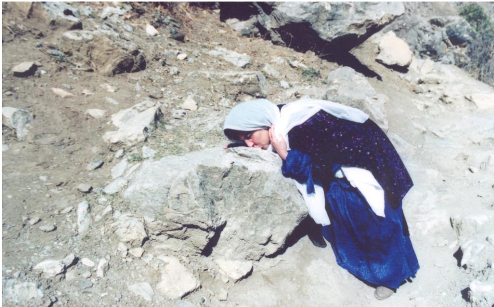
کوردستانی باشوور ۱۹۹۰/۱۱/۱۷ گەلاویژ لەکاتی گەیشتنەرە ی بۆ کوردستان