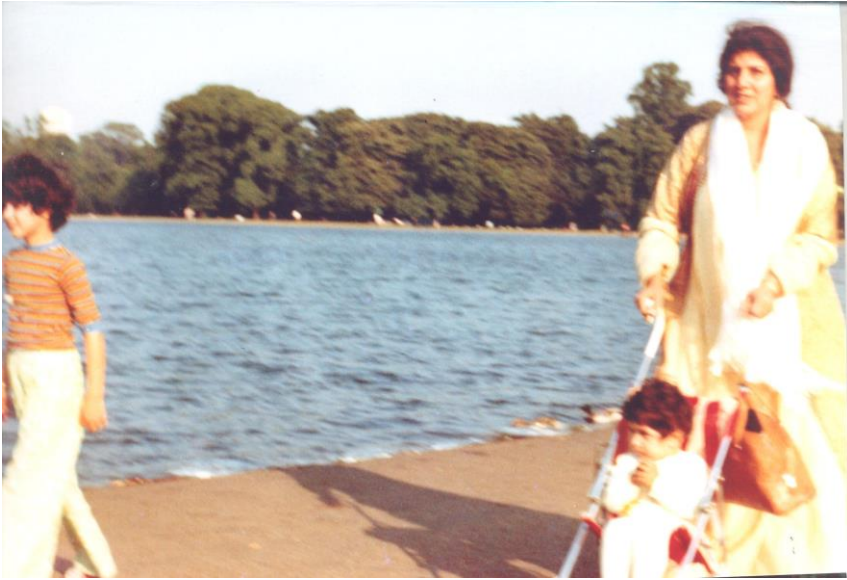
له‌ندهن ۱۹۷۰/۶/۱۱ هایدپارک/ گه‌لاویژ، هاوری، کوردی