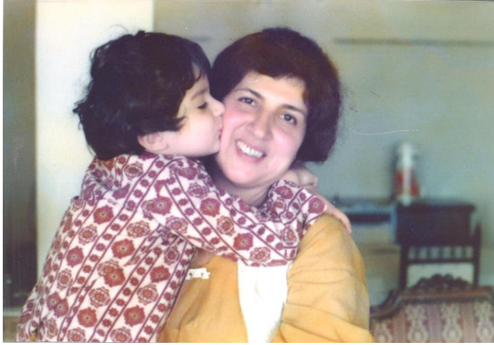
به بیروت ۱۹۷۷ / گه لاویژ، بافل مام جه لال