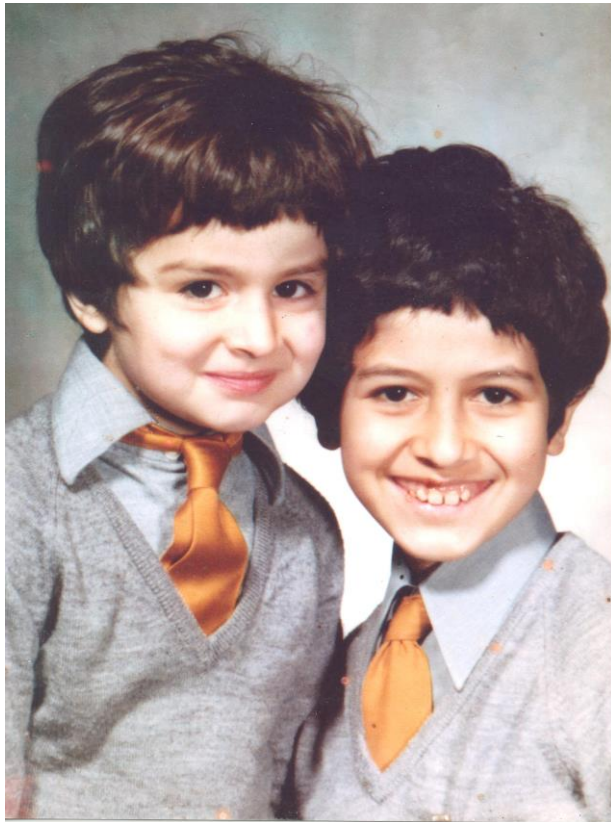
له ندهن - قوتابخانه‌ی بندن هل ۱۹۷۷/۷/۱۰ هاوری، بافل