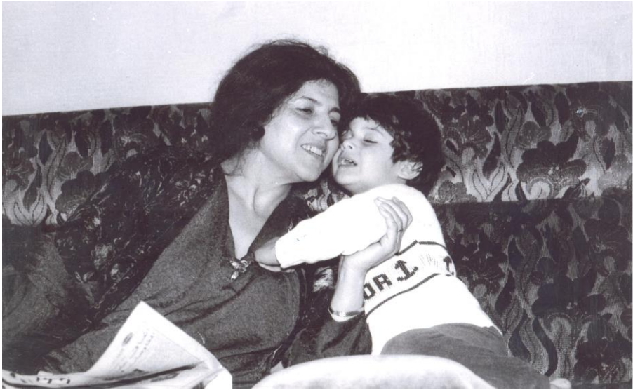
لهنده، ۱۹۸۱ / بۆتە، مایه لهنده، گه لاهه قه ناد