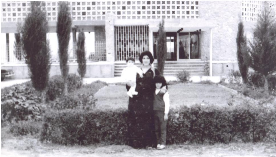
کوت ۱۹۶۸ / گه لاویژ، هاوری، کوردی