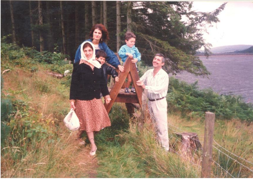
کاردینف / ئەو رۆژەى شیعری (چوونە سەیران) م نووسی