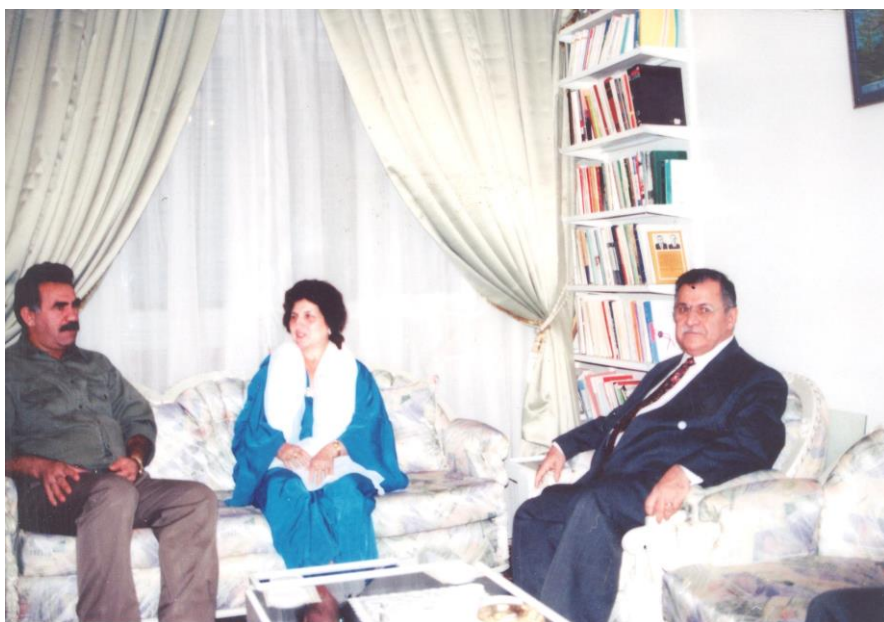
سوریا ١٩٩٢ / مام جەلال، گەلاوێژ، عەبدوڵلا ئۆجەلان