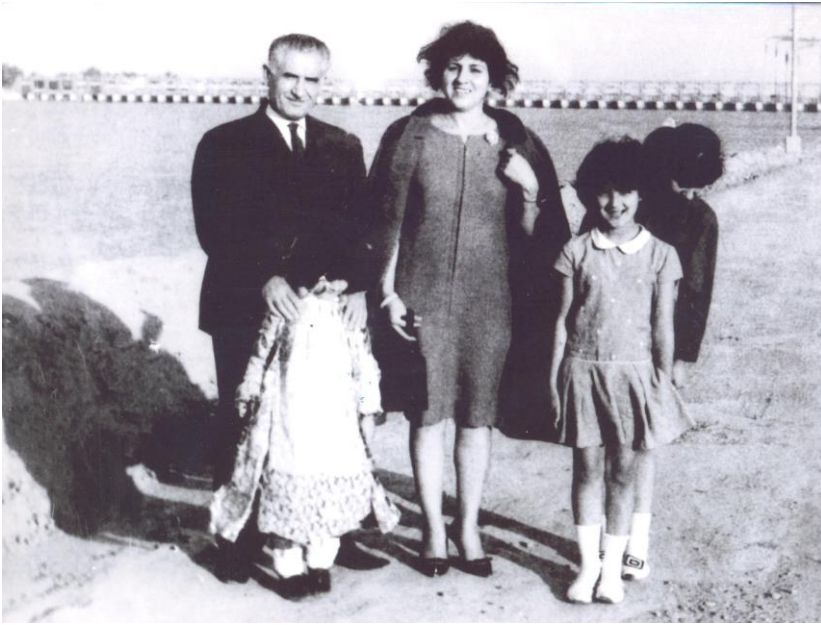
کوت ۱۹۶۷ / ههتاو، هه یقی، کوردی، گه لاویژ، نیبراهیم نه جمهد