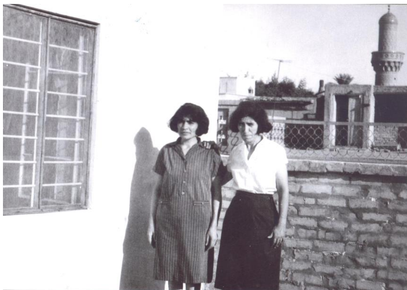
به‌غدا / باجی نه‌عیمه‌ی هاوسه‌ری خاله‌هه‌مزه‌ عه‌بدوئلا و داده‌ مینای کچیان