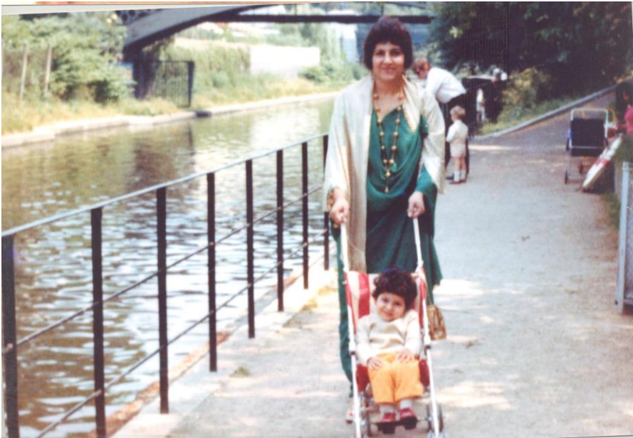
له‌ندهن — باخچه‌ی ناژه‌لان ۱۹۷۰/۶/۲۱ — گه‌لاویژ، هاوری