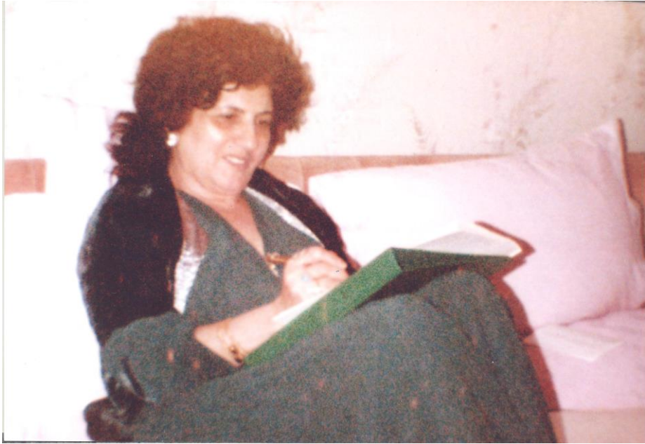
لەندەن (مالتی خۆمان) ۱۹۸۷/۱/۳ - گەلاویژ لەسەر چیڭگاکە ی خەریکی رۆمان نووسینە.