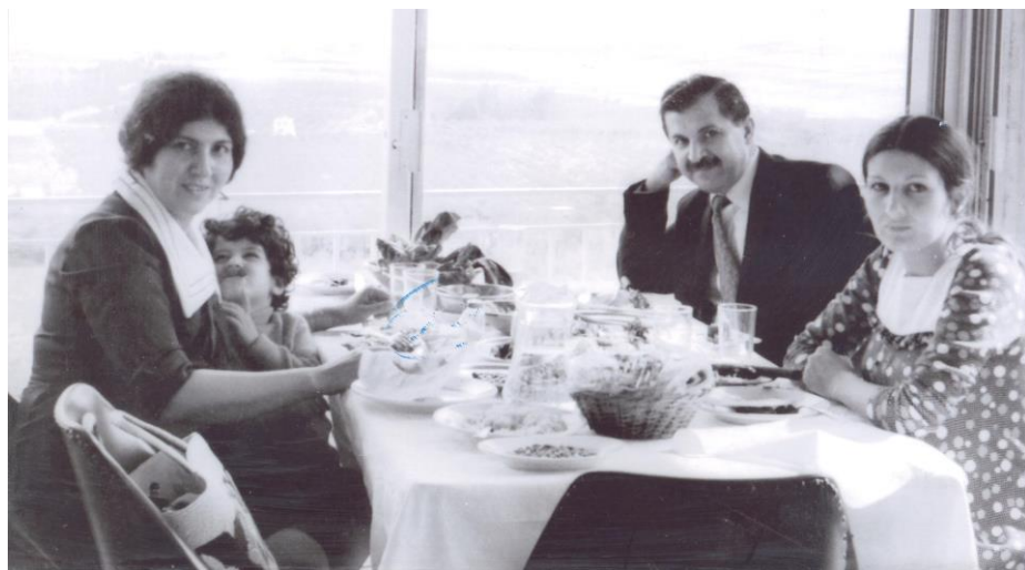
لوبنان ۱۹۷۳ / هیرو، مام جهلال، گهلاویژ، هاوری