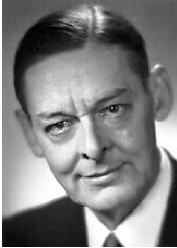
تى. ئيس. ئيليوت