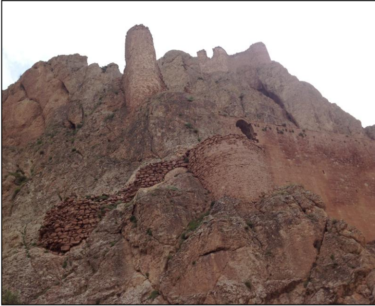
کهلا بایهزیدی یا کهفن