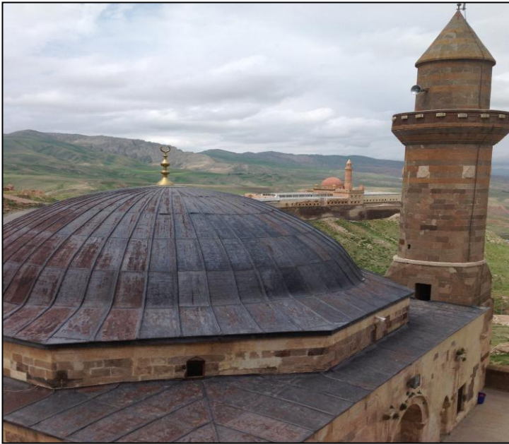
مزگفت و مهدرهسا خانی ل بنی کهلا بایهزیدی و سهرایا ئیسحاق پاشایی ل پشت دیار دکهت