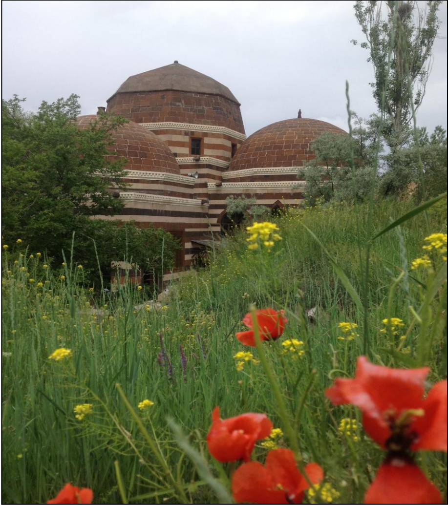
مہزاری نئہ حمہ دی خانہ ل بایہ زیدی