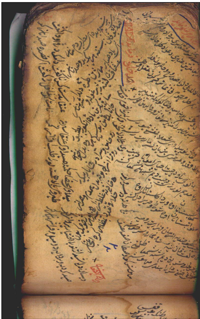
دهستقیسا ئیبراهیمی بیسکی