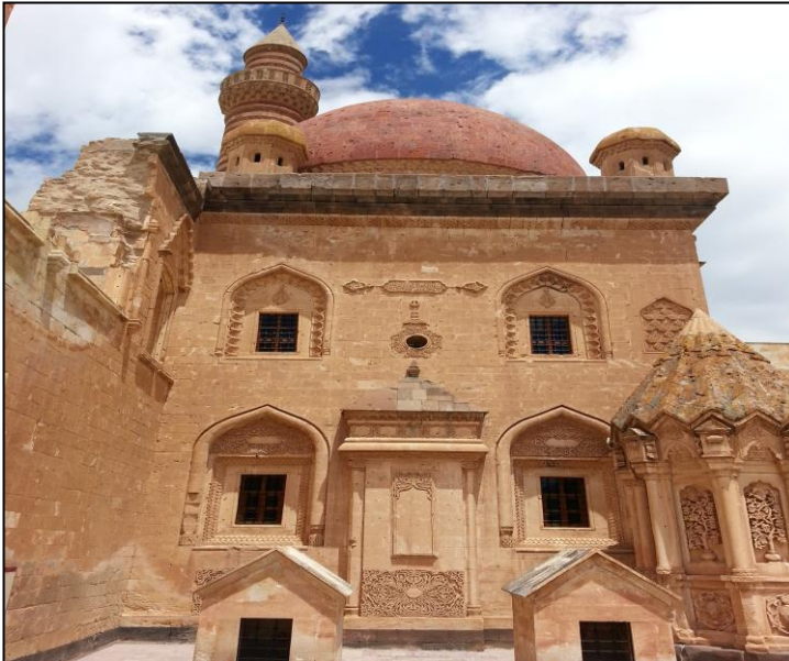
سهرایا ئیسحاق پاشایی ل بایهزیدی