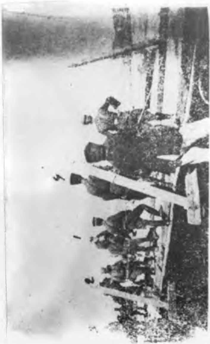
-Şeyh Said, yakalandıktan sonra, (1) işaretli.