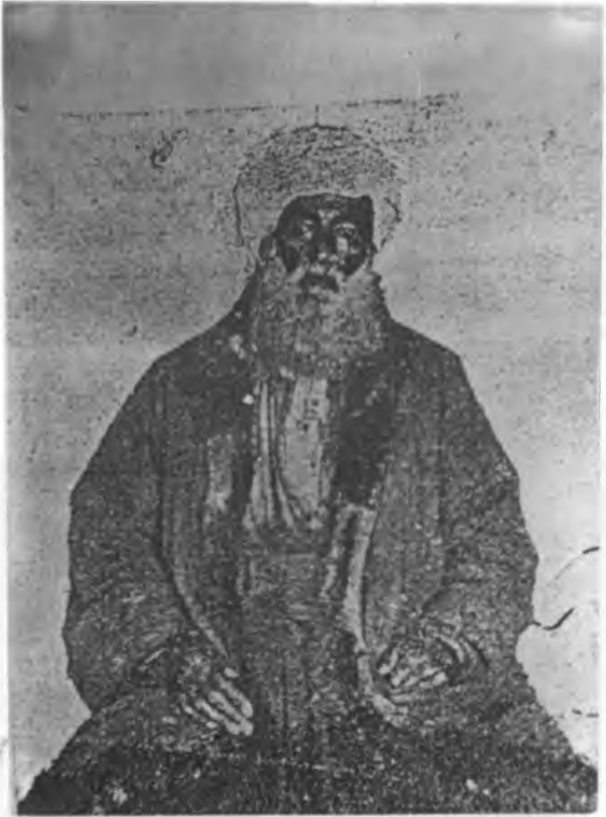
- Şeyh Said, tutuklandıktan sonra Diyarbakır Hapishanesi'nde.