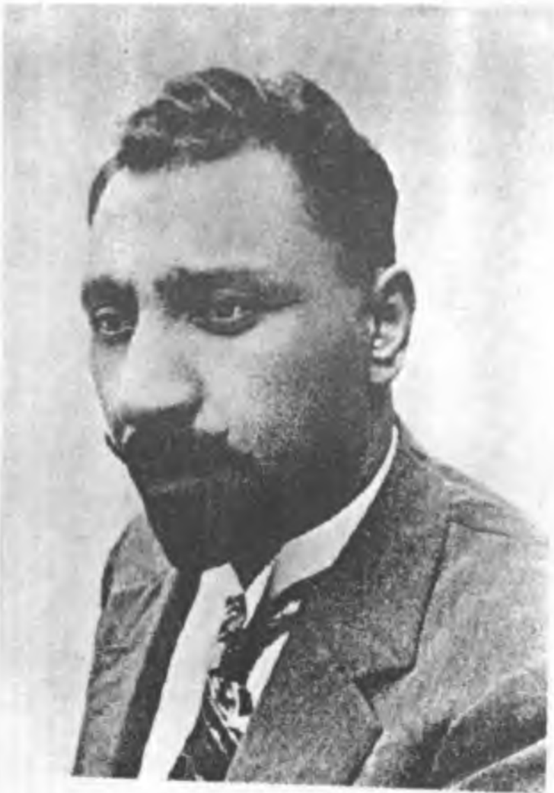
- Krt ulusal hareketinde ve kltrel geliřmesinde nemli bir konumu bulunan Celadet Bedirxan.