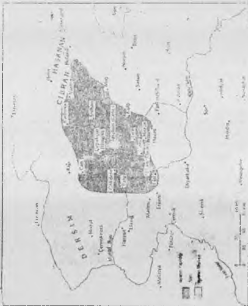
Harita 1. Şeyh Said İsyanı'nın Merkezi ve Yayıldığı Alan.