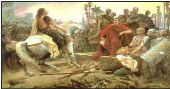
دەرەبەگایەتی ئە ئەوروپا