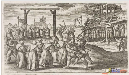
ئەشکەنجە و نازاردان ئە سەدەکانی ناوەرستدا