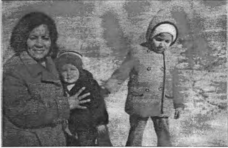
العائلة وسط ثلوج صلاح الدين و«سهري رهش» عام ١٩٨٠