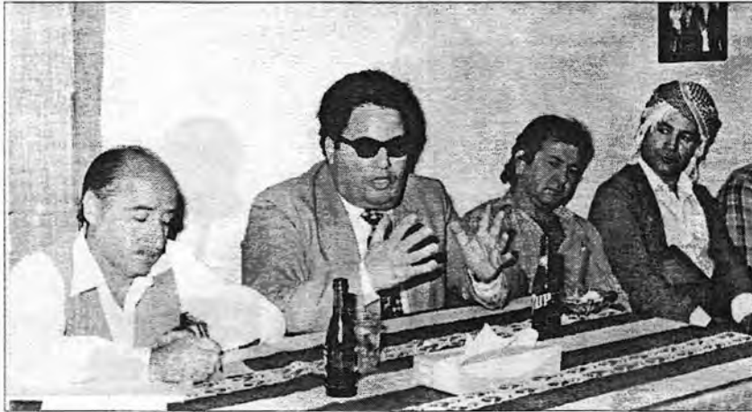
قاعة الثقافة الجماهيرية في اربيل، محاضرة حول السينما - ١٩٨٤/٤/١٥