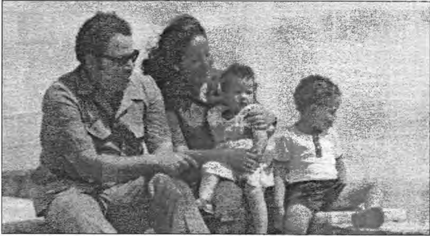
في مصيف (سهري رهش) مع العائلة ١٩٨١