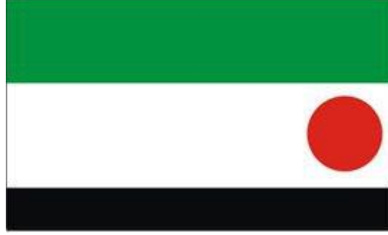
Refahiye Hükümet Konağına Asılan Kürt Bayrağı