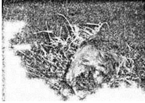
ALİŞER'in Kesik başı

Nazmi Sevgen'in bahsettiği mektuplar ve belgeler bu mağaradan alınmıştır.