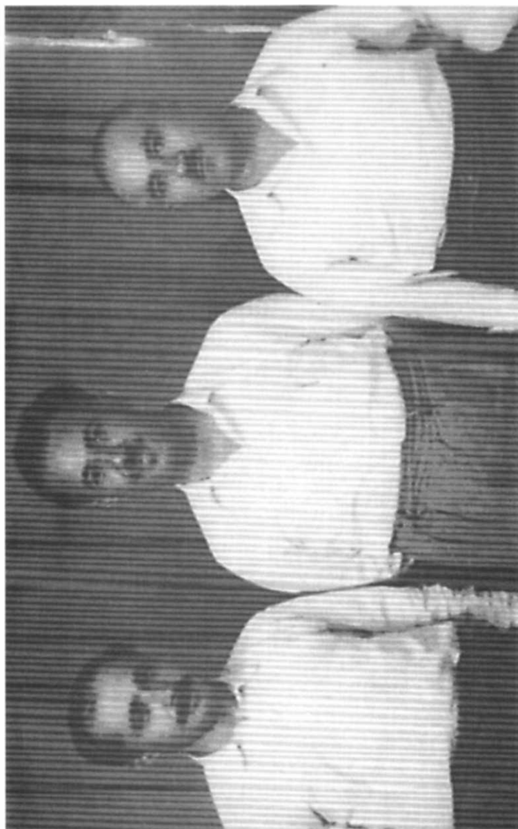
محمد سعید قزلباشی، نوروزی محمد سعید ته ها ، زهیبی