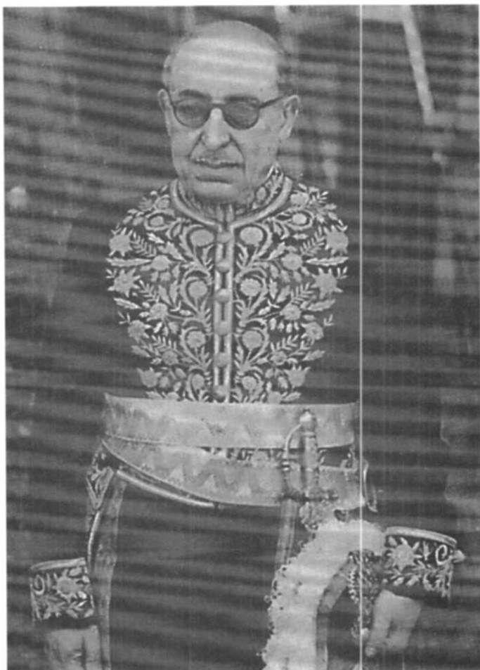
قوام السلطنه سرۆك وهزیرانی ئیران