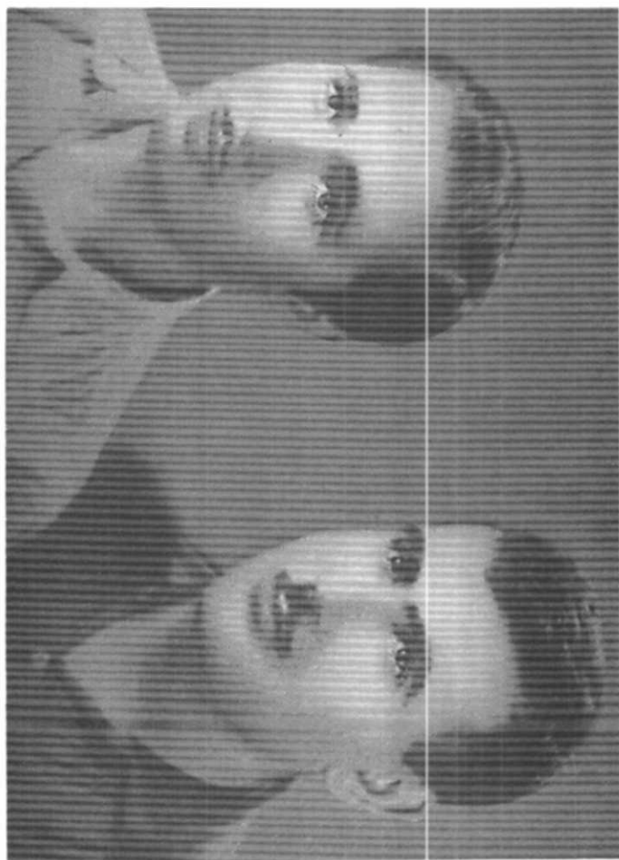
هه ژار و زه بیجی - سه رده می کومه له ی ژک کاتی ده رکردنی گوژاری نیشتمان - ته ورتیز