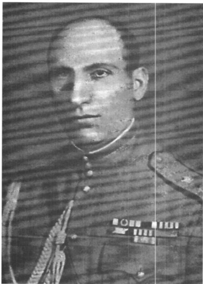
سەرله شکر هومايونی

سین رۆژ نان و نمه کی قازی خوارد و نمه ک به جهرام ده رچوو