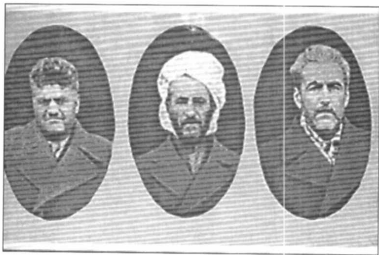
سه یقی قازی