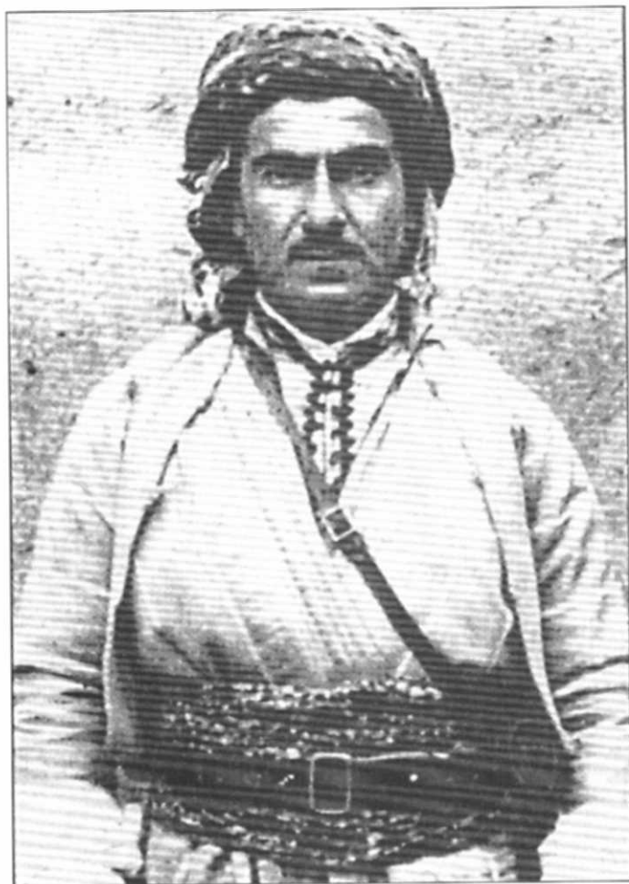
مهلا مستهفا بارزانی