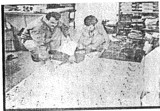
ئاماده‌کردني به‌رگي گۆفاري گزنگ