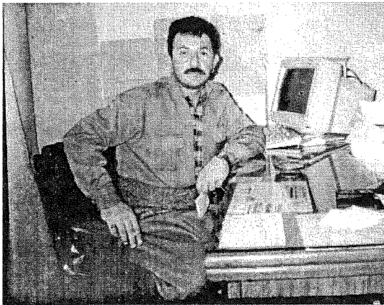
سال‌ح‌ مه‌حم‌وود‌ به‌ری‌وه‌به‌ری‌ رادی‌وی‌ پیش‌که‌وت‌ن‌ سال‌ی‌ ۲۰۰۰