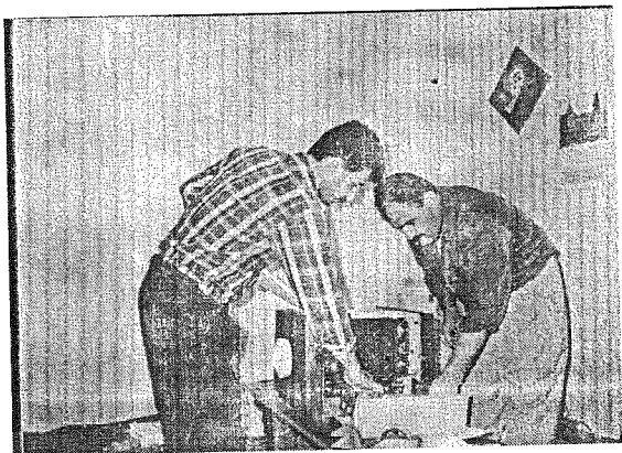
نووسەر لهگهڵ هه‌فاله‌ ده‌هام چاوشين له کاتي چاپکردني گۆفاري گزنگ به‌ رۆنيو