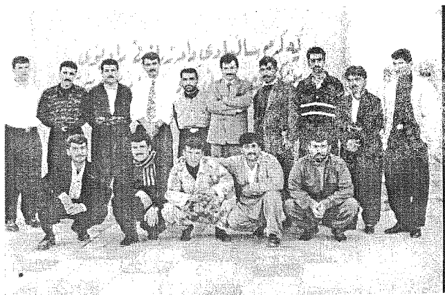
يهكهم ساليادي دامهزاندني راديوي پيشكهوتن