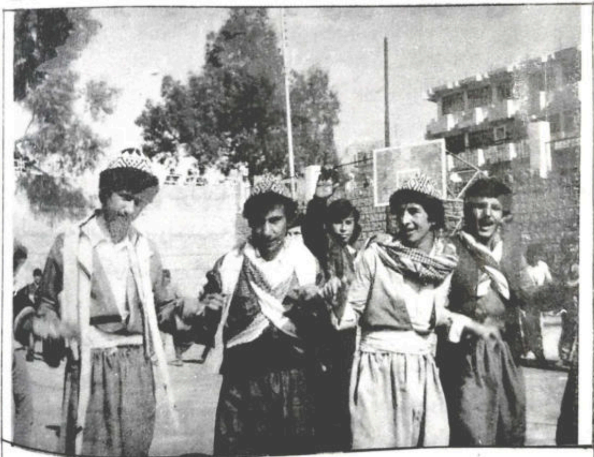
داوه تا میرانی سنیلید دهوکی دله قینا

شهر چو لای به غدای میر مه کوژه سوله یمانو شهر چو لای به غدای میر مه کوژه سوله یمانو سوله یمان کورپی مه تی میر مه کوژه سوله یمانو سوله یمان کورپی مه تی میر مه کوژه سوله یمانو چه کا بینه ل خیفه تی میر مه کوژه سوله یمانو چه کا بینه ل خیفه تی میر مه کوژه سوله یمانو دی خورتین کهن داوه تی میر مه کوژه سوله یمانو دی خورتین کهن داوه تی میر مه کوژه سوله یمانو مه شهره ل گهل دهوله تی میر مه کوژه سوله یمانو مه شهره ل گهل دهوله تی میر مه کوژه سوله یمانو