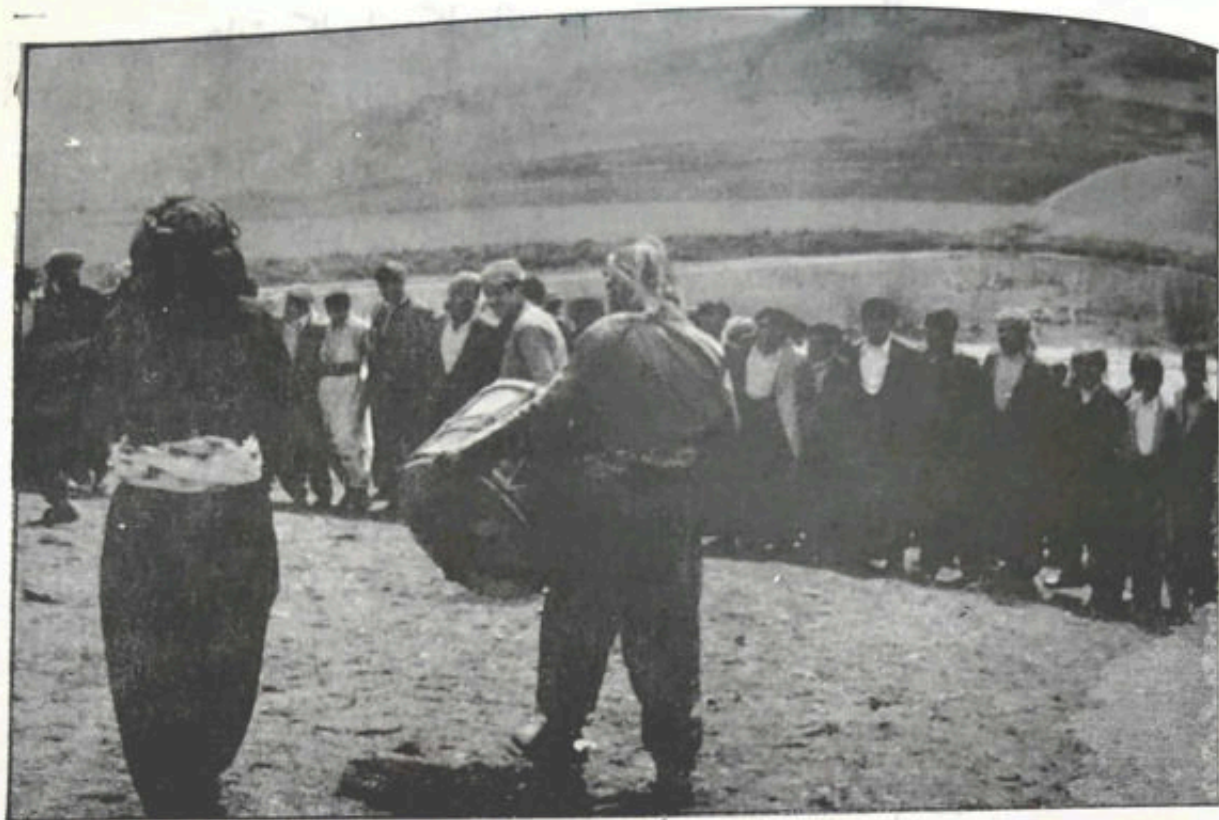
داوہتا ملانی لاوید سوران گمرا دیلانی دشارین

یلمبو رامویسانا ناہیلم زالم پرو رامویسانا ناہیلم یلمبو ہات کاروانہ کاروانہ زالم پرو ہات کاروانہ کاروانہ یلمبو دانابو ل بہر بنیانه زالم پرو دانابو ل بہر بنیانه یلمبو عہیشی و فاطمی حہللاندم زالم پرو *عہیشی و فاطمی حہللاندم یلمبو کرمہ قولپا مہمکانہ زالم پرو کرمہ قولپا مہمکانہ