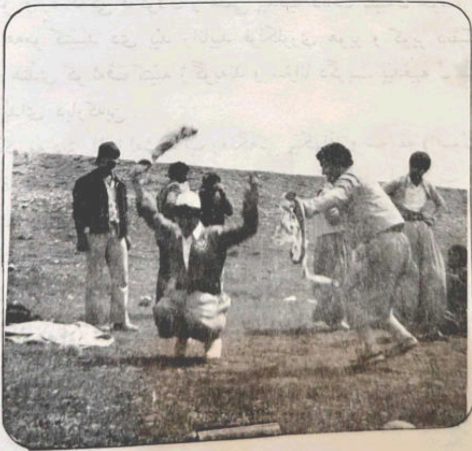
له یزا جوئوئه