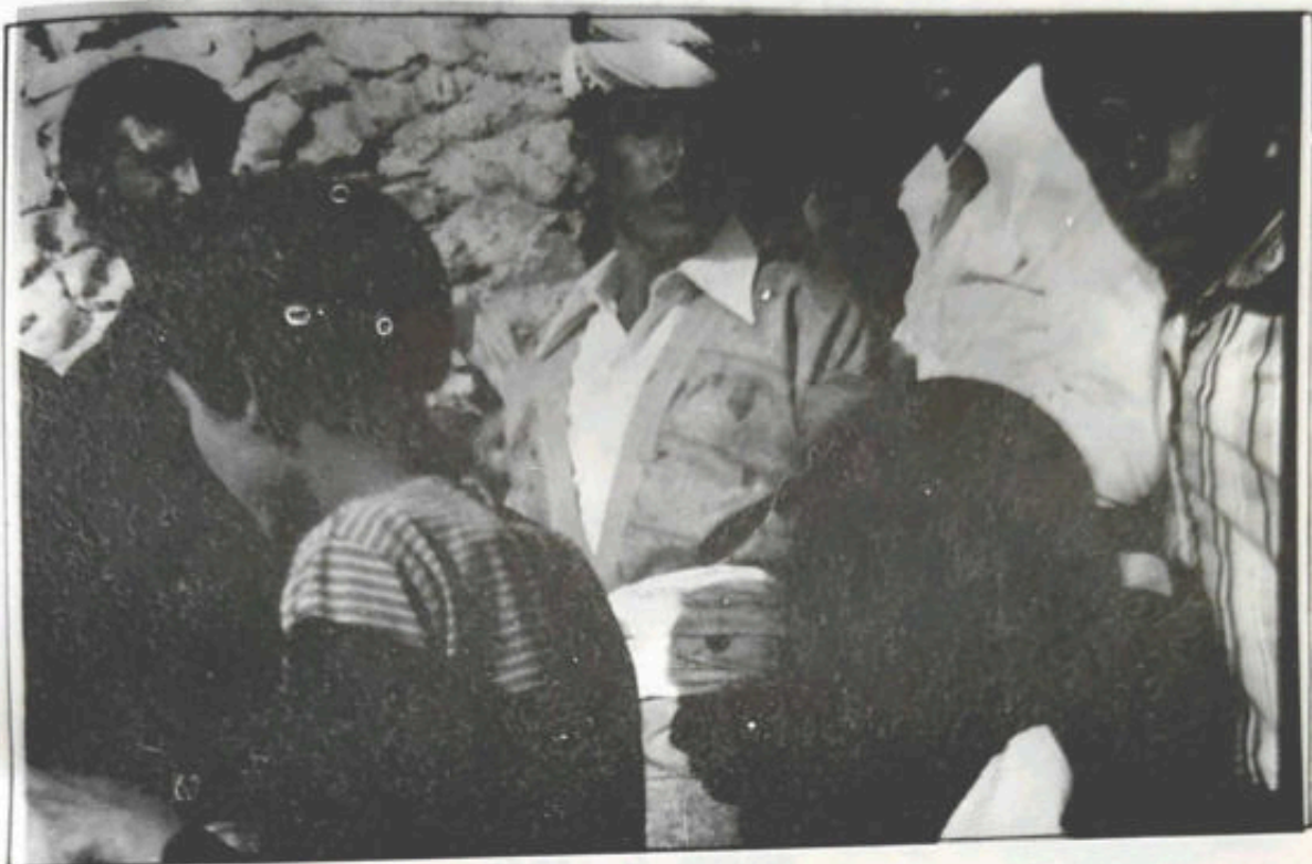
رالای جمح ب شعل و شهکیند نوی یند شین لانی بویکی به همفال و هوگر و براززالا ل رهخ راوهستیابه