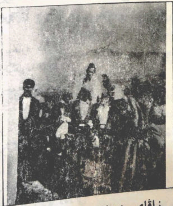
زاقای دبه نه سه رشونی