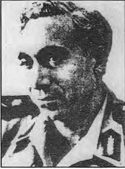
اللواء أمين الحافظ