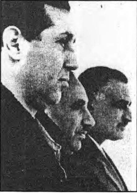
جمال عبدالناصر وعبدالسلام محمد عارف وأحمد بن بلآ