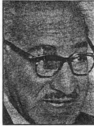
رشيد عالي الكيلاني