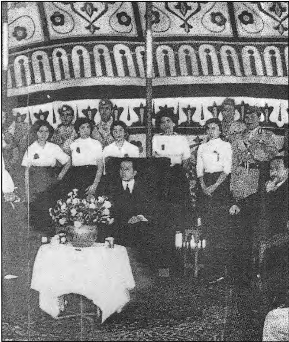
صورة تاريخية. ربما كانت آخر صورة تجمع بين الأربعة الكبار الذين قتلوا يوم ثورة الرابع عشر من تموز. أخذها مصور مجلة ناشنال جيوغرافيك National Geographic Magazine السيد روبرتس في ٢٦ من نيسان ١٩٥٨ بمناسبة افتتاح أسبوع الإعمار العراقي.