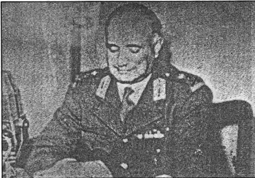
نورالدين محمود يعلن من الإذاعة في ٢٣ تشرين الثاني ١٩٥٢ تكليفه من قبل الوصي بتشكيل الحكومة ويتعهد بإعادة الأمن والاستقرار إلى البلاد