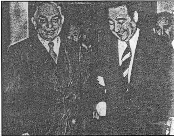
نوري السعيد وعدنان مندريس