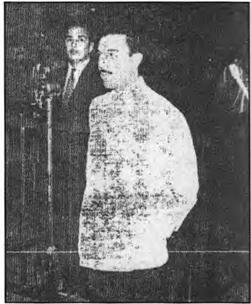
اللواء علي أبو نوار