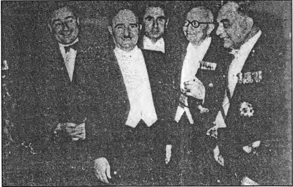
الوفدان العراقي والتركي في حفل بالسفارة التركية في بغداد بعد التوقيع على الاتفاق الثنائي