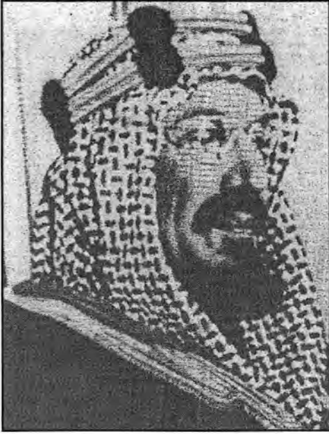
الملك عبدالعزيز آل سعود