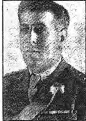
صلاح الدين الصباغ