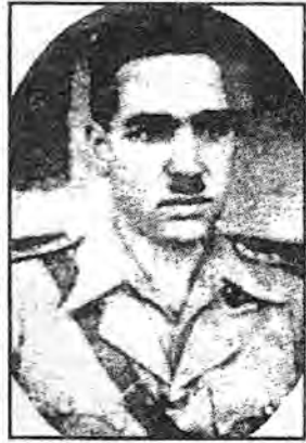
العقيد كامل شبيب