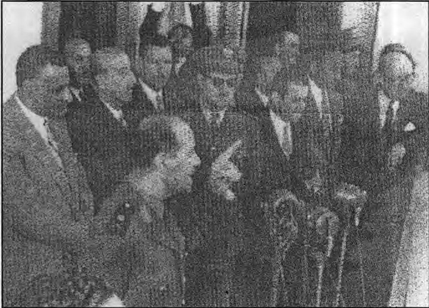
على شرفة قصر الضيافة أثناء احتفالات الوحدة ويظهر في الصورة صبري العسلي وعبدالناصر وعفيف البزرة وعبدالحميد السراج