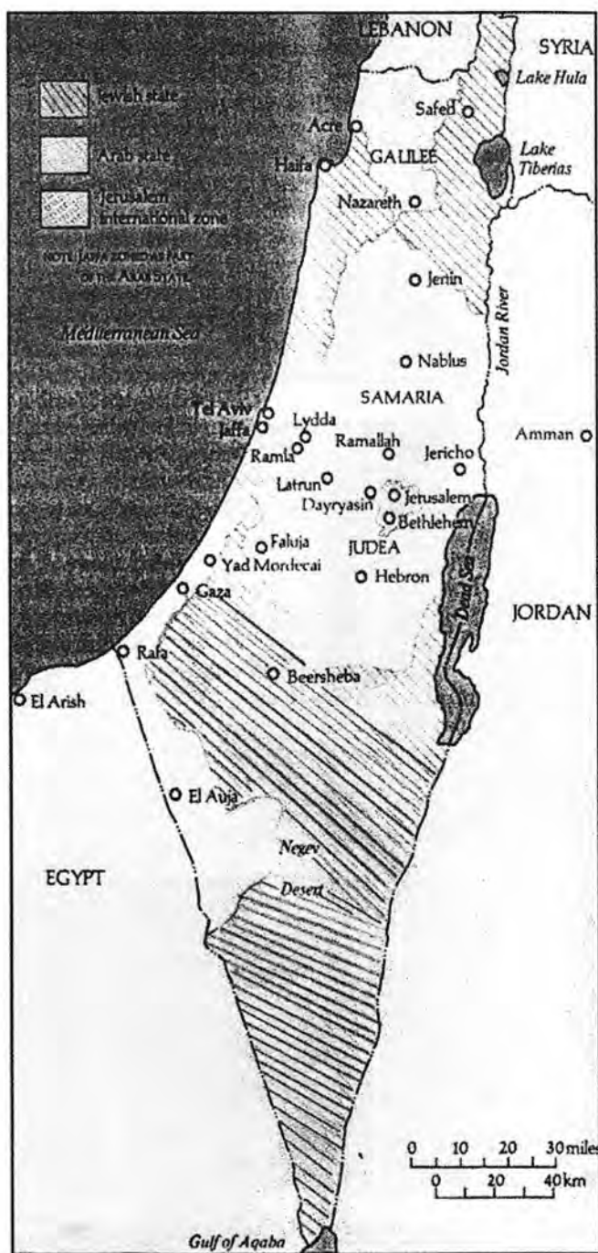
خطة الأمم المتحدة للعام ١٩٤٧ لتقسيم فلسطين