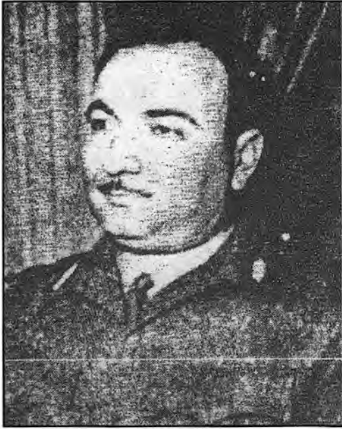
زياد الحريري قائد انقلاب ٨ آذار ١٩٦٣ في سورية