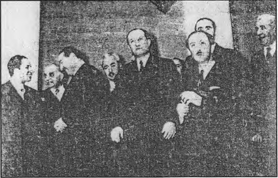
فيصل الثاني يتجاذب أطراف الحديث مع عدنان مندريس رئيس الحكومة التركية وبينهما نوري السعيد. ويقف خلف الملك أرشد العمري. وإلى أقصى يمين الصورة يقف عبدالإله - عقب الاتفاق التركي العراقي (١٩٥٥)