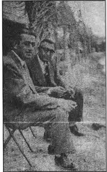
صلاح البيطار وأكرم الحوراني على ضفاف الفرات