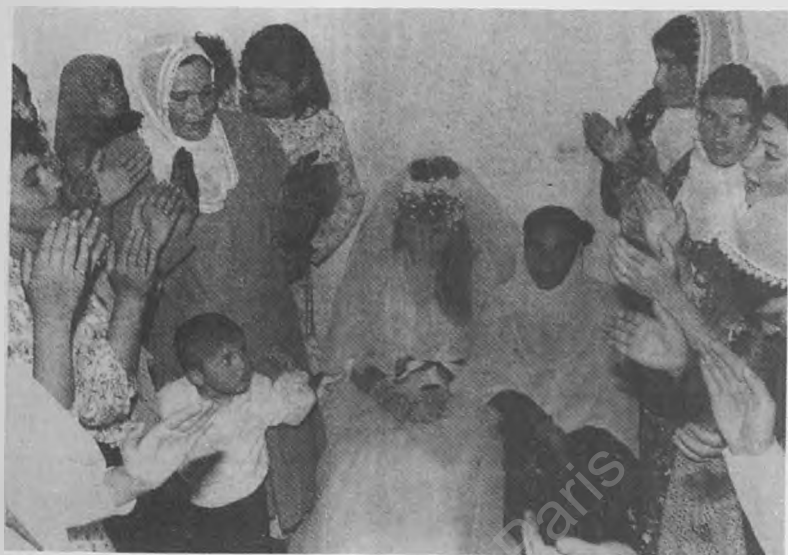
Berbûkî dixwazin bûkê biguhêzin.

Jiyana serfiraziyê ye. Li hinek herêman davêjin ser serçavê wê û çarşeveke sor lê dikin. Wê li nav malê didin ser kursiyekî. Çend berbûkî ango jinên aliyê zavê dikevin destên hevdu. Li hember rêza wan çend jinên aliyê bûkê jî dikevin destên hevdu û rêzeke din çêdikin. Yên aliyê zavê dest bi strana " De bidine me bûkîna me " dikin. Yên aliyê bûkê jî bi stranê bersiva wan didin: " Em nadine we bûka we. " Stran weha ye: