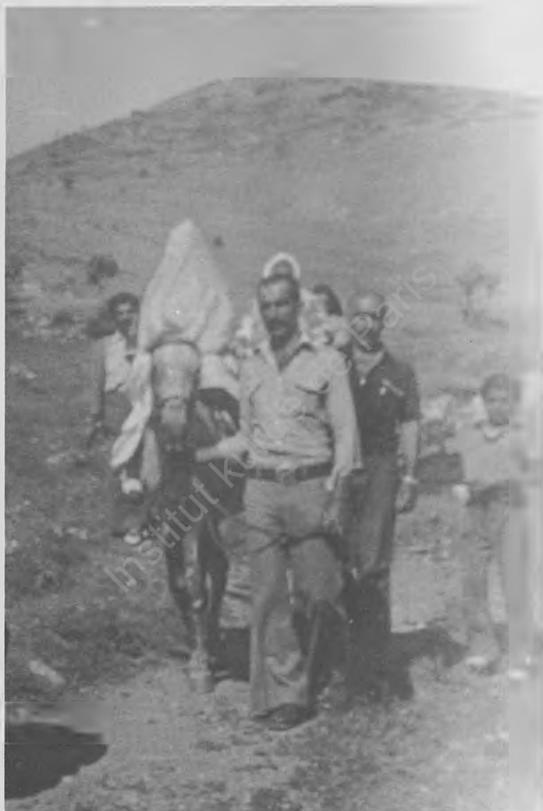
Xwendî û berbûkî, bûkê ji gundek dibin gundekî. Pavan bûkê diparêzin