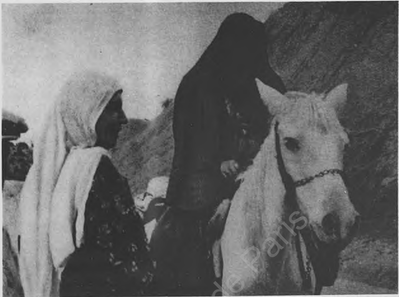
Dayik keça xwe dibe zeyî.

destê xezûr û xesûya xwe û paşê diçe destê yên din ku li wir hazîr in. Hingê zava gelek şerm dike, ew û birazava li dawîya odê, nêzî darê solan rûdînin.