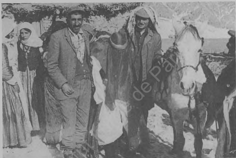
Bûk li hespê siwar nabe û diyarîya xwe dixwaze.

sozê xelatê didîn bûkê û ew jî dev ji rîka xwe berdide û wê li hespê dîkin. Ji mirovên zavê yek jî aliyê rastê û yek jî, jî aliyê çepê ve, bi bûkê digirin û yek jî bi hevsarê hespê wê digire û dikişîne. Ev her sê kes heta bûkê bixîndir, parezgehên bûkê ne. Bûk, di nav berbûkî û xwendiyên de, wekî gula sor jî dûr ve xuya dike.