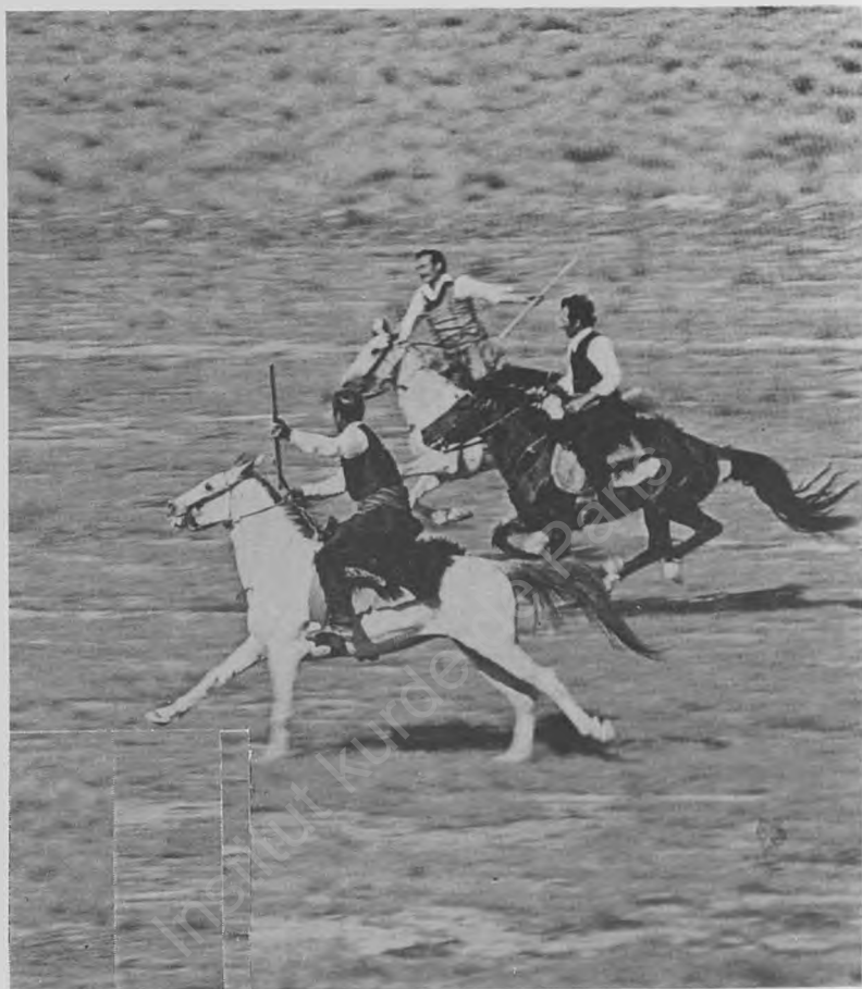
Li Kurdistanana Bakur sê cirûvan pêşbirikê dikin.

din jî didin dûv. Beza hespan heta gund dom dike. Siwariyên jêhatî li ser pişta hespê hereketên akrobîk dikin. Xwe di bin sing û stuyê hespê de dizivînin. Ji ser pişta hespê xwe davêjin erdê û li ser lingan radiwestin... Di dema bûkanînê de jî, xwendî hespan wilo dibezînin û kumên hevdu direvînin.