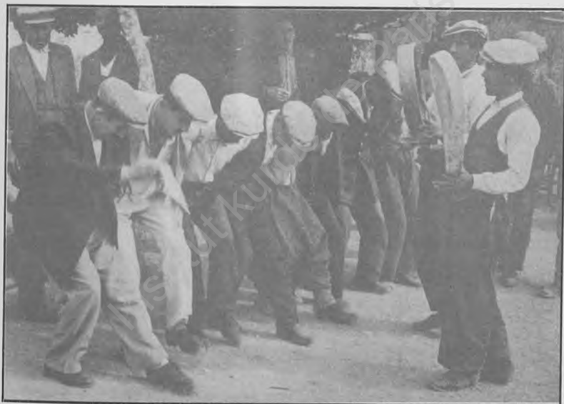
Li Xerzan dawetek

govengêr re. çengçî jî dibêjin - derdikevin mey dana hemberiyê. Hemberiya ka kî bêtir xweş govendê digre û digêrine. Kesên govendgêr û koçek, yeko yeko li ber defê diçin û tèn. govendgêr bi dor cihên xwe diguhrînin. Ji serê govendê diçin dawî û ji dawî diçin serî. Ji serî heta lingan xwe wekî tûra nav avê dilerizin û direqîsin. Jin û mêr li der - dora wan rêz dibin. Ji wan re çepik lê dixin. Bi saetan govend weha dom dike. Xweydan di ber lingên wan re davêje û ji eniya wan diniqute. Bi destmalan xwêdana xwe paqij dikin.