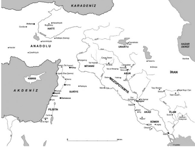
Eski Mezopotamya’ya ait bir harita

etmiştir. Bu nedenlerden dolayı, köklere inmekten ziyade mevcut durumu ve bazı tarihî gerçekleri ifade etmek daha doğru olacaktır. Bunun için de Kürtlerin İslâmiyet’i kabulü