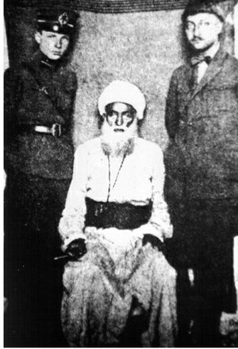
Zaza asıllı âlim Şeyh Said (1866-1925)

buradan ayrılan Şeyh Said, ailesiyle birlikte Diyarbakır'ın Piran (daha sonra ismi Dicle olarak değiştirildi) ilçesine yerleşti. Şeyh Said, Kurtuluş Savaşı bitince de Hınıs'a geri dönmüştür.