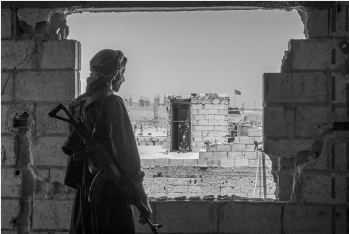
Kobanê 2017: Heval Renaz, Verantwortlicher für das Widerstandsmuseum, blickt auf die nahe türkische Grenze.