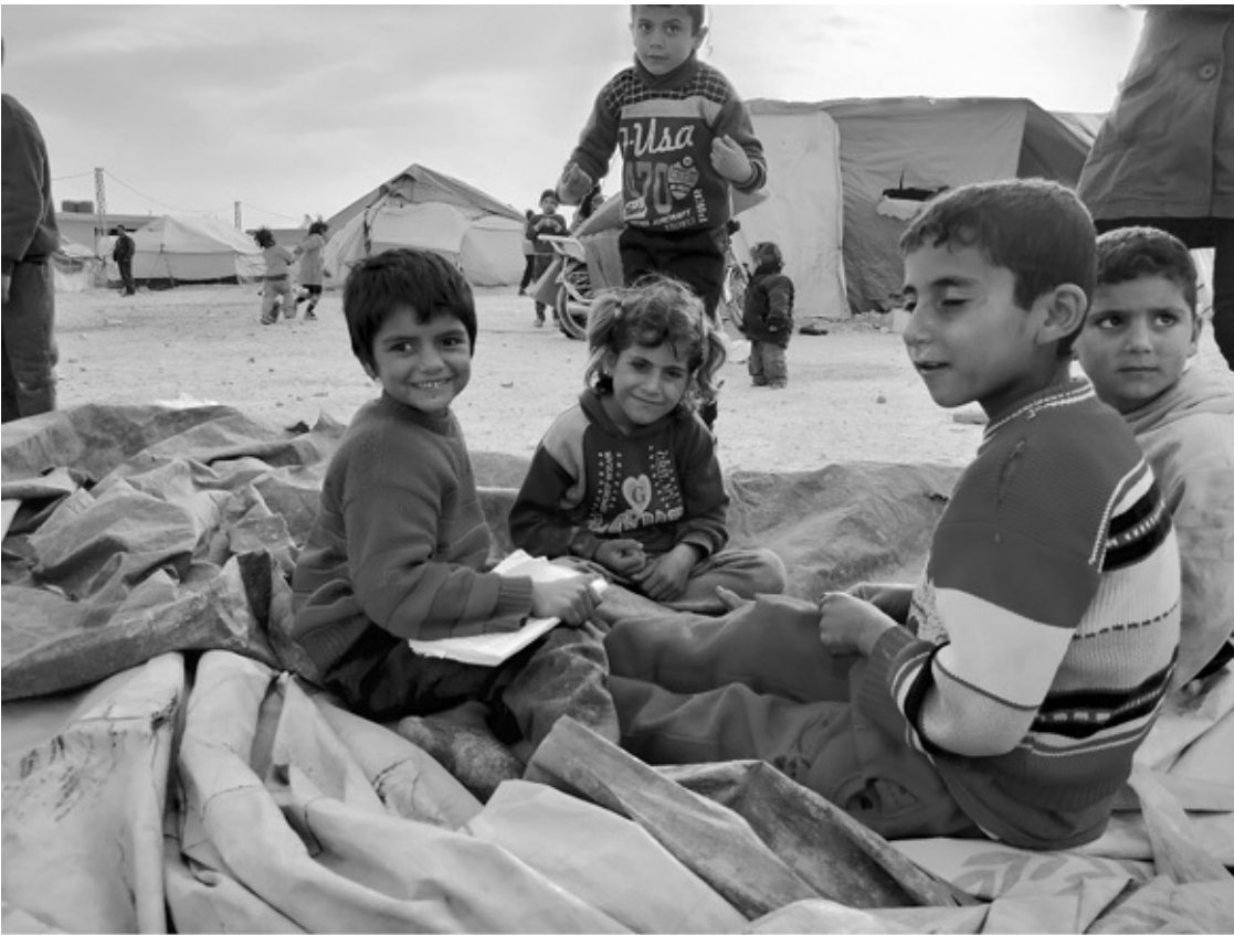
Nördlich von Raqqa, 2018: Flüchtlingslager Ain Issa