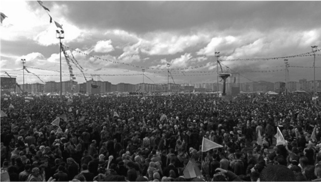
Diyarbakir 2015: Newroz-Feier.