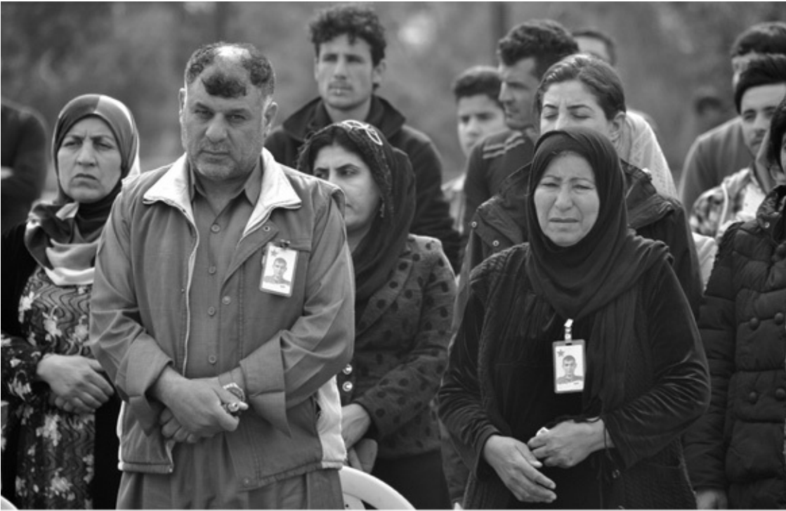
Tuz Churmatu, Südkurdistan, 2017: Vater und Mutter trauern um ihren gefallenen Sohn, der in Nordsyrien gegen den IS gekämpft hat