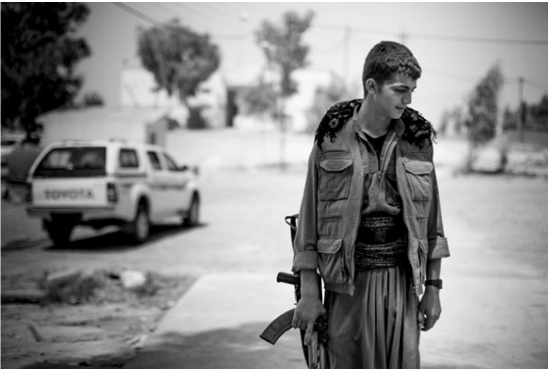
Machmur, Südkurdistan, 2014: Kämpfer der PKK