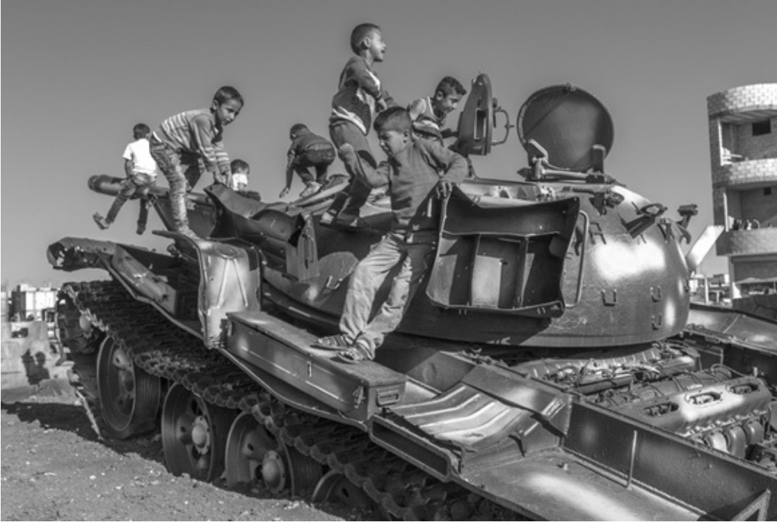
Kobanê 2017: Kinder auf einem IS-Panzer, der zu einem Denkmal im Stadtzentrum gehört.

Stadt und zum Teil schon mittendrin. In Suruç, nur ein paar Kilometer entfernt, aber schon in der Türkei, sind die schwarzen Flaggen genauso klar zu sehen wie der Rauch, der aus brennenden Häusern aufsteigt. 52