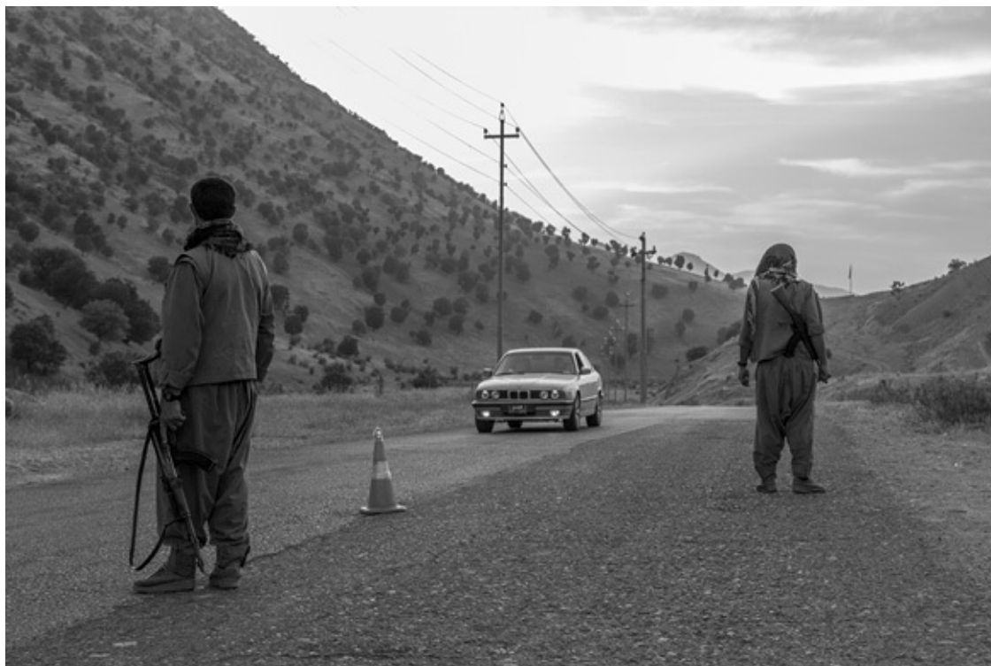
Kandil-Berge 2016: Straßenkontrolle durch Kämpfer der Volksverteidigungseinheiten (HPG).

Es braucht keinen Mythos, um zu verstehen, warum die Kurden bis heute anders sind als ihre Nachbarn, trotz all der Heerscharen und wandernden Völker, die ihre Spuren im Erbgut hinterlassen haben. Man muss nur diese Berge sehen und sich vorstellen, dort zu leben. Schon das Nachbartal unerhört fern, es sei denn, man steht auf tagelange Fußmärsche oder nimmt den elend langen Umweg über das Provinzzentrum. In den Bergen Kurdistans ist man für sich. In diesen Bergen braucht man keine Armee. Es dauert, bis eine neue Idee hierherkommt oder eine neue Technologie. Und wenn sich doch ein Reisender verirrt und nach dem Weg ins nächste Dorf fragt, dann zuckt man mit den Schultern und sagt: »Ich weiß nicht.« 9