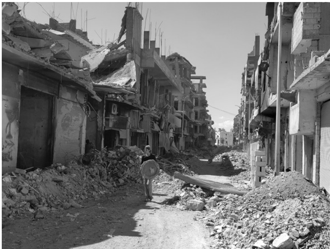
Raqqa im Frühjahr 2018

keinen Strom und kein Abwassersystem. In dem Haus, in dem ich untergekommen bin, kam alle paar Tage ein Tankwagen vorbei und hat Wasser auf das Dach gepumpt. Zum Duschen, für den Tee. Ich bin nachts angekommen und habe die brennenden Tonnen auf den Straßen gesehen. Es war kühl und die Menschen suchten Wärme. Der Wiederaufbau funktioniert aber erstaunlich gut. Man hört überall die Bagger oder einen Hammer. Man sieht Jugendgruppen, die politisch arbeiten. Ich war bei einem Jugendradio. Denge Ciwanan . Stimme der Jugend. Sie nennen das die »Stimme der Freiheit und Zukunft«. Sieben junge Leute, davon drei Frauen, die etwas versuchen. Wie überall in Nordsyrien.