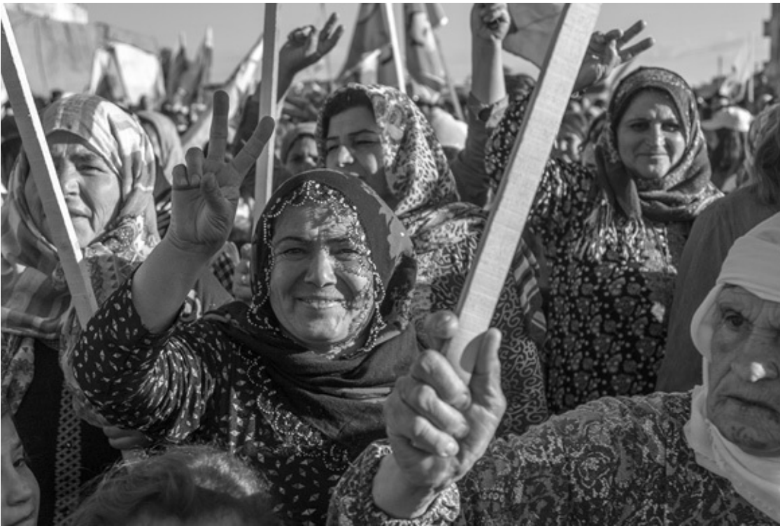
Kurdische Frauen in Rojava.