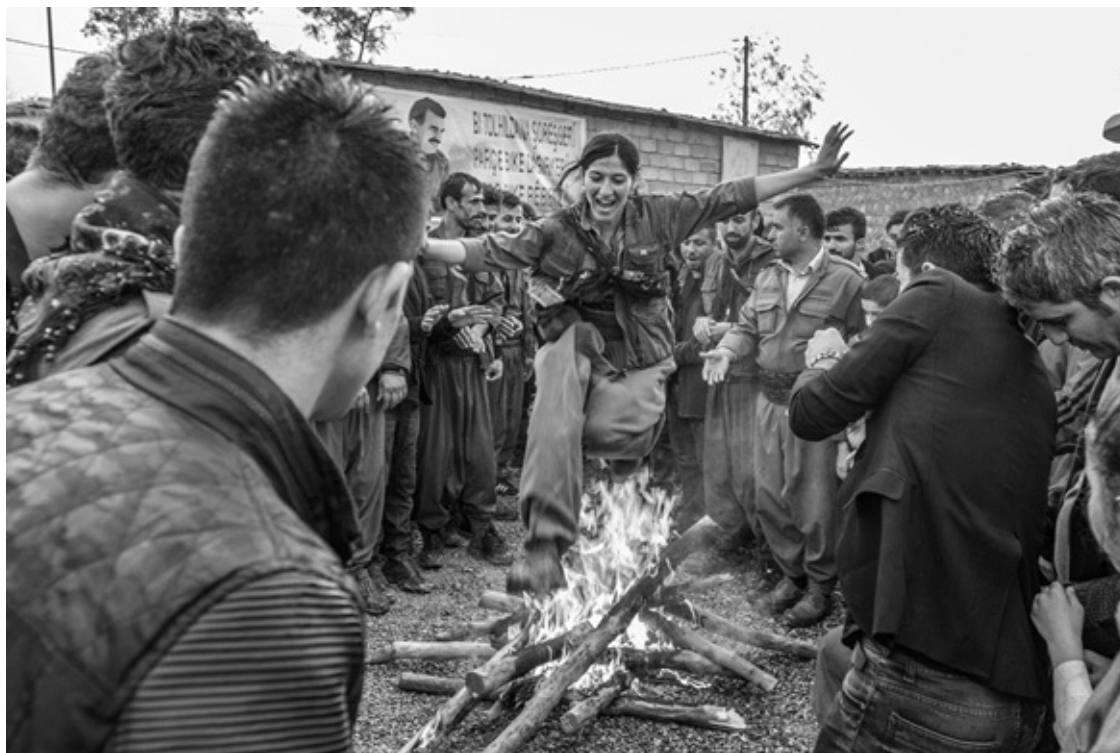
Machmur, Südkurdistan, 2017: Newroz-Feuer

Neugeborenes wählt bewusst die Nation, zu der es gehört. Nationen werden von oben geschaffen, sagt Eric Hobsbawm (von Staaten, von charismatischen Führern, von intellektuellen Eliten), müssen aber trotzdem von unten analysiert werden, weil sich die Hoffnungen, Interessen und Bedürfnisse der kleinen Leute mit ihnen verbinden. Wenn Sohak zur Universität gegangen wäre, dann hätte er wahrscheinlich eine Nation erfunden und kein Hirn fressen wollen. 4