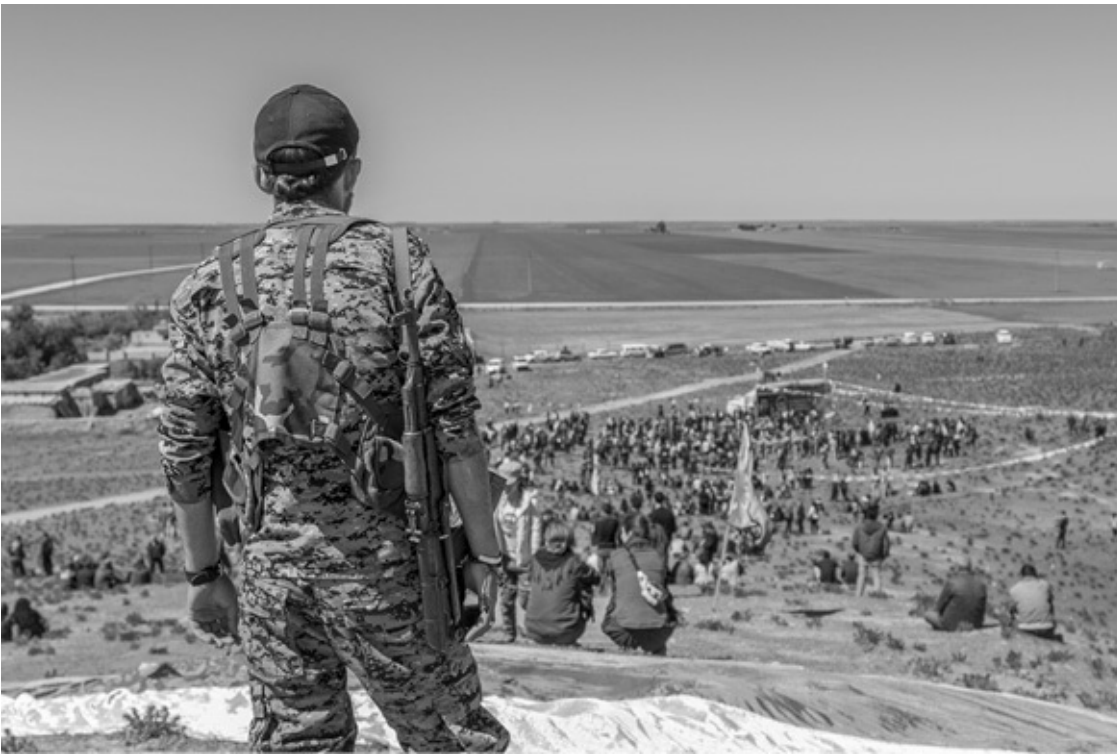
Amude, Rojava, 2017: Feierlichkeiten zum Geburtstag Abdullah Öcalans. Am Horizont: die hochmilitarisierte Grenze zur Türkei