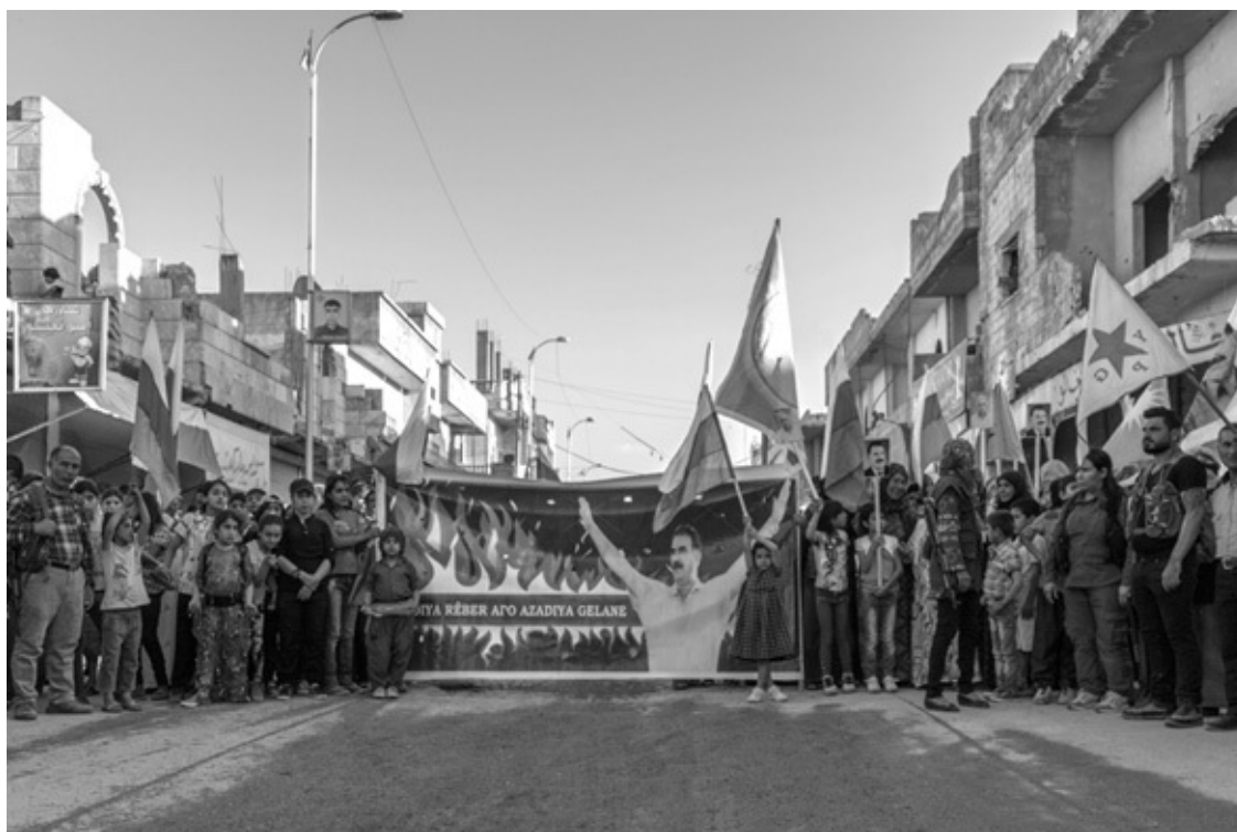
Kobanê 2017: Demonstration für die Freilassung von Abdullah Öcalan.