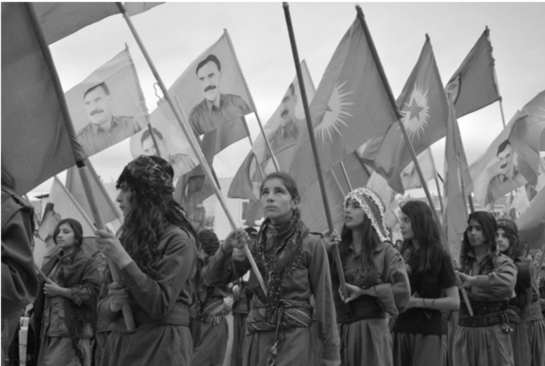
Mahmur, Südkurdistan, 2017: Newroz-Demonstration

lange geherrscht in der Region, die heute teilweise Iran heißt und teilweise Irak. Die »Herren von Asien«, schreibt Kardo Bokani. 2 Solche Vorfahren wünscht sich jeder. Nur: So ganz genau kann das niemand wissen. Was Archäologen finden, kann von diesem Stamm sein oder von jenem, und was später aufgeschrieben wurde, von Herodot zum Beispiel, könnte wie das Dinosaurier-Buch von Jonas gut und gern in der Reihe Das magische Baumhaus erscheinen, mit ein paar hübschen Bildern, versteht sich.