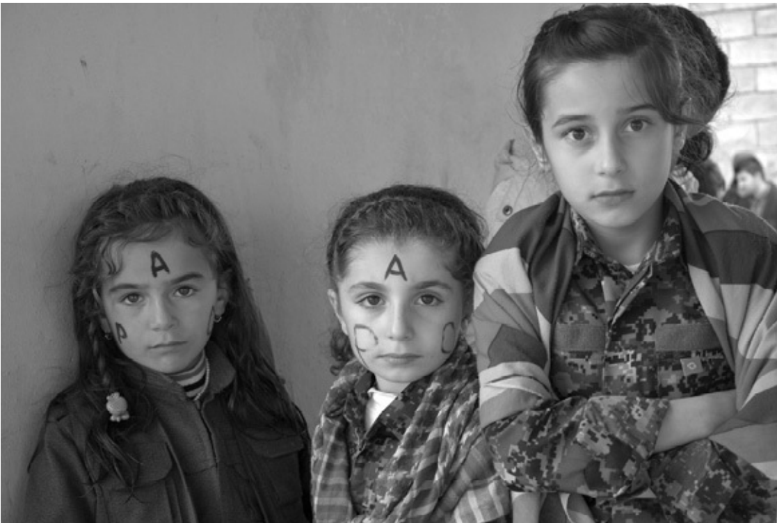
Machmur, Südkurdistan, 2017: »Apo« steht für Abdullah Öcalan