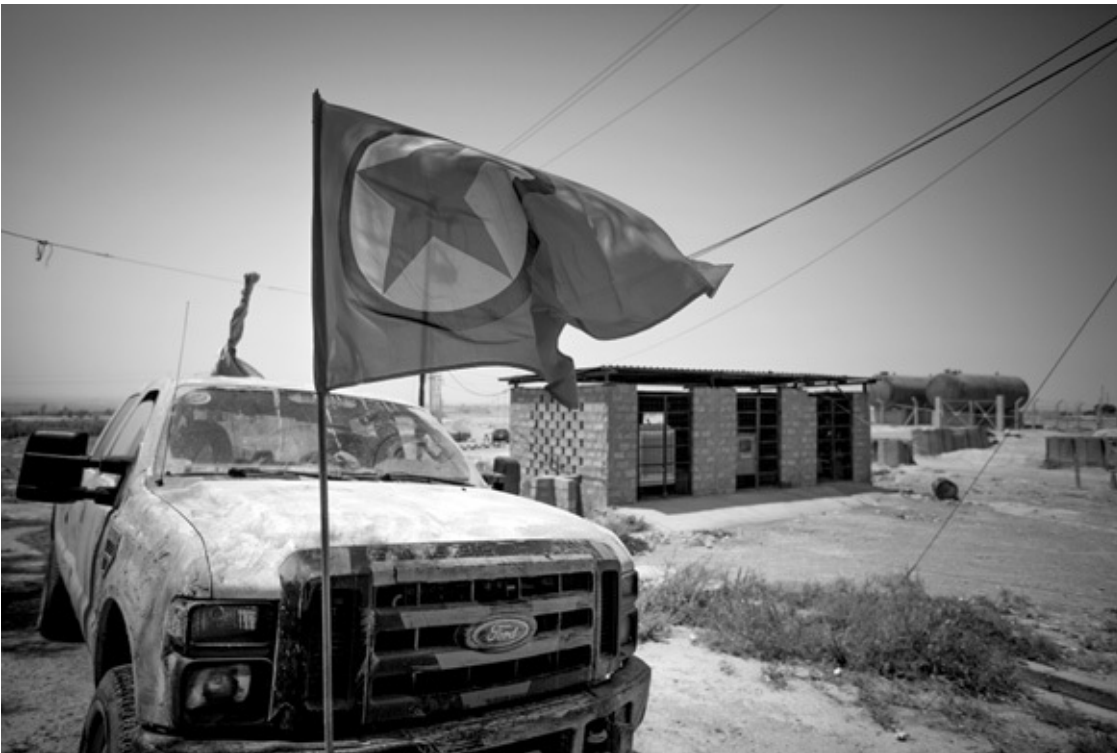
Machmur, Südkurdistan, 2014: Kontrollfahrzeug mit PKK-Fahne am Eingang zum ehemaligen UNO-Flüchtlingslager.