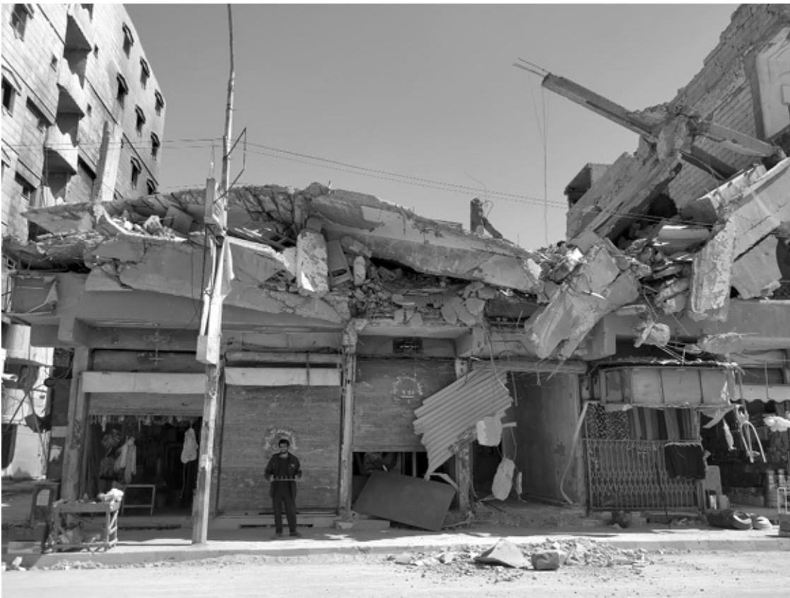
Raqqa im Frühjahr 2018

Ich war dann auch drei Tage in Raqqa. Ich wollte sehen, wie die kurdischen Kräfte in so einer arabischen Stadt versuchen, neue politische Strukturen aufzubauen, so kurz nach der Befreiung, inmitten all der Zerstörung. Man kann sich das gar nicht vorstellen. Die Amerikaner haben alles in Schutt und Asche bombardiert. Die Menschen leben in Ruinen. Es gibt kein fließendes Wasser,