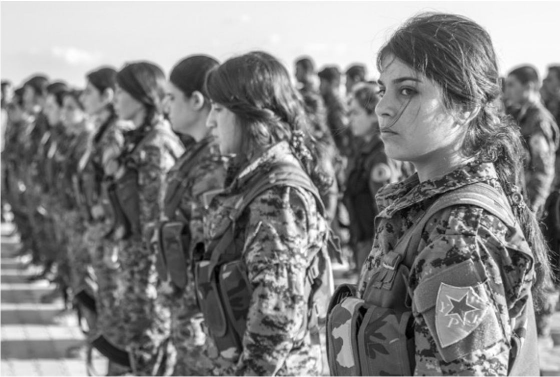
Rojava 2017: Beerdigungszeremonie für YPJ-Kämpferinnen, die am 15. April 2017 türkischen Luftangriffen auf das Hauptquartier in Qaracox zum Opfer gefallen sind