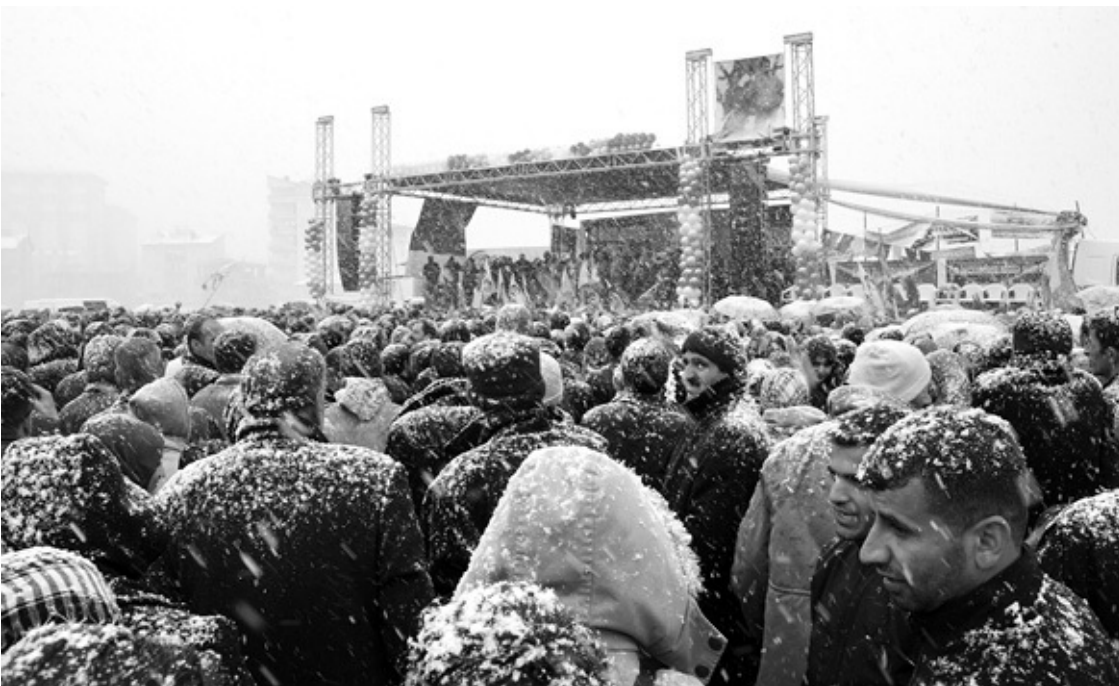
Hakkari, Nordkurdistan, 2013: Newroz-Feier