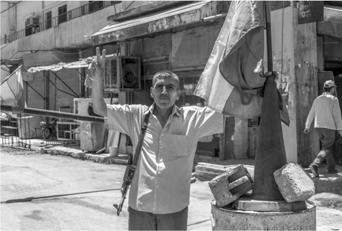
Qamischli 2017: Kämpfer der »Gesellschaftlichen Verteidigungskräfte« (HPC).