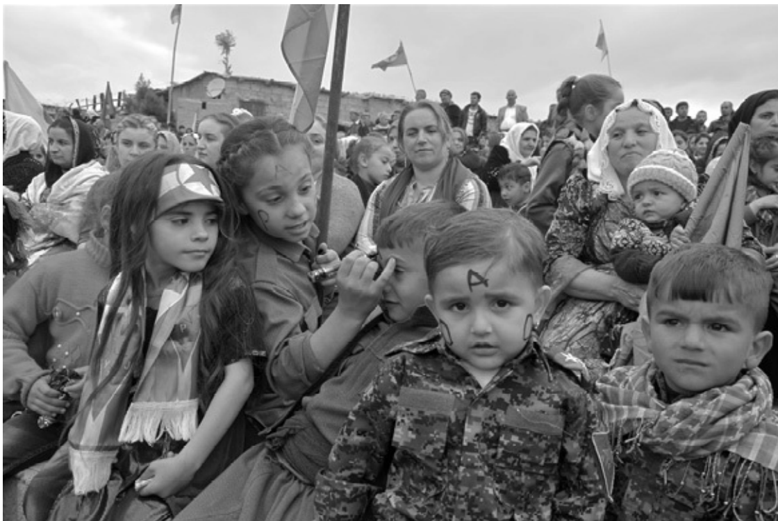
Machmur, Südkurdistan, 2017: Newroz-Fest

Druck aus Ankara. Das nächste Kapitel wird zeigen, dass der türkische Staat seit seiner Gründung 1923 alles getan hat, um genau das zu verhindern, was die Kommunikationsrevolution ans Licht brachte: eine kurdische Nation. Was einmal online ist, lässt sich schwer kontrollieren und noch schwerer löschen.