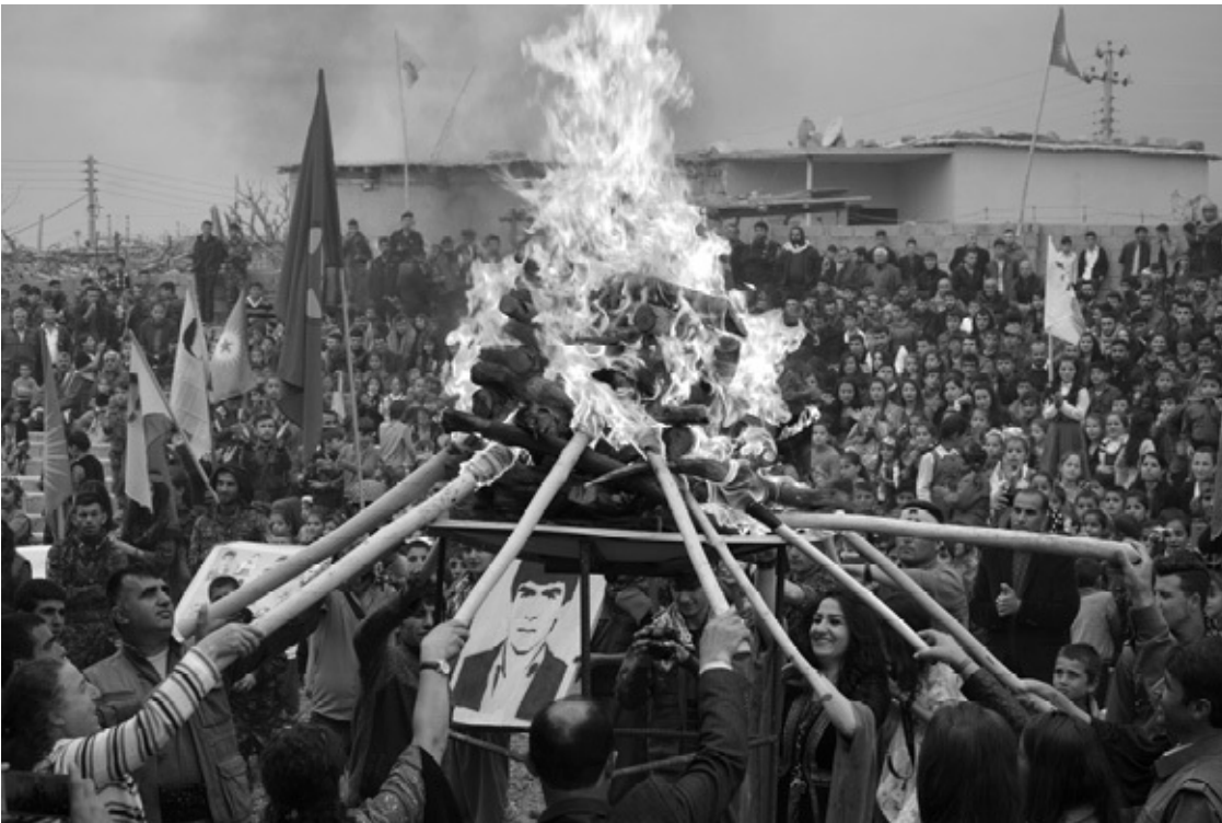
Machmur, Südkurdistan, 2017: Newroz-Feuer

Nationen sind nicht einfach da. Nationen werden geschaffen. Nationen sind ein »kulturelles Produkt«, entstanden Ende des 18. Jahrhunderts, als Bücher (richtige Bücher) alte Gewissheiten verschwinden ließen. Dass Herrschaft naturgegeben ist zum Beispiel und von Gottes Gnaden oder dass die Gelehrten die Wahrheit gepachtet haben. Benedict Anderson hat die Nation als »Erfindung« beschrieben, als eine Gemeinschaft, die sich vor allem auf Sprache stützt, auf eine gemeinsame Sprache, und als ein »Produkt unserer Vorstellungskraft«. 3 Das stimmt, einerseits, weil keine Deutsche alle anderen Deutschen kennt und auch niemals kennenlernen wird. Die deutsche Nation gibt es nur in unseren Köpfen. Andererseits verwischen Begriffe wie »Erfindung« oder »Vorstellungskraft« den Link zur Macht. Das Interesse, das die Herrschenden an der Idee haben, es gebe so etwas wie einen »kameradschaftlichen Verbund von Gleichen«, trotz aller sozialer Ungleichheit, trotz aller Ausbeutung des einen durch den anderen. Die Nation: Dafür ziehen Menschen in den Krieg und sterben. Einfache Menschen. Die Nation weist über uns selbst hinaus in alle Ewigkeit. Eine Gemeinschaft, die selbstlos zu sein scheint, so natürlich wie die eigene Hautfarbe. Man wird als Frau geboren, weiß, Ende des 20. Jahrhunderts. Und als Deutsche, Russin, Kurdin. Kein