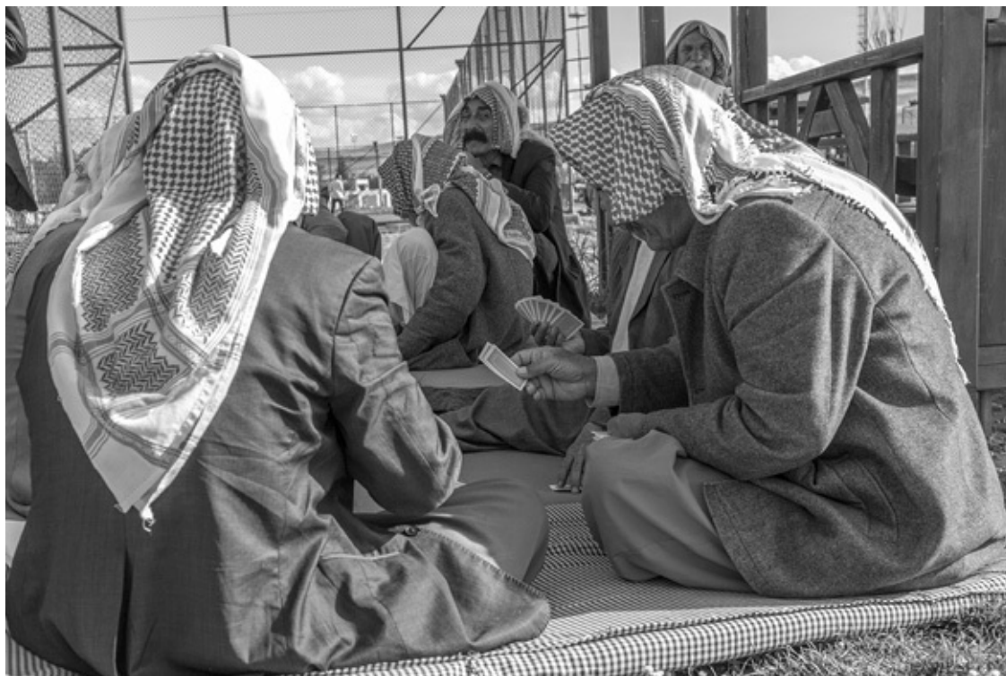
Diyarbakir 2016: Jesidische Männer im Flüchtlingslager Shingal

entscheiden sich, YPG und YPJ aus der Luft zu helfen. 55 Die Schlacht um Kobanê wird im Januar 2015 gewonnen.