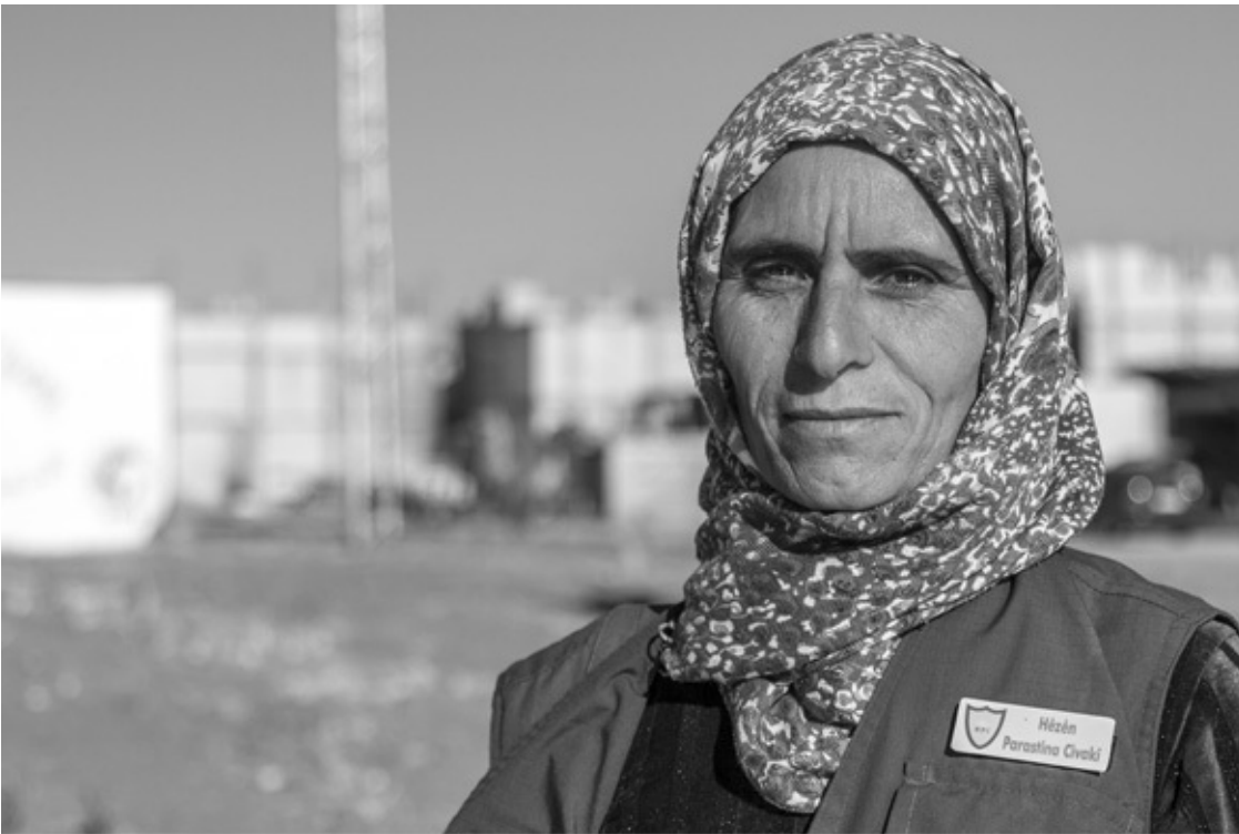
Kobanê 2017: Die »Gesellschaftlichen Verteidigungskräfte« (HPC) haben auch Frauenverbände (HPC-jin).

Es gibt in Rojava Dutzende Parteien. Klar: Die Hegemonie hat die kurdische Bewegung. Aber nicht über Repression, sondern weil die Bevölkerung das so will. Es gibt eine kommunistische Partei, es gibt eine liberale Partei. Die sind halt klein. Das ist aber nicht die Schuld der Bewegung. Du siehst in Qamischli Fensterscheiben, in denen Öcalan und Barzani hängen. Alle beide im gleichen Fenster. Es gibt total viele Bewusstseinsformen und total unterschiedliche Strömungen. Die PYD wird massiv überschätzt. Das ist ein diplomatisches Instrument, um nach außen zu kommunizieren. Die Macht liegt bei den Räten. Ich hatte in Rojava fast nie mit der PYD zu tun. Die draußen wollen halt mit Parteien reden. TEV-DEM ist wichtig. Die Räte. Das mit der PYD wird total dramatisiert. Als würde die PYD Rojava regieren. Das ist wirklich nicht der Fall. Die PYD-Leute sitzen auch in Räten. Aber da sitzen die anderen auch.«