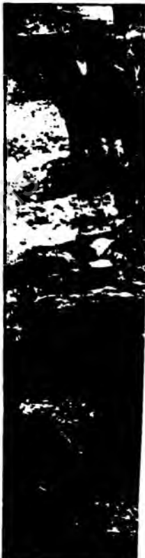
Så ser döden ut i Kamishi, en berättelse. Byborna har samlats

Men de turkiska krigarna som kämpade i Irak för att driva ut turkiska soldater som hade kommit till Irak för att hjälpa till med att bekämpa den turkiska armén.