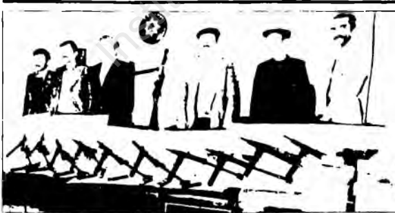
12 Eylül devri büyük keskin kahramanlar'a mensup. Bonn Çarşısı tabelası. Foto'daki olaylar ve hazırlıklar artık herkesin bilincinde. Yurtta "kendi olayın" taşıdığı önemden dolayı, ancak Bonn Çarşısı tabelasında...

Bonn Büyükelçiliği, bildiri yayınlarak "bir avuç şaşırılmışın çıkardığı sayılarla uygun olmayan gürültü kısılacak" dedi