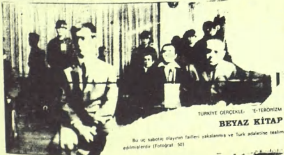
Sabotej sanıklarının yargılanması. Sağamayı dinleyen sanıklardan b

2. Marmara Adli Yolu Cemalinin Yakılması: Bu sabotej da, Kültür Sarayı'na sabotej yapıldığı ve okula getirilmiştir. Bakım için Halic Teranesine alınan gemi kamaronu sabotejlerinin başında bulunan iki kişi ve 30.000 lira varlığı vâdile kaldırılmıştır. oğduğu 4/5 Mart 1972 gecesi, sulcu gemiden ayrı olarak sarhos hale getirilmiş ve ayrıca okula vâdilerak kamaronu bu halde tekar gemiyâ getiren sabotejler kamaronu bu halde vâdilerak sarhos oldu. sarhos oldukları için, bu gemi adamdır. sarhos oldukları için, bu gemi adamdır. sarhos oldukları için, bu gemi adamdır. sarhos oldukları için, bu gemi adamdır.