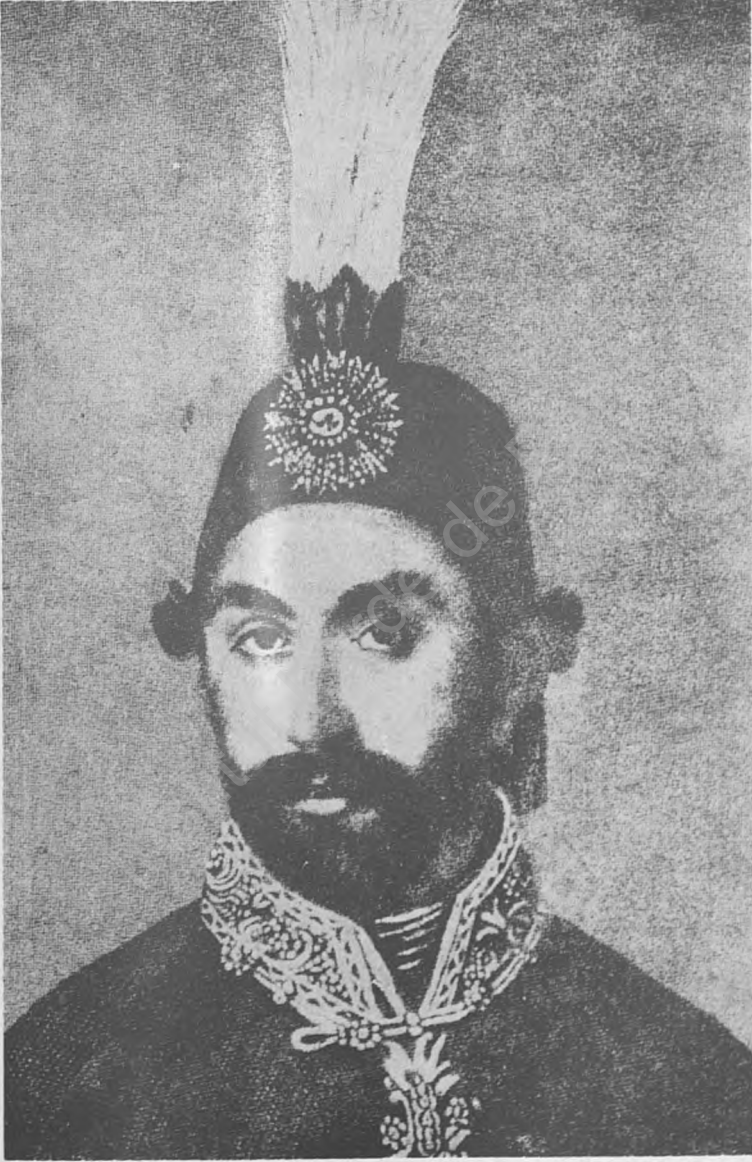
Res. 1 — Sultan Abdülmecid Han “1839—1861”