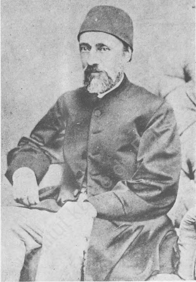
Res. 6 — Mehmet Emin Âli Paşa