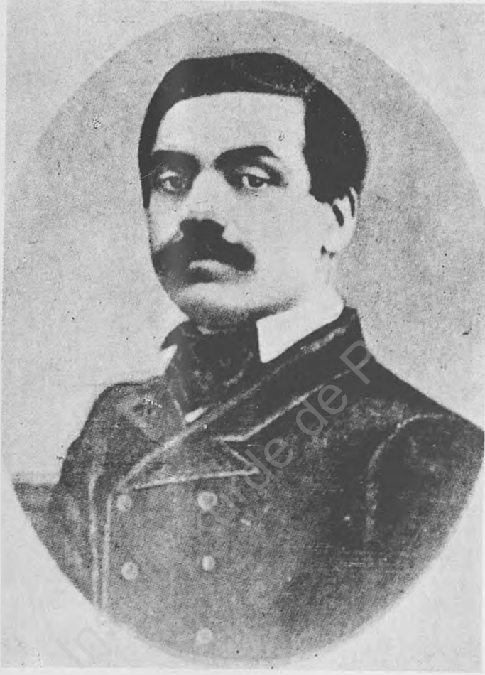
Res. 8 — Şinasi