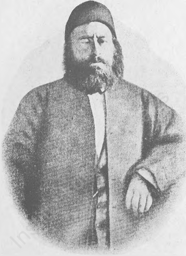
Res. 5 — Mısır Valisi Mehmet Said Paşa