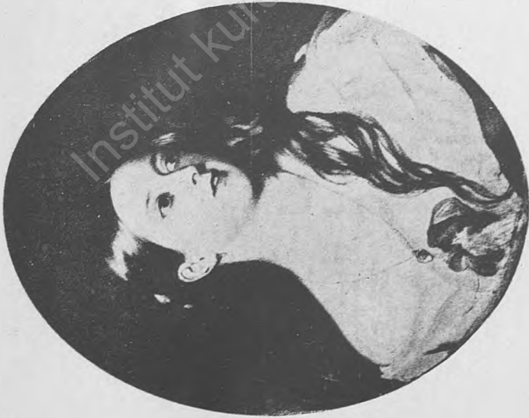
Res. 3 --- İngiltere Kraliçesi Victoria