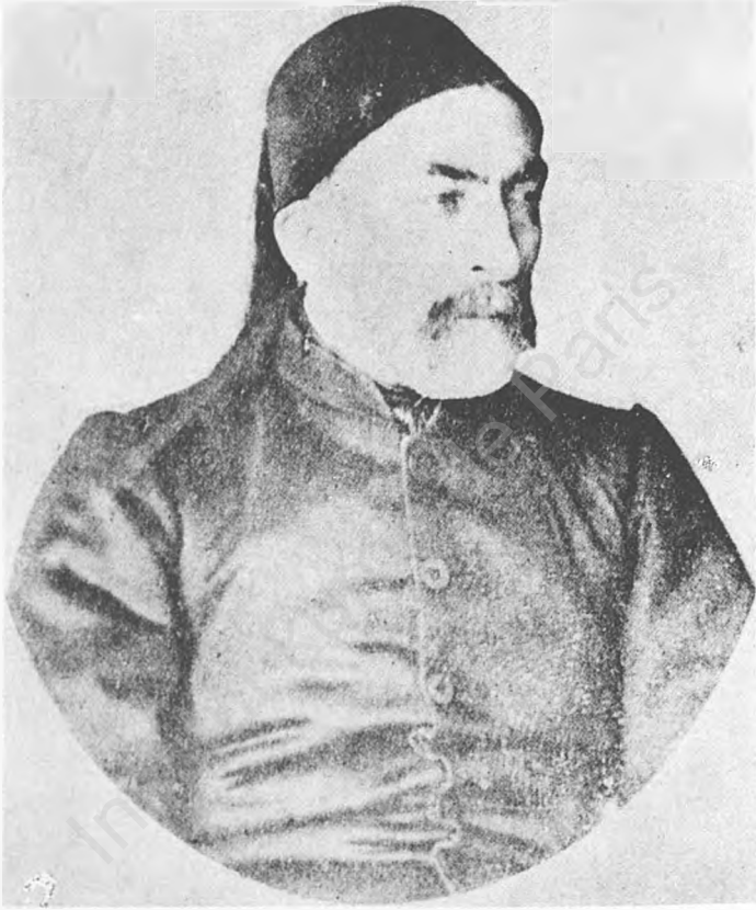
Res. 7 — Kibrıslı Mehmet Emin Paşa