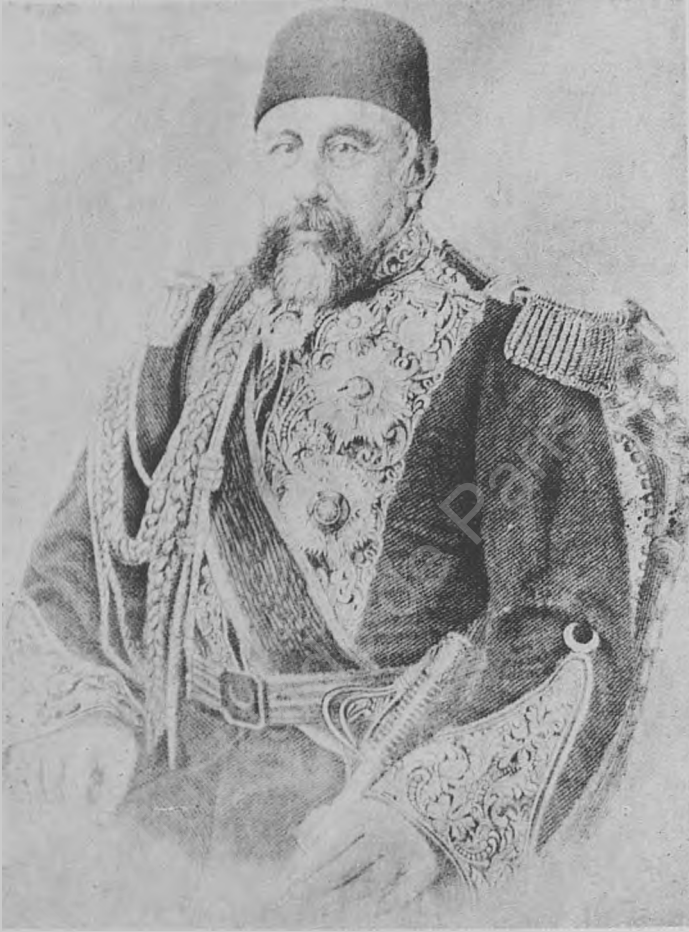
Res. 2 — Fuat Paşa