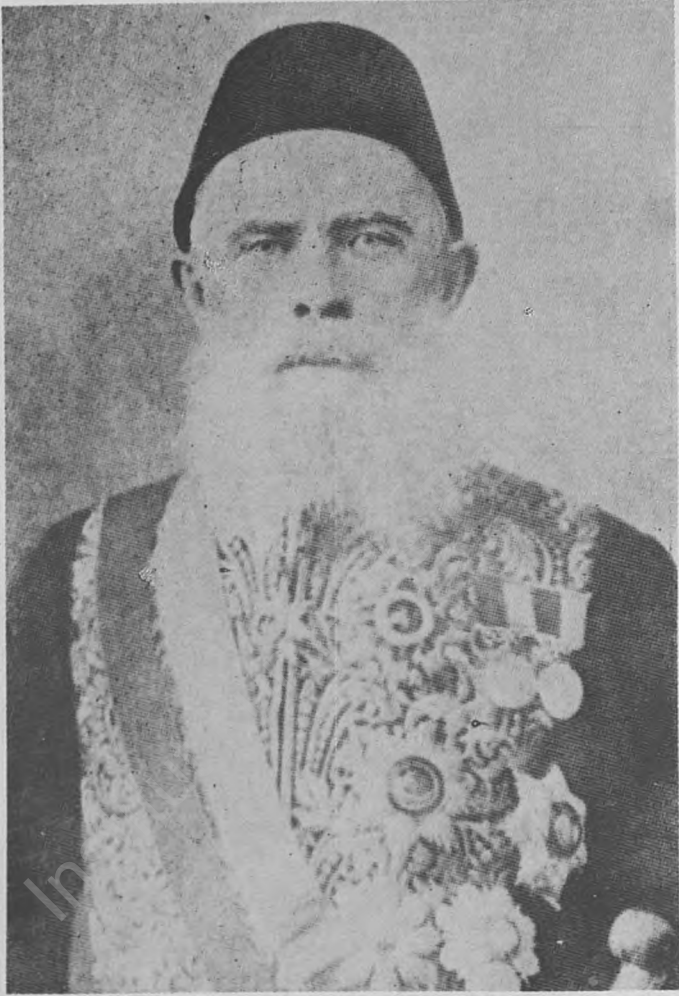
Res. 9 — Ahmet Cevdet Paşa