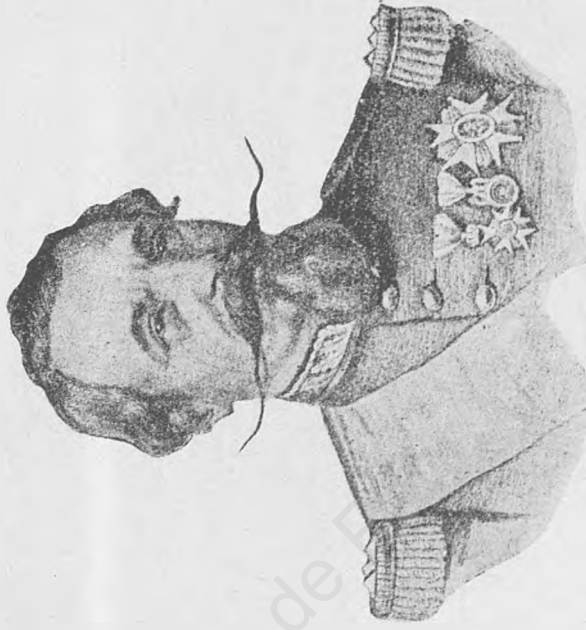
Res. 4 --- Fransızlar İmparatoru III. Napoléon