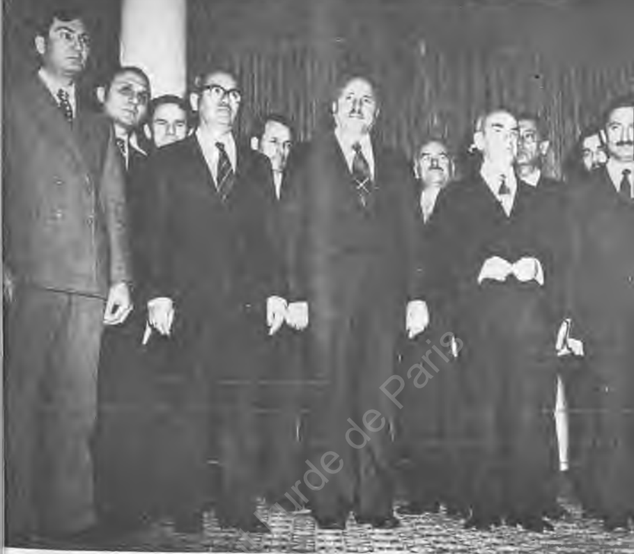
5) Kabine Köşk'te Korutürk'le