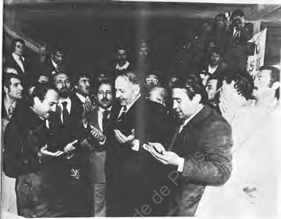
11) Erbakan ve Asiltürk, duaların ardından şartele basıyorlardı.

Fakat toplum yapısı iktisadi ve sosyal gidişin gerçeği çatışmalara sahne oluyor, eğitim-öğretim yuvaları kadar memur-işçi kesimlerinde de ideolojik kavga ve sapmalar görülüyordu..