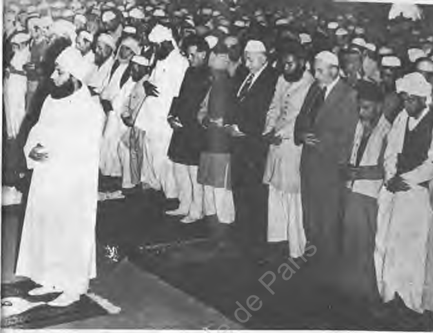
17) Erbakan, Pakistan'daki Şirket Konferansında namazda

ri ve küstahlıkları da oradan gelmiyor mu?"