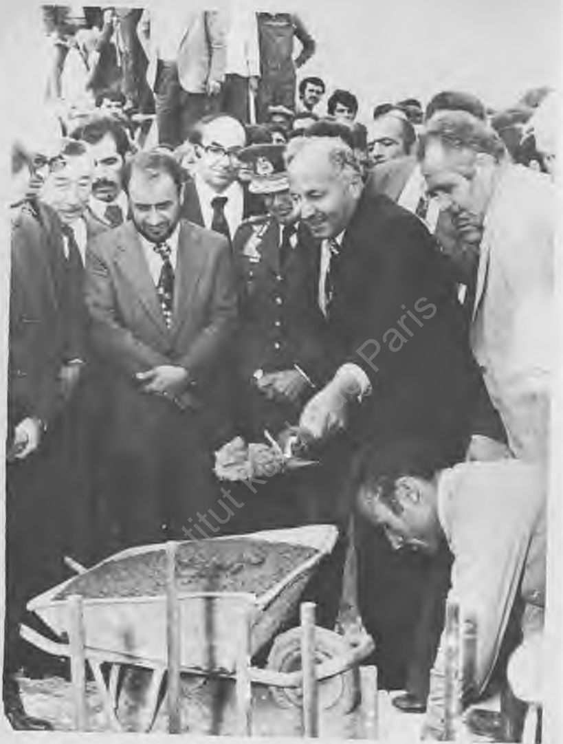
9) Ülkede temeller açılıyor, harç konuluyordu.