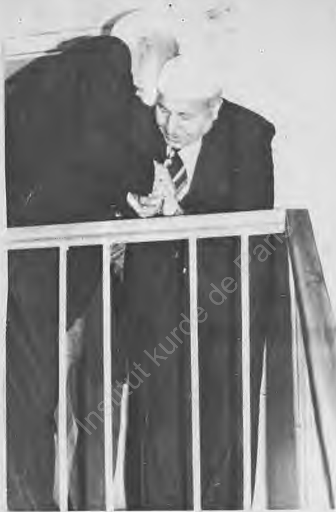
32) Erbakan, ulemâ ile kucak kucağa yine yürüyordu.