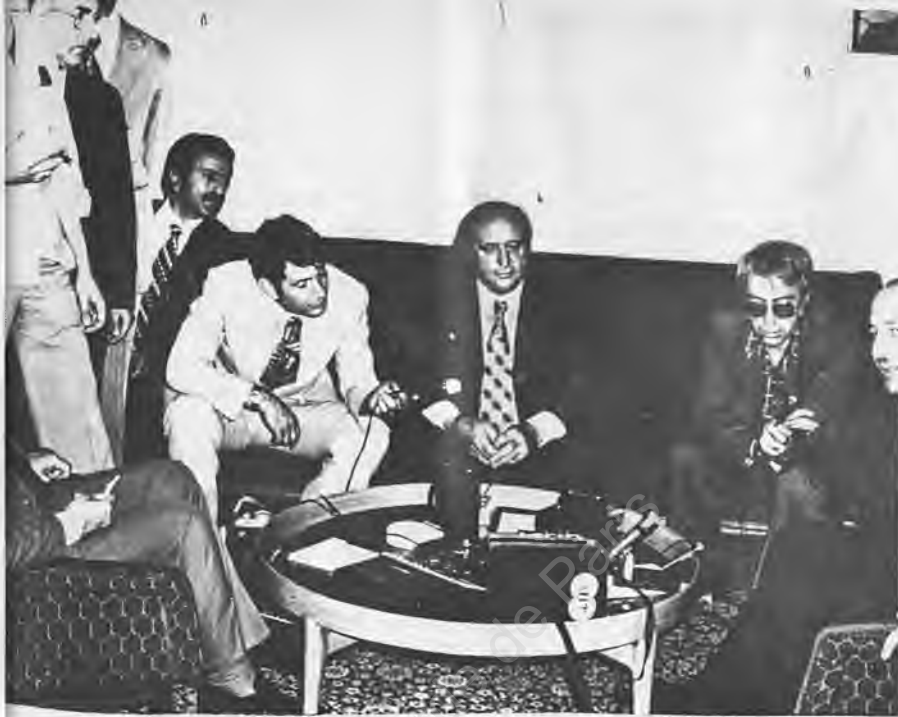
7) Yeni bir hükümet için Erbakan-Demirel basın karşısında