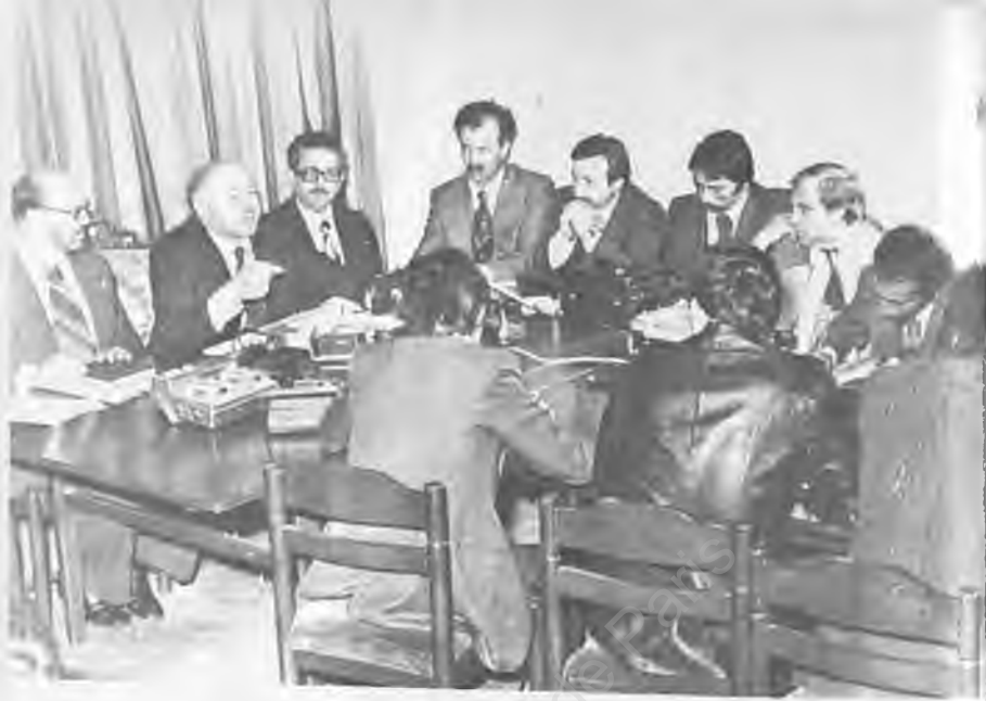
24) Erbakan, ülkenin kötü gidişini anlatıyor

Hükümet değişmesi ile anarşinin durmadığı, aksine fikir karmaşası içinde, iktidarı kaybeden Demirel'in "feryadı"nın "arkadan hançerlenmekten" ileri geldiği ifade edildiği bir ortamda, MSP için söylenen ve uygulanmak istenen hukuki icraatı, AP'ye destek olan bir kısım "dinci" çevreler Başbakan Ecevit'le, olayın patlak vermesinin ardından Erbakan'ın görüşmesi, "MSP, Halk Partisi'ne teslim oldu." şeklinde yorumlamışlardır. Çünkü MSP'nin derdi TCK'nın 163. maddesinden olduğu gibi, solun da rahatsızlığı TCK'nın 141-142. maddeleri idi. Ecevit ile Erbakan sanki iki ayrı cephe teşkil eden fikri hareketin, madde planında ortadan kaldırılması için anlaşması gibi bir hava ortaya çıkartılmıştı. Ortak iken yapamadıklarını şimdi nasıl yapacaklardı? "Nurcu" takımından AP yanlısı "Yeni Asya"da, Ümit Şimşek "Erbakan parti-