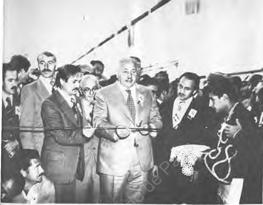
16) Erbakan'ın fabrika üstüne fabrikanın açılışını yapıyor...