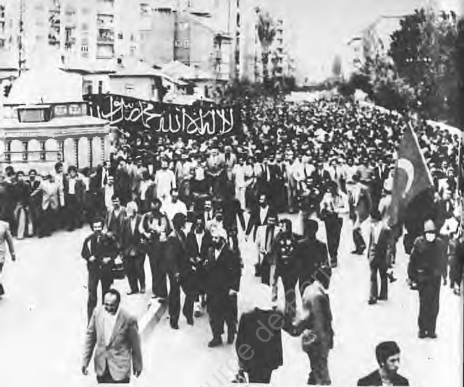
30) Konya yürüyüşü "12 Eylül"e mesnet sayılmıştı.

"İslamiyete dönüş hareketinin başlaması karşısında düşmanların elleri kolları bağlı olarak durmayacakları kuşkusuzdu. Bundan dolayıdır ki, bütün güçler ve diğer partiler, Selamet Partisini düşürmek amacıyla sondan önceki seçimlerde 3 milyon sahte oy kullanmak üzere aralarında birleşmişlerdir." (198)