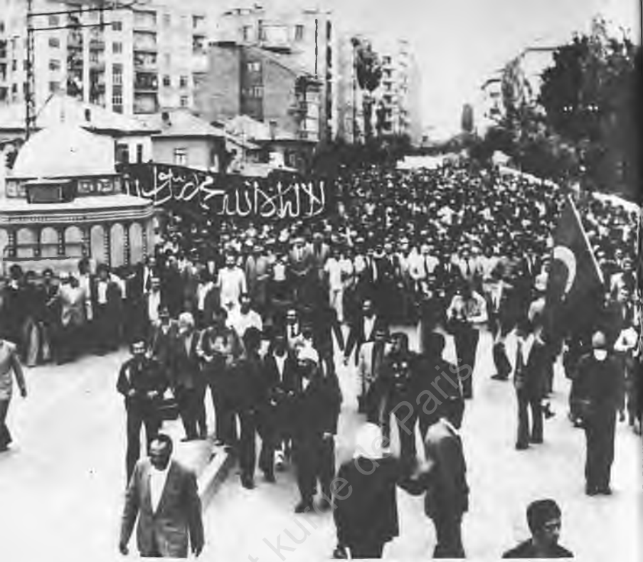
29) "Kudûs'ü Kurtarma" yürüyüşü: Konya